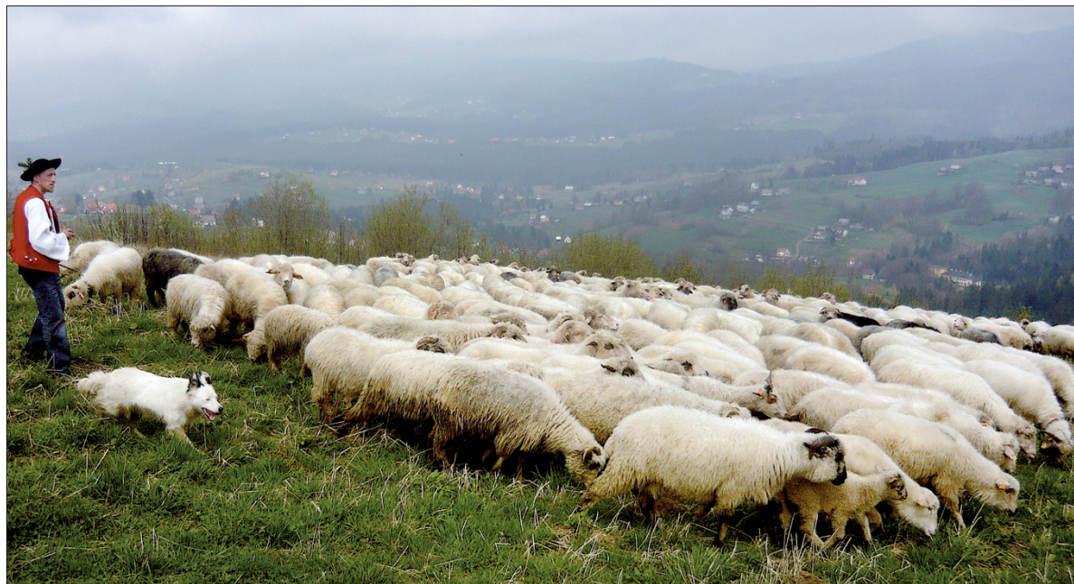
W Beskidzie Śląskim rozpoczął się wypas owiec.

Na stronie poświęconej gwarze Śląska Cieszyńskiego (gwara.zafrisko.pl) o myszaniu można przeczy-