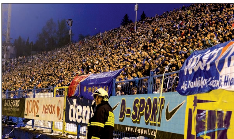
Mecz Banika ze Spartą obejrzał komplet publiczności.

Nawsie – Palkowice 3:1, Bukowice – Rzepiszcz 0:2, Piosek – Wacławowice 1:2. Lokaty: 1. Frydek-Mistek 50, 2. Rzepiszcz 41, 3. Palkowice 39 pkt. (jb)