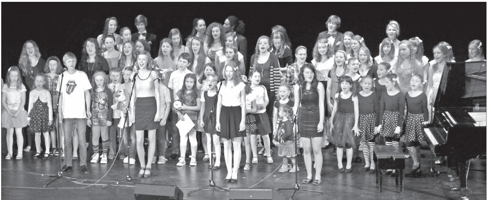
„Uwaga, uwaga, uwaga, niech na chwilę zatrzyma się świat...” – zaśpiewali w finale wszyscy wykonawcy.