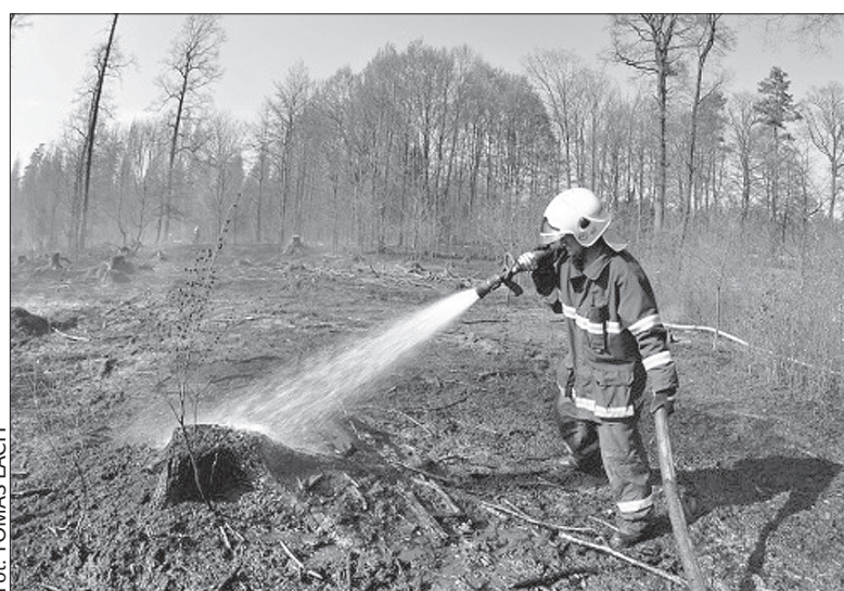
Akcja gaśnicza w hawierzowskim lesie.

– Uratowały przed ogniem leśniczówkę. Zaczynało się już palić ułożone na podwórku drewno opałowe – poinformował rzecznik Wojewódzkiej Straży Pożarnej, Petr