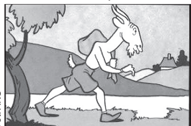
Mimo 80 lat na karku Koziołek Matołek trzyma się niezłe.