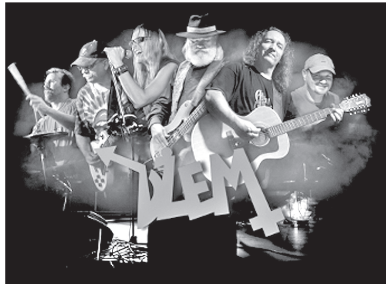
Gwiazdą sobotniego wieczoru będzie zespół Dżem.

Bogumiński ratusz już wcześniej zwrócił się do mieszkańców z podobnym apelem. Chodziło wówczas o zdjęcia Domu Narodowego z zewnątrz. Dzięki nim udało się zaprojektować kolor oraz ornamenty na elewacji. (sch)