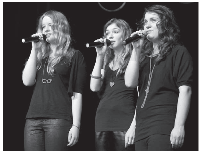
Wyróżniony tercet z Wędryni.