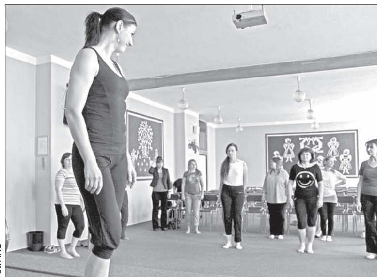
Najpierw ćwiczą nauczyciele, potem dzieci.