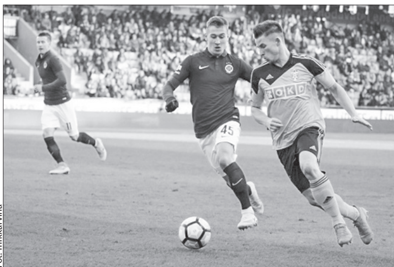
W listopadzie w Pradze ze zwycięstwa 3:0 radowała się Sparta.