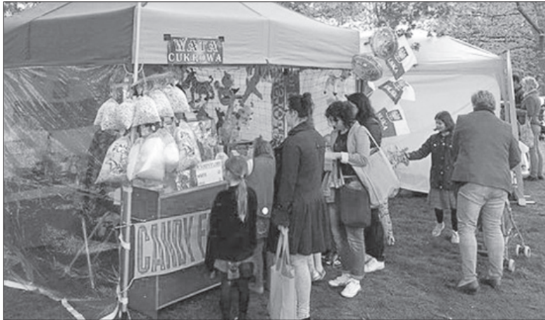
Wata cukrowa to jeden z najbardziej ulubionych przez dzieci elementów polskich pikników.

W Edynburgu chętni mogli wziąć udział w organizowanej przez lokalny oddział ZHP grze miejskiej „w poszukiwaniu biało-czerwonych”, która miała przybliżyć jej uczestnikom polską historię. Z kolei w miejscowości Ingham w East Midlands odbył się dzień otwarty w dawnej bazie brytyjskiego lotnictwa, gdzie w