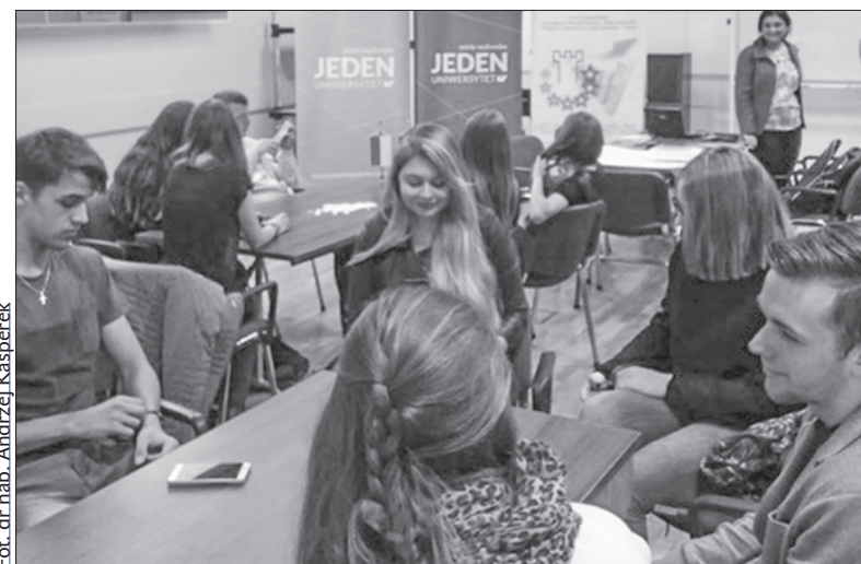
Pierwsze warsztaty w kwietniu w ramach Polsko-Czeskiej Wolnej Szkoły.