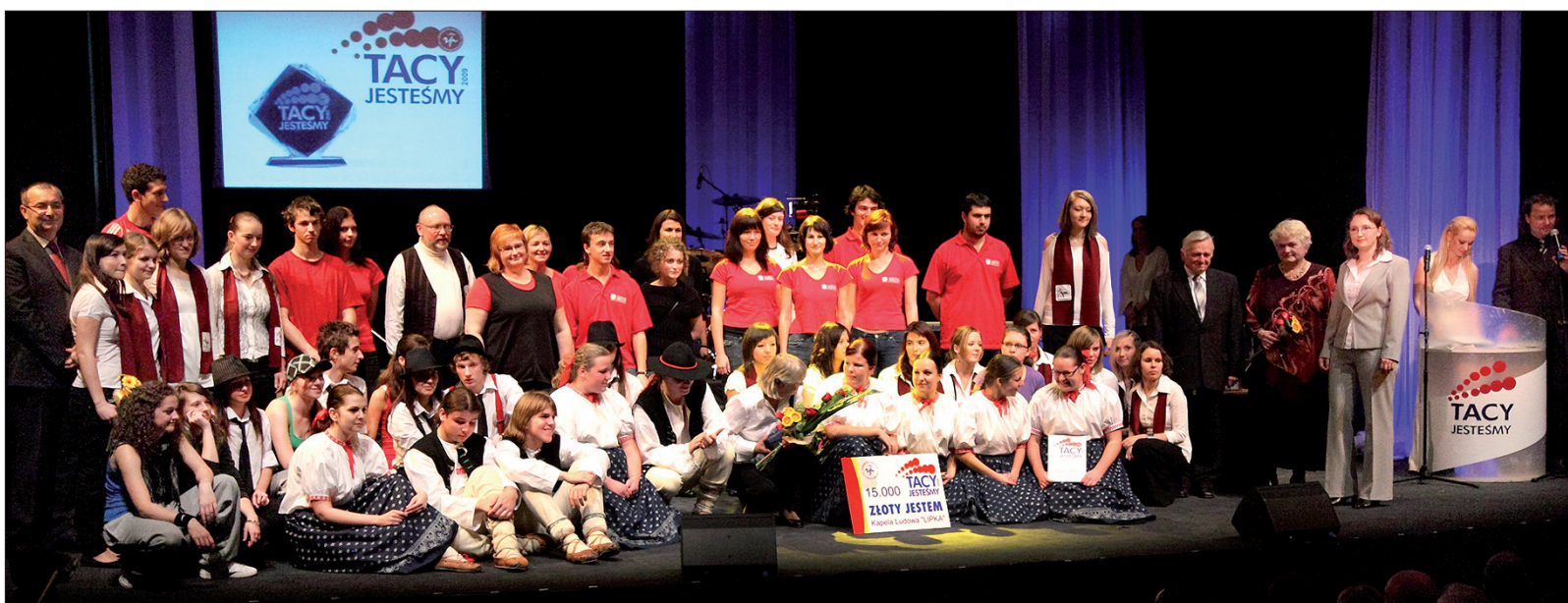
Województwo tradycyjnie wspiera finansowo imprezę „Tacy jesteśmy”, organizowaną przez Kongres Polaków w RC.

Kongres Polaków otrzymał po 70 tys. koron na dwa projekty – „Tacy jesteśmy” i prowadzenie Ośrodka Dokumentacyjnego, Zarząd Główny Polskiego Związku Kulturalno-Oświatowego 70 tys. na 5. Dzień Tradycji i Stroju Regionalnego oraz 56 tys. na wykłady Międzygeneracyjnego Uniwersytetu Regionalnego. 70 tys. koron województwo przyznało również Miejscowemu Kołu PZKO w Hawierzowie-Błędowicach na 41. Dożynki Śląskie. Z kolei Stowarzyszenie Przyjaciół Polskiej Książki otrzyma na projekt „Z książką na walizkach 2010” dotację w wysokości