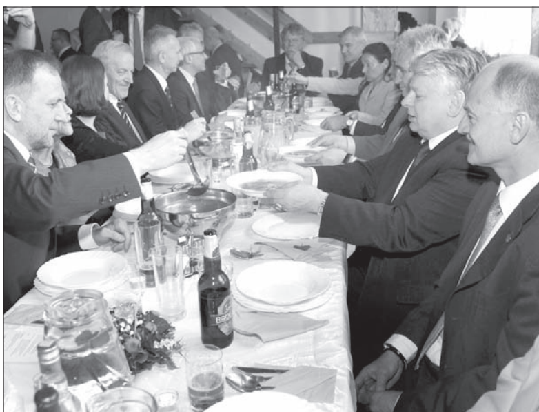
Zaczyna się ucztować w Nawsiu...

Goście obejrzeli również zapierające dech w piersiach popisy wę-