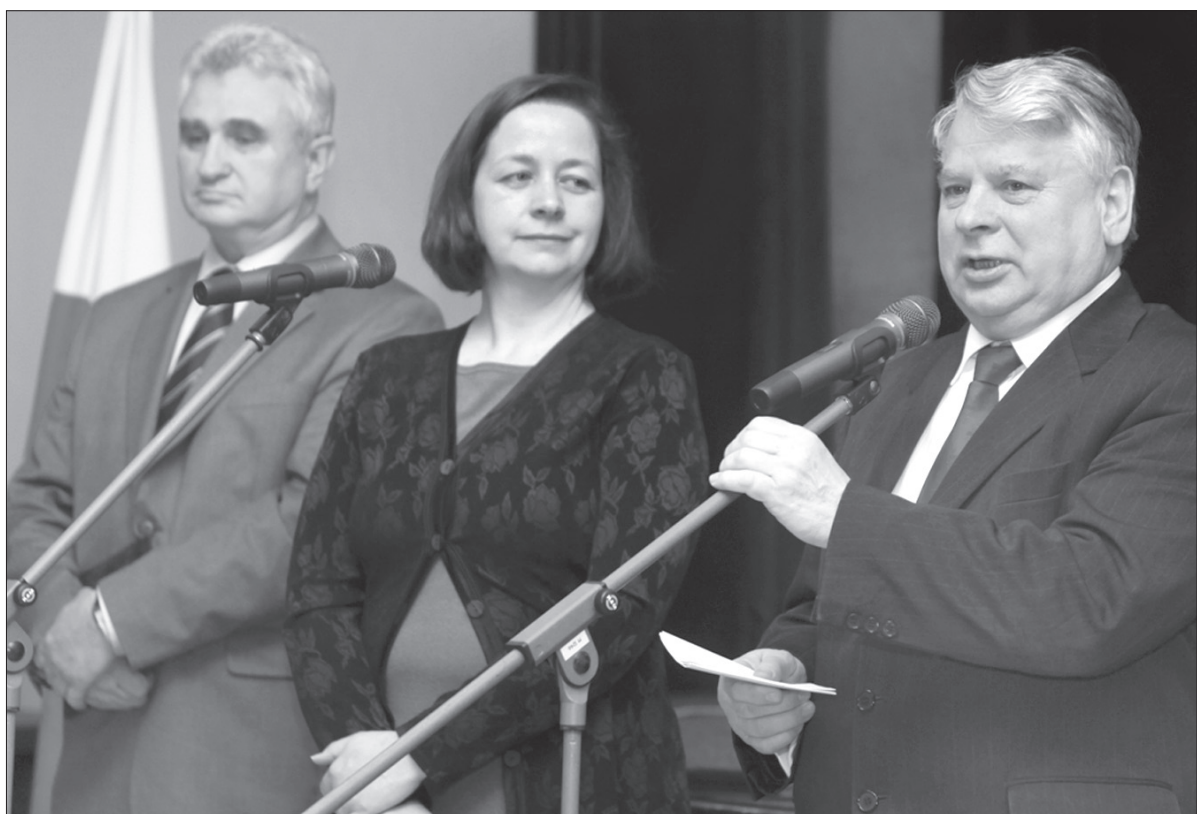
Marszałkowie Senatów RC i RP: Milan Štěch oraz Bogdan Borusewicz podczas spotkania w „Strzelnicy” w Cz. Cieszynie.

– Przyjąłem zaproszenie pana marszałka, by móc wam podziękować za waszą aktywność, za to, że współtworzyacie przyjazne stosunki pomiędzy naszymi krajami. Chciałbym was poprosić o to samo na przyszłość – powiedział marszałek czeskiego Senatu. Przypomniał, że również w Pradze żyje wielu Polaków, z którymi czę-