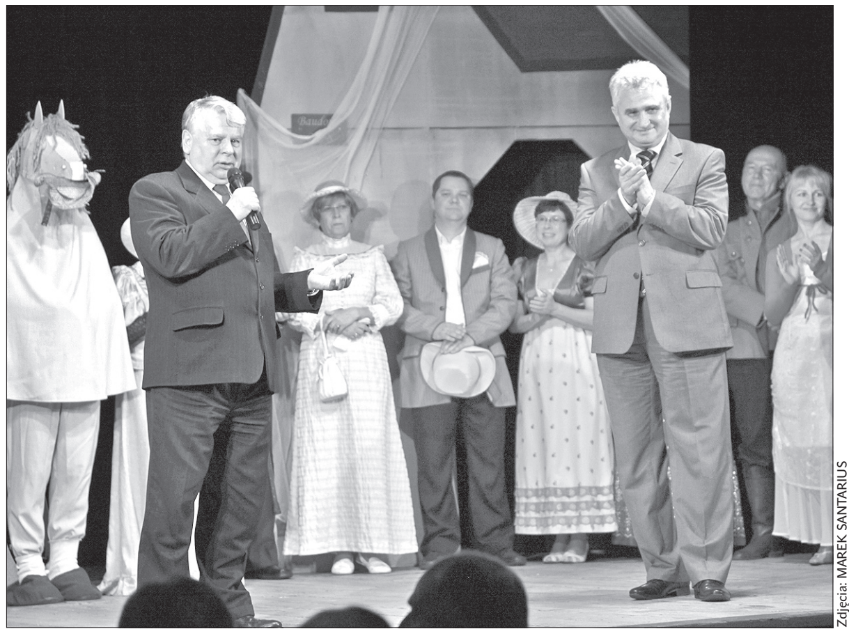
Marszałkowie Bogdan Borsewicz i Milan Štěch składają życzenia wędryńskim aktorom.