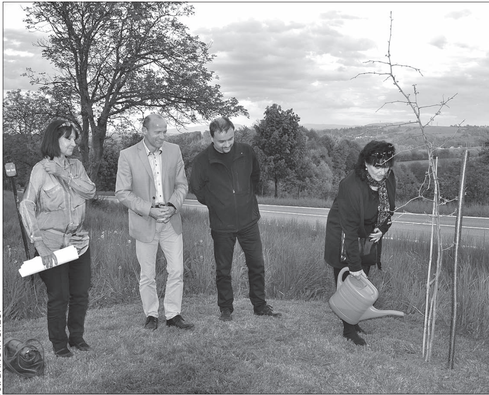
Podczas „Spotkania z historią” zostało uroczystie podlane „Drzewko Pamięci”.