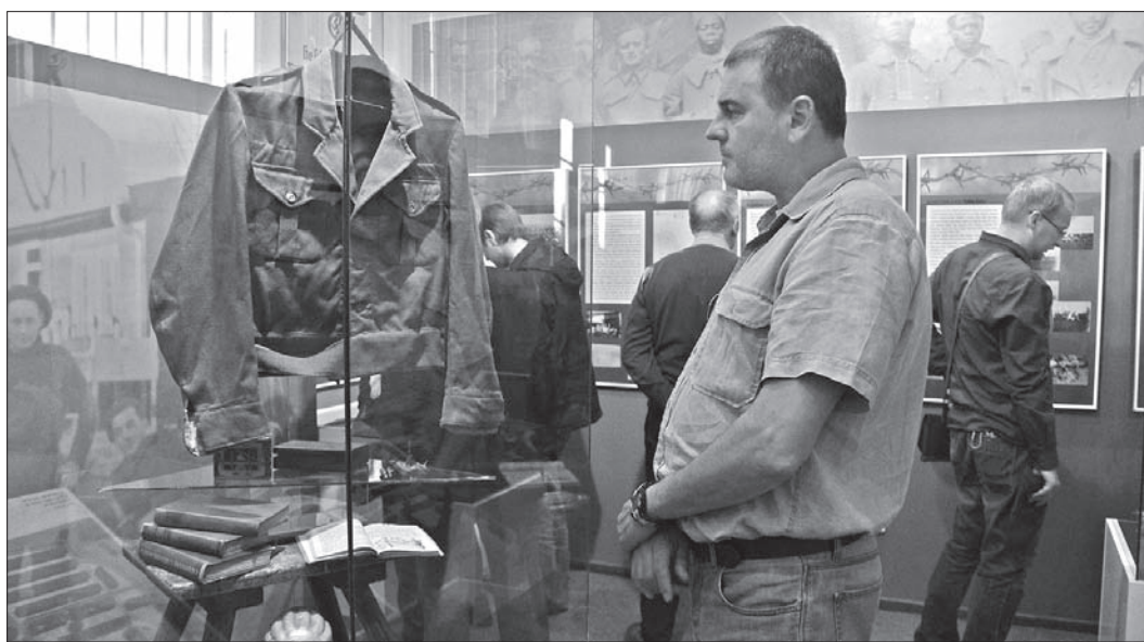
Wystawa poświęcona obozom jenieckim w czasie II wojny światowej w Muzeum Ziemi Cieszyńskiej w Cz. Cieszynie.