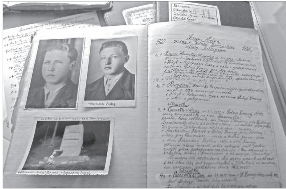
Pamiątki zebrane na wystawie to głównie dokumenty, m.in. rękopisy z relacjami świadków.

Finał wystawy poświęcony został natomiast