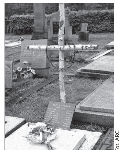
Mogiła z nową tablicą na ewangelickim cmentarzu.

W środę po południu w Stonawie odbyła się uroczystość wspomnieniowa oraz „Bieg Zwycięstwa” – tradycyjne zawody sportowe dla uczniów szkół podstawowych ze Stonawy i okolicy. Udział wzięła również zaprzyjaźniona szkoła z polskich Markłowic. (dc)