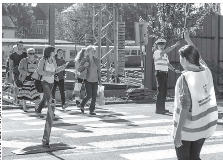
Jedna z wolontariuszek odbywa szkolenie na tymczasowym przejściu.

tek szkolenie wolontariuszy, których już w przyszłym tygodniu będziemy mogli spotkać na przejściach dla pieszych. Odbywało się ono przy ulicy