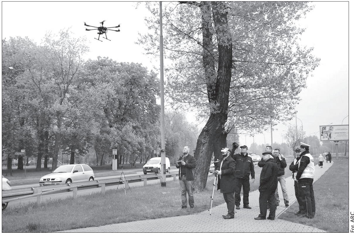
Taki dron już wkrótce będzie postrachem na Śląsku Cieszyńskim.

W czasie, gdy nad głowami pieszych i kierowców latał dron, policyjny patrol oddalony od miejsca