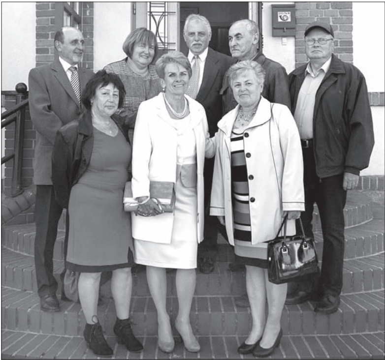
Absolwenci polskiej podstawówki w Suchej Górnej z roku 1968.

Absolwenci wszystkich roczników z polskiej podstawówki w Suchej Górnej spotykają się co dwa lata, żeby wspominać dawne dzieje. W sobotę w Domu Robotniczym w Suchej Górnej odbyła się trzecia edycja tej imprezy. Poza spotkaniami, absolwenci poszczególnych roczników or-