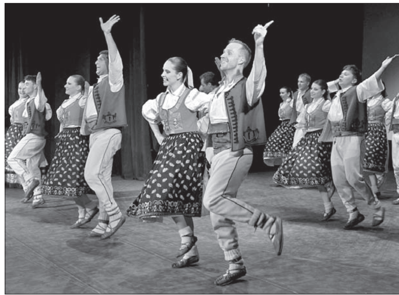
Publiczności zaprezentował się także zespół „Olza”.