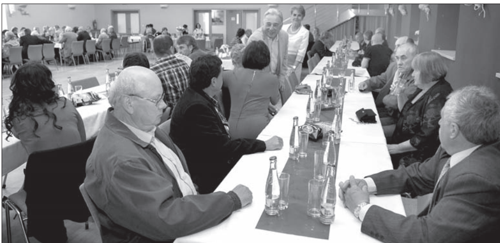
W sali Domu Robotniczego zgromadziło się blisko 300 osób.