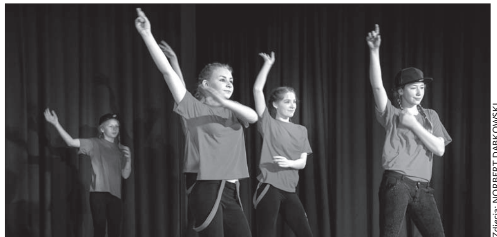
Street dance w wykonaniu uczennic klas 6.-9.