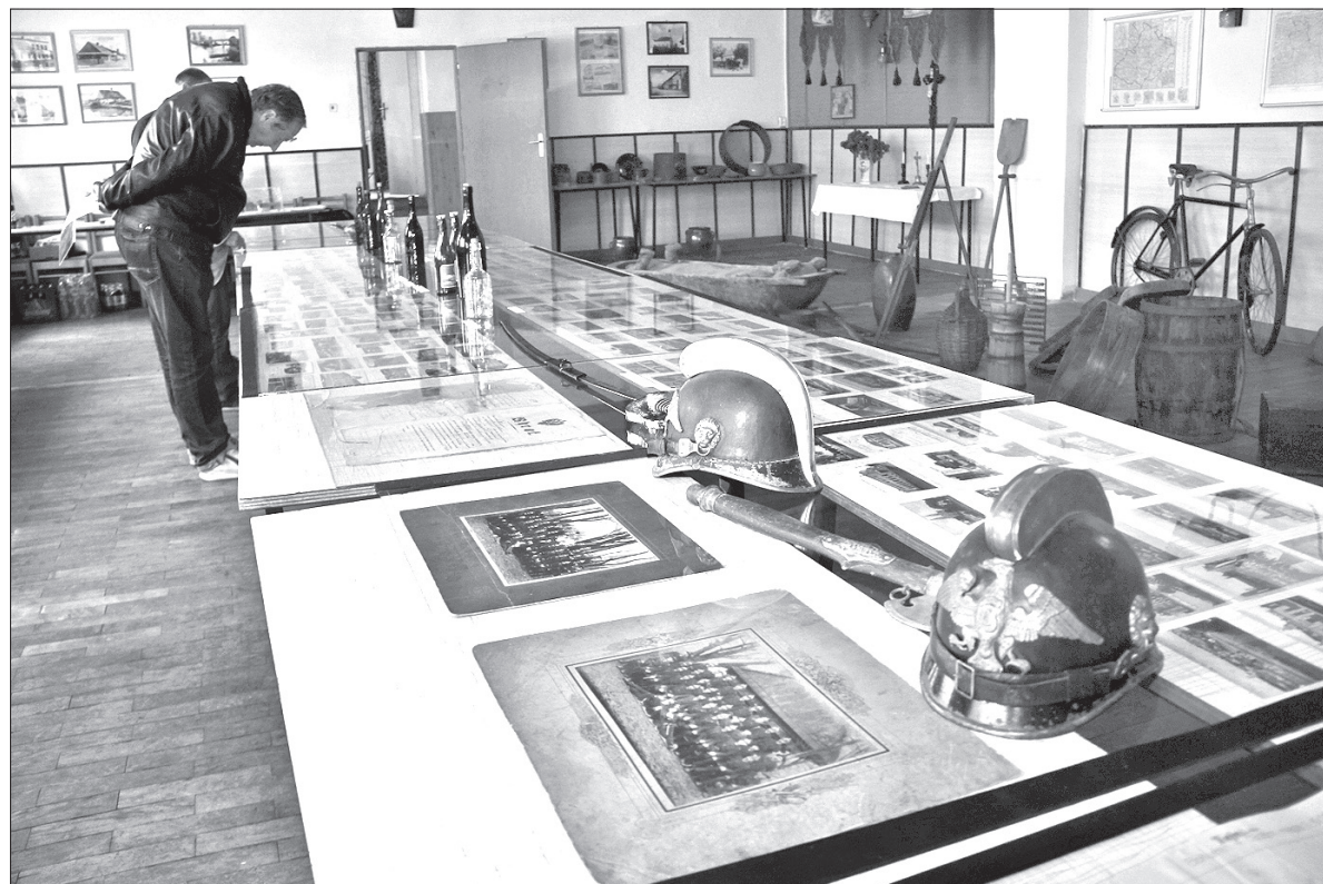
Na wystawie można było zobaczyć wiele ciekawych eksponatów.