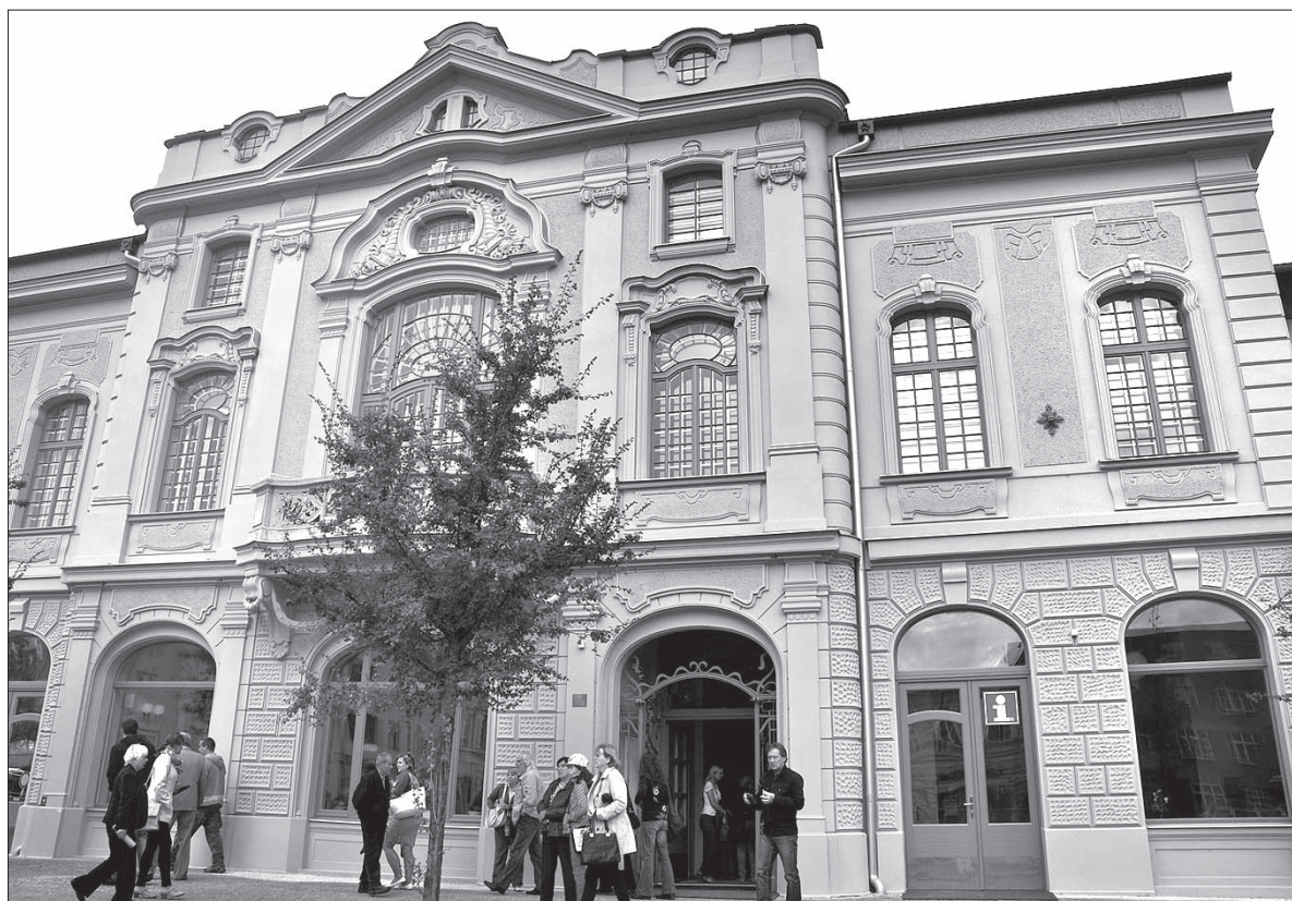
Wyremontowany Dom Pod Zielonym Dębem przyjął pierwszych gości we wrześniu ub. roku. Teraz zostanie tu otwarte również muzeum.

znajdą się nie tylko te, które do tej pory leżały w depozytach muzeum w Czeskim Cieszynie, ale również przyniesione przez prywatnych kolekcjonerów oraz organizacje społeczne i stowarzyszenia. Miasto już w ub. roku zwróciło się bowiem do mieszkańców i nie tylko z prośbą o wypożyczenie historycznych artefaktów związanych z Boguminem z okresu do 1948 roku. – Ekspozycja w Muzeum Miejskim zostanie ponadto uzupełniona o eksponaty z nieistniejącego już Muzeum Huty i Druciarni Bogumina, jak np. zegar rejestrujący czasy przyjazdu i wyjścia pracowników z zakładu czy tablica upamiętniająca pierwszy odlew żelaza, do którego doszło tutaj w 1888 roku. Z kolei miejscowa