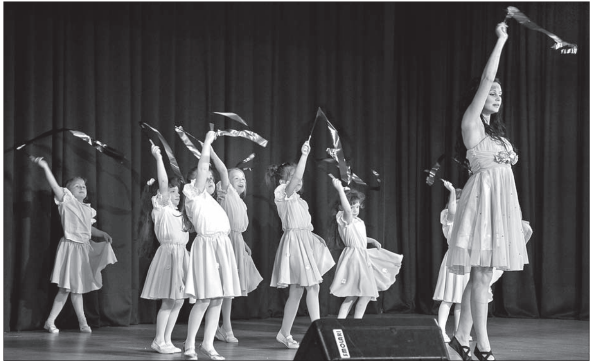
Taneczne popisy przedszkolaków.