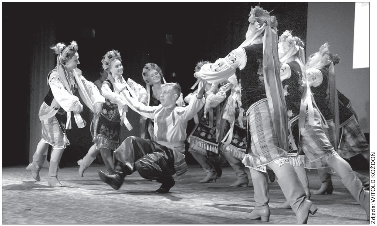
„Perła” na deskach cieszyńskiego teatru.

„Perła” wygrała telewizyjne show, pozostawiając w pokonanym polu osiem grup litewskich i jedną łotewską. Polski zespół pochodzi z Niemenczyna, niewielkiego miasteczka położonego niedaleko Wilna. Został założony w 2004 roku i skupia dzieci i młodzież w wieku od 5 do 21 lat.