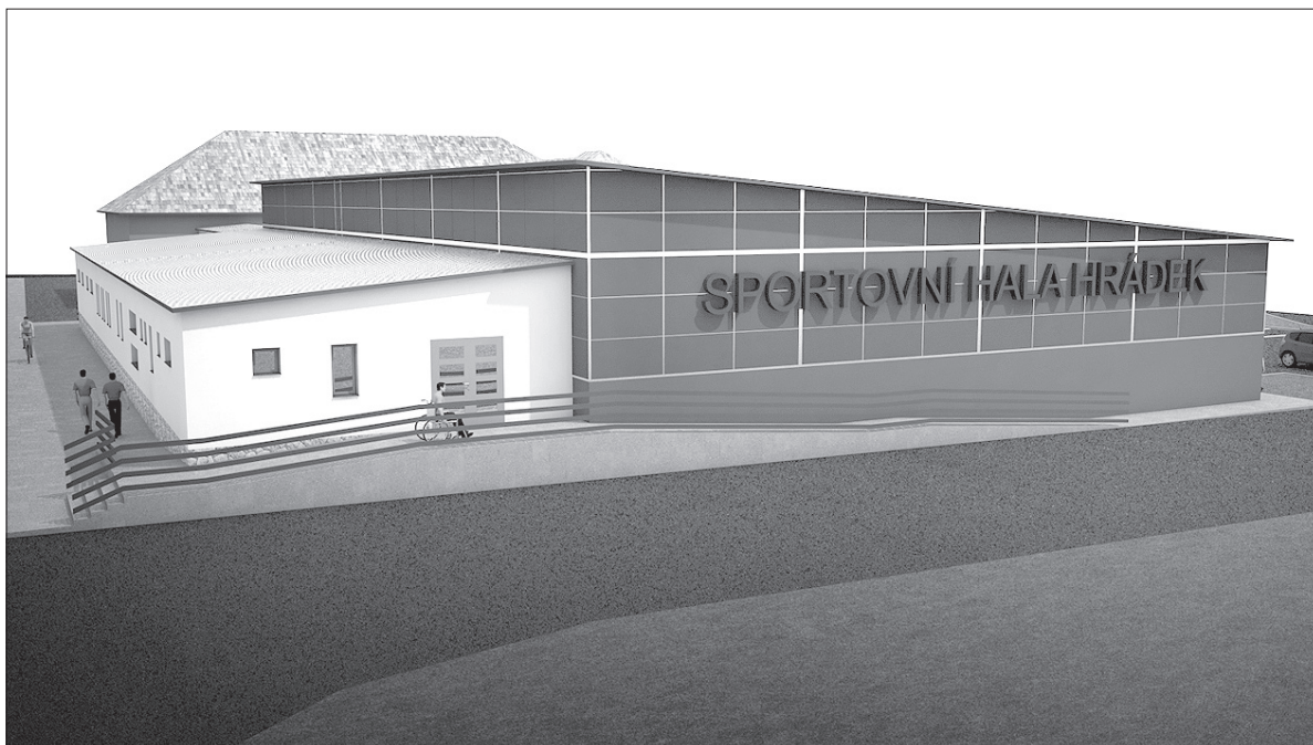
Tak wyglądać będzie nowy kompleks sportowy w Gródku.

Już wiadomo, jak będzie wyglądać nowa hala sportowa w Gródku, która powstanie obok czeskiej szkoły podstawowej. Jeden z czterech wariantów projektu wybrali radni gminy na swoim ostatnim posiedzeniu. Głównymi kryteriami wyboru były cena i praktyczność. Na pełnowymiarowym boisku o wymiarach 40 na 20 metrów będzie można pograć w unihokeja, futsal czy piłkę ręczną. Powstanie trybuna na pięćdziesiąt miejsc. – Hala służyć będzie m.in. uczniom miejscowych podstawówek, dlatego zdecydowaliśmy o wybudowaniu większej liczby szatni. Pierwotnie miały być trzy, ale powstaną cztery, dzięki czemu spełniony zostanie limit potrzebny w przypadku organizowania różnych turniejów – powiedział Robert Borski, wójt Gródku. W hali nie zabraknie też sali do ćwiczeń, sali do przechowywania przyrządów gimnastycznych i zaplecza. Jeśli chodzi o wygląd zewnętrzny, radni postawili na konstrukcję jednopadową i zrezygnowali ze szklanej przedniej ściany