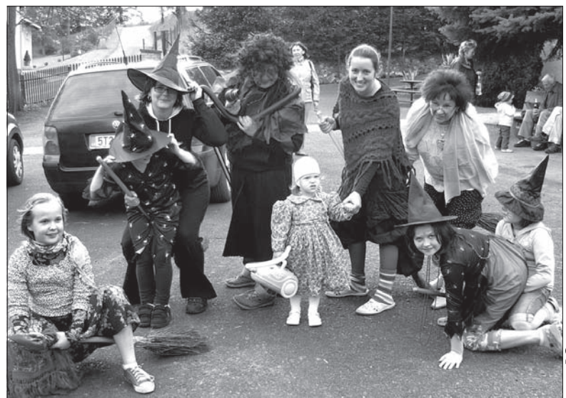
Czarownice przyleciały do Lesznej Dolnej.