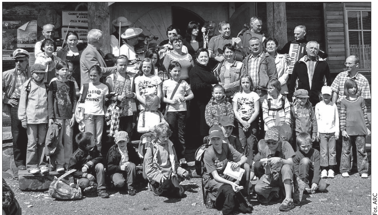
Pamiątkowe zdjęcie przed ośrodkiem kultury w Międzyrzeczu Górnym.