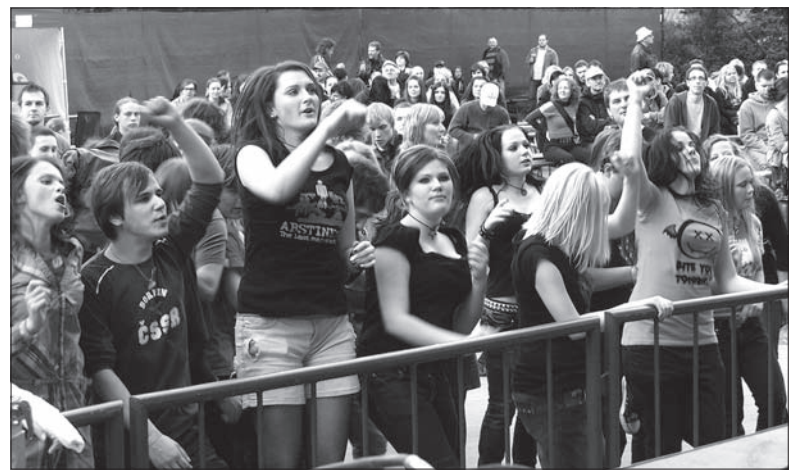
Młodzież bawiła się świetnie.