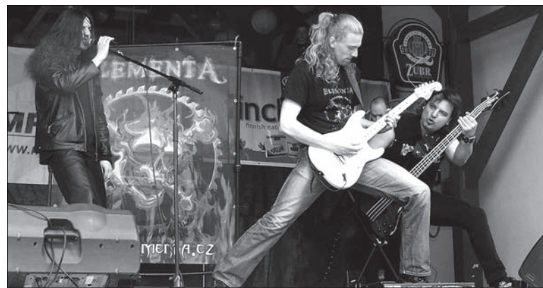
Zaolziańska kapela Elementa.

Kiedy postanawiam spojrzeć na tłum z tarasu nad sceną, spotykam Marka Piekarczyka. Wokalista TSA wita się z mną i innymi zaolziańskimi dziennikarzami serdecznie. – A