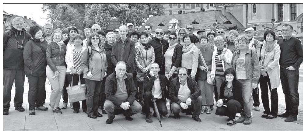
W takim urokliwym miejscu, jakim jest Pszczyna, trudno nie zrobić sobie pamiątkowego zdjęcia.

W miarę jak szczerze liczą osoby, którym