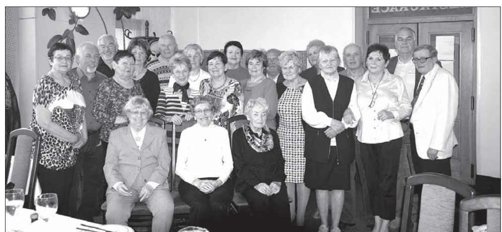
Spotkanie towarzyskie odbyło się w czeskokieszyńskim Piasecu.

Obaj panowie byli bardzo mili, powiem za wszystkich – dziękujemy. Nawet nie wiem,