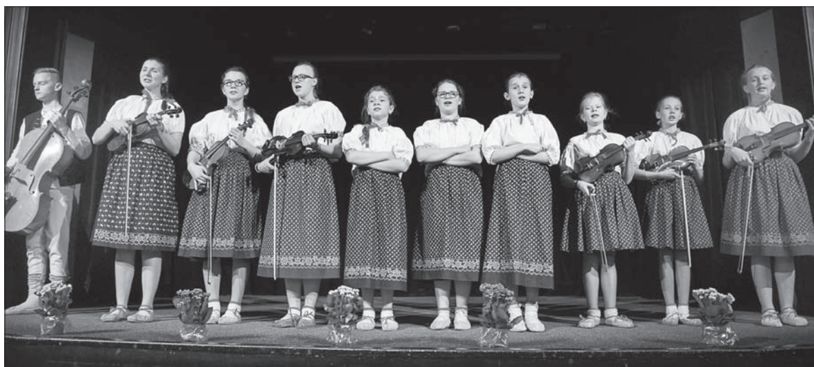
Na scenie „Rozmarynek”.

Tegoroczny Przegląd Cieszyńskiej Pieśni Ludowej z 54 punktami programu był imprezą przyjemną dla oka i ucha. Dla oka – bo na scenie można było podziwiać stroje damskie i męskie, cieszyńskie, gorolskie oraz dołańskie, a dla ucha – bo poziom wykonania poszczególnych piosenek nie pozostawiał do życzenia. – Poziom rzeczywiście co roku wzrasta. Widać w tym wielką pracę pedagogiczną, wkład nauczycieli, dzięki którym dzieci są dobrze przygotowa-