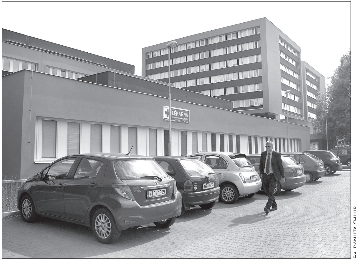
Szpital w Orłowej jest jedną z placówek, gdzie można już załatwiać elektroniczny dostęp do swojej dokumentacji.

Platforma elektroniczna ma przede wszystkim usprawnić komunikację pomiędzy poszczególnymi wojewódzkimi placówkami służby zdrowia. Umożliwia elektroniczne przekazywanie informacji o przewozie pacjenta, o wolnych łóżkach w szpitalach, szybką wymianę informacji pomiędzy szpitalami oraz gabinetami lekarzy pierwszego kontaktu i specjalistami. – W tej chwili członkami platformy są placówki wojewódzkie, lecz będziemy zachęcać do współpracy także inne podmioty – poinformowała rzeczniczka Urzędu Wojewódzkiego, Petra Špornová. Być może jednym z nich będzie sieć szpitali Agel, której częścią są m.in. Szpital Podlesie w Trzyniecu i Szpital Czeski Cieszyn. – Jeżeli otrzymamy taką propozycję, jesteśmy gotowi rozmawiać o technicznych i innych warunkach połączenia naszych systemów – powiedziała „Głosowi Ludu” Radka Miloševská, rzeczniczka grupy Agel. W skład portalu wchodzi aplikacja dla pacjentów, którzy mogą dzięki niej uzyskać dostęp do dokumentacji zdrowotnej swojej i swoich dzieci w szpitalach wojewódzkich w Karwinie, Hawierzowie, Trzyniecu-Sośnie, Frydku-Mistku, Opawie i Karniowie. – Portal jest bardzo dobrze zabezpieczony, umożliwi dostęp do informacji tylko osobom,