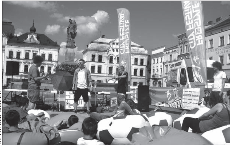
Pokaz tańca dancehall w ramach Florian Party na cieszyńskim Rynku.