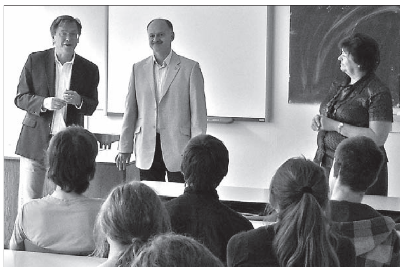
Wiceprzewodniczący Parlamentu Europejskiego, Libor Rouček, z senatorem Petrem Gawlasem w Gimnazjum Polskim w Czeskim Cieszynie

Do Gimnazjum Polskiego w Czeskim Cieszynie zawitał we wtorek eurodeputowany, a zarazem wiceprzewodniczący Parlamentu Europejskiego, Libor Rouček (Czeska Partia Socjaldemokratyczna). W spotkaniu z gimnazjalistami towarzyszył mu senator Petr Gawlas z naszego regionu. Obaj goście skomentowali przede wszystkim konkurs na temat Unii Europejskiej, w którym uczestniczyli uczniowie Gimnazjum Polskiego oraz dwóch czeskich szkół średnich z Trzyńca, a nad którym patronat objął właśnie wiceprzewodniczący PE. Rouček rozmawiał z polskimi gimnazjalistami także po... polsku. Opowiedział im, że jeszcze w czasach komuny,