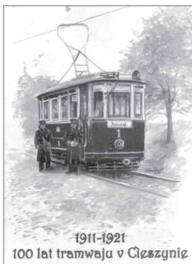
Jedna z pamiątkowych kartek.