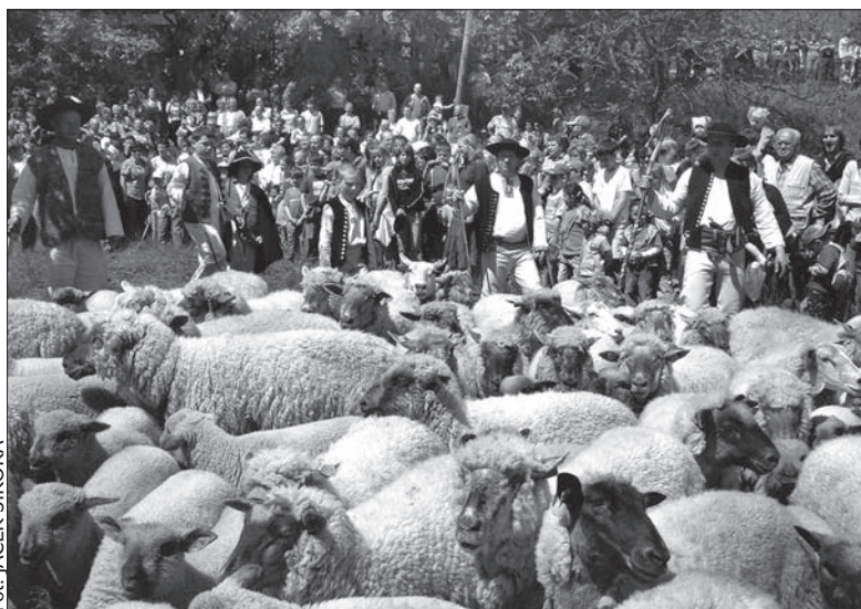
W Koszarzyskach „mieszają łowce”.

Impreza rozpocznie się o godz. 10.00, sam obrzęd „mieszanie łowiec” będzie można obejrzeć już godzinę później. (kor)