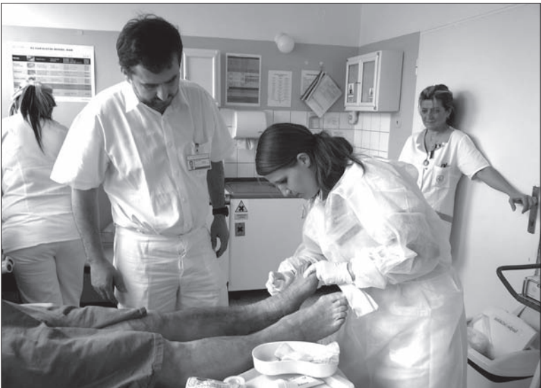
Praktyczny egzamin maturalny w hawierzowskim szpitalu

Egzamin maturalny w szpitalu składa się z części praktycznej i ustnej obrony. Uczniowie wykonują wszystkie czynności związane z pielęgnacją chorych – oczywiście pod nadzorem specjalistów. Pobierają krew, podają chorym lekarstwa, przygotowują kroplówki i transfuzje, asystują podczas zmiany opatrunków, troszczą się o higienę chorych. Rzeczniczka podkreśla, że przebieg matur ułatwiają sami pacjenci, którzy zachowują się cierpliwie i przyjaźnie, przez co pomagają rozładować nerwową atmosferę egzaminów. (dc)