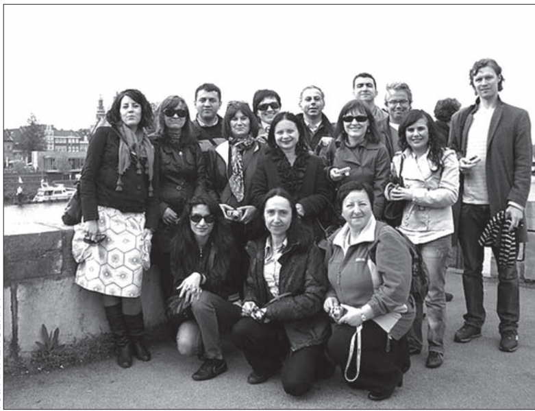
Uczestnicy kursu na moście w Maastricht.

Zaolziańska uczestniczka postanowiła wspólnie z Talenacademie za dwa lata zorganizować podobne spotkanie na Zaolziu, na polsko-czeskim pograniczu. (kor)