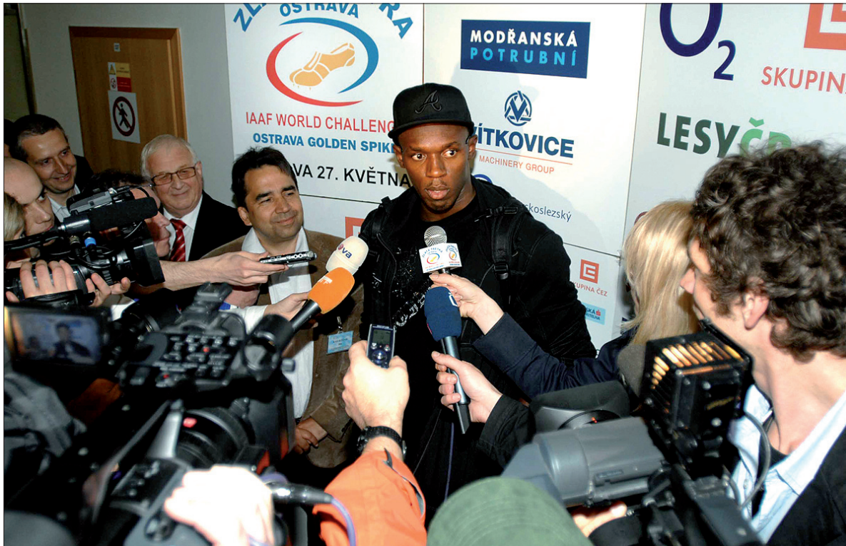
Usain Bolt w otoczeniu dziennikarzy po przylocie do Ostrawy.

Nie tylko sprinterzy są gwarancją dobrej zabawy. Na stadionie w Ostrawie Witkowicach pojawią się m.in. Chorwatka Blanka Vlašić (skok wzwyż), Amerykanin Bernard