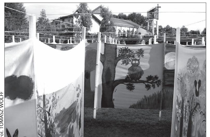
Fot. TOMASZ WOLFF

W Górkach Wielkich wystąpi także gwiazda. 3 lipca na terenie dawnej posiadłości Zofii Kossak zagra Stanisław Soyka. Imprezy potrwać do 28 sierpnia. (wot)