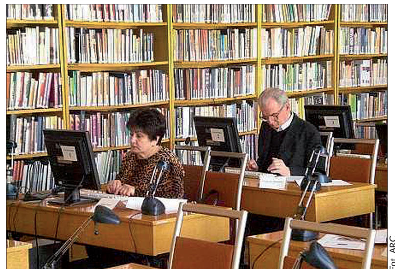
Biblioteka w Cieszynie zaprasza także Zaolziaków.

Imprezy potrwają do 4 czerwca. Szczegółowy program na stronie www.biblioteka.cieszyn.pl (wot)