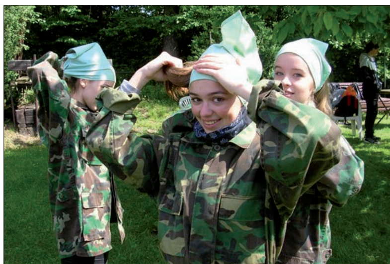
Do gry w paintball trzeba się odpowiednio ubrać.

którymi się strzela i które trafiając w przeciwnika, pozostawiają po sobie ślad w postaci kolorowej plamy, do zdobycia twierdzy i wyeliminowania