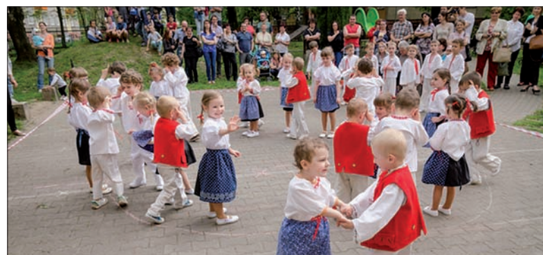
Przedszkolaki z Trzyńca.