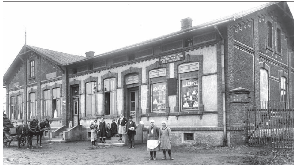
Dom Robotniczy w Olbrachcicach w okresie międzywojennym.

Domy Robotnicze na Śląsku Cieszyńskim były nierozdzielnie związane z rodzącym się ruchem robotniczym, z wszelkimi przemianami społecznymi w związku z uprzemysłowieniem tego skrawka ziemi oraz budzącego się do życia ruchu organizacyjnego ludności miejscowej.