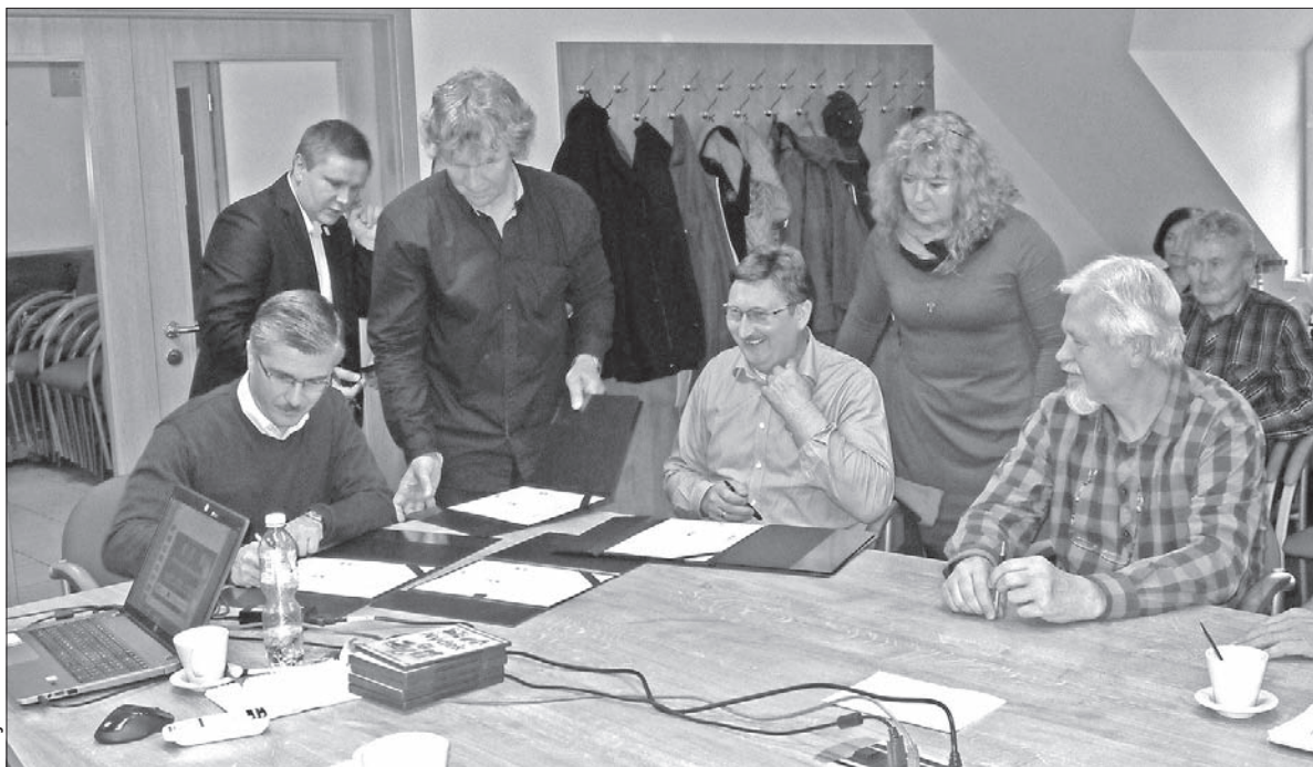
Deklarację o współpracy podpisali wczoraj wójtowie i burmistrzowie sześciu gmin czesko-polskiego pogranicza.

Czwartkowa konferencja była okazją do podsumowania dotychczasowej transgranicznej współpracy i przedstawienia projektów, które realizowały poszczególne gminy mikroregionu z polskimi partnerami. – Takich projektów było sporo. Dlaczego jednak nie połączyć sił i nie przygotować projektu poważniejszego, szerszego, z udziałem aż sześciu gmin? Razem będzie nam przecież łatwiej i różnie realizować