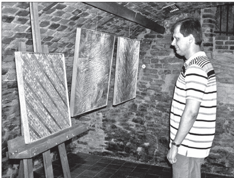
Fragment wystawy w renesansowych podziemiach frysztackiego ratusza.

We frysztańskiej Galerii pod Wieżą zainteresować może ostatnia wystawa twórczości Svatoslava Böhma z Krnowa. Autor znany jest przede wszystkim ze swoich opracowań graficznych książek, plakatów i innych projektów grafiki użytkowej. W renesansowych podziemiach frysztackiego ratusza pokazuje jednak swoje obrazy-płaskorzeźby z drewna, na których dominują najprostsze kształty geometryczne i linie wytworzone przy pomocy piły łańcuchowej, dłuta i barw.