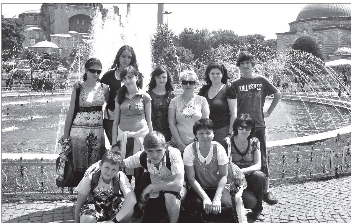
Jabłonkowanie przed kościołem Hagia Sofia.