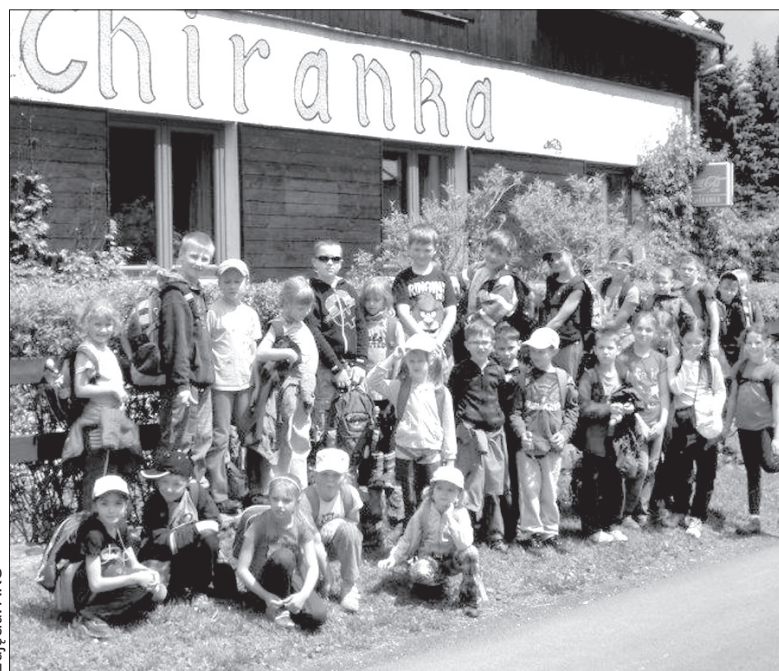
Błędowanie na zielonej szkole.

ręczną produkcję papieru w Wielkich Losinach. Mnie najbardziej podobało się w jaskini. Prawdę mówiąc, zwiedziliśmy bardzo dużo miejsc, ale ja nie wszystkie miejscowości zapamiętałem. Po powrocie z tych wycieczek spędziliśmy czas grając w ping-