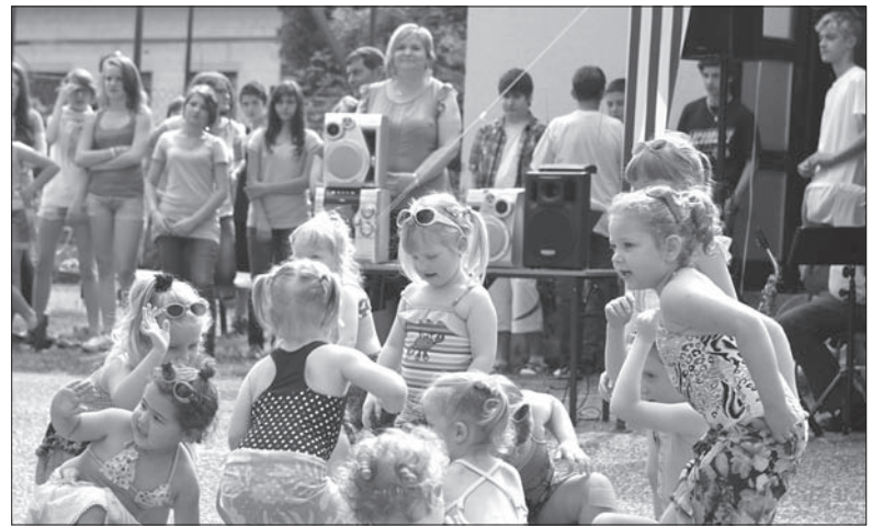
Zabawa była przednia.

Byłem jednym z tych, którzy uczestniczyli w powstaniu Zrzeszenia Muzyczno-Śpiewaczego i całą kadencję reprezentowałem je jako członek komisji rewizyjnej Unii českých pěveckých zboru. Potem zrezygnowałem z uczestnictwa w tych, niezbyt dla mnie zrozumiałych, grach ambicyjnych, a teraz trzeźwo patrząc na to wszystko, nie dziwię się, że postanowiono zlikwidować tę organizację, bo stoi na glinianych nogach. Wynika to bowiem z zasad termodynamiki, które wskazują, że wszystko zmierza do entropii, czyli