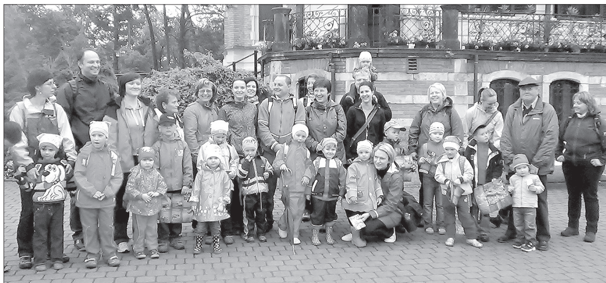
Przedszkolaki z Suchej Górnjej.