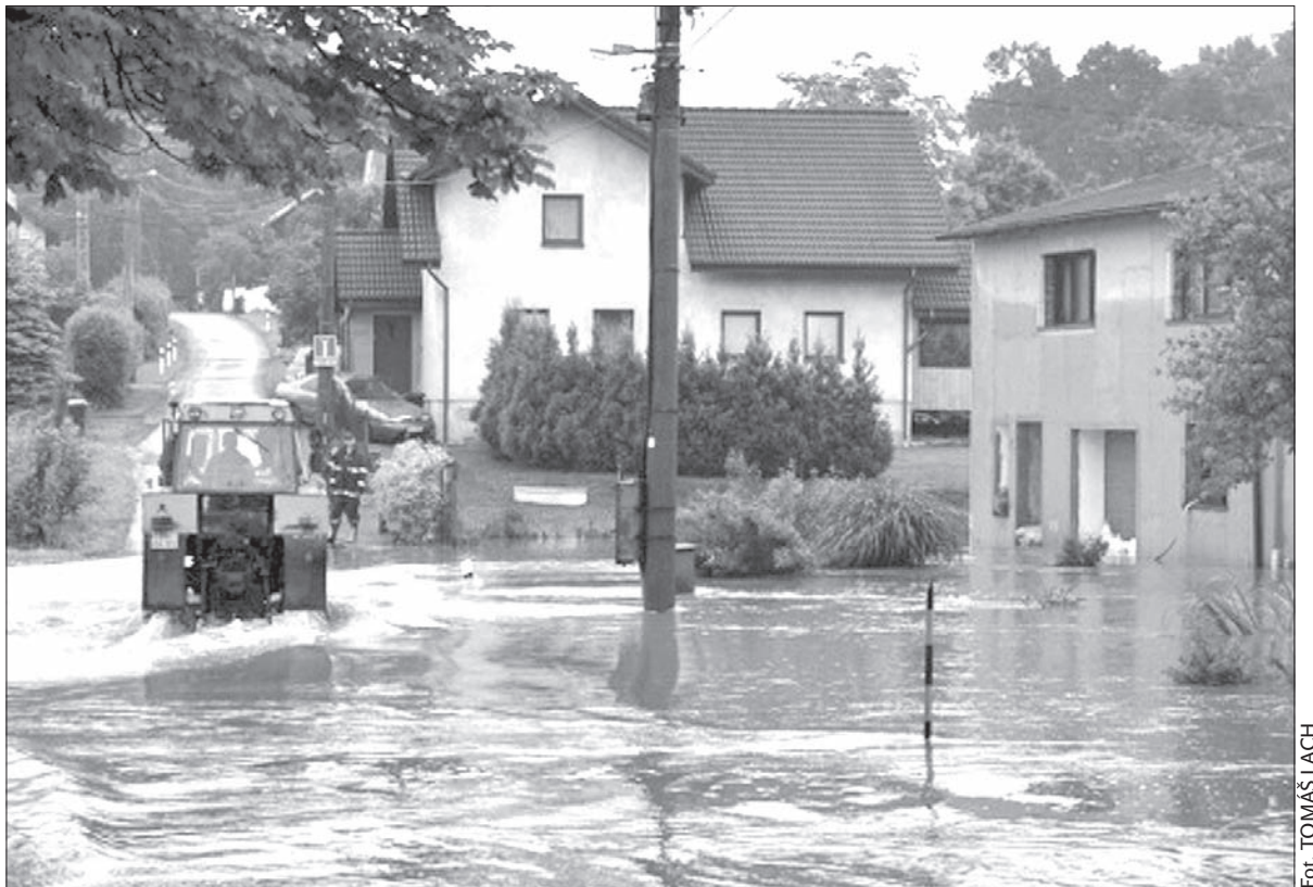
Powódź w Piotrowicach.

W Piotrowicach zdał egzamin wybudowany dwa lata temu betonowy wał, chroniący przed wzburzoną rzekę zabudowania w pobliżu centrum gminy. W Zawadzie również ma być