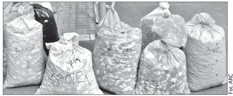
Dla dzieci ze szkoły specjalnej w Trzyńcu udało się zebrać aż 53 worki z nakrętkami.