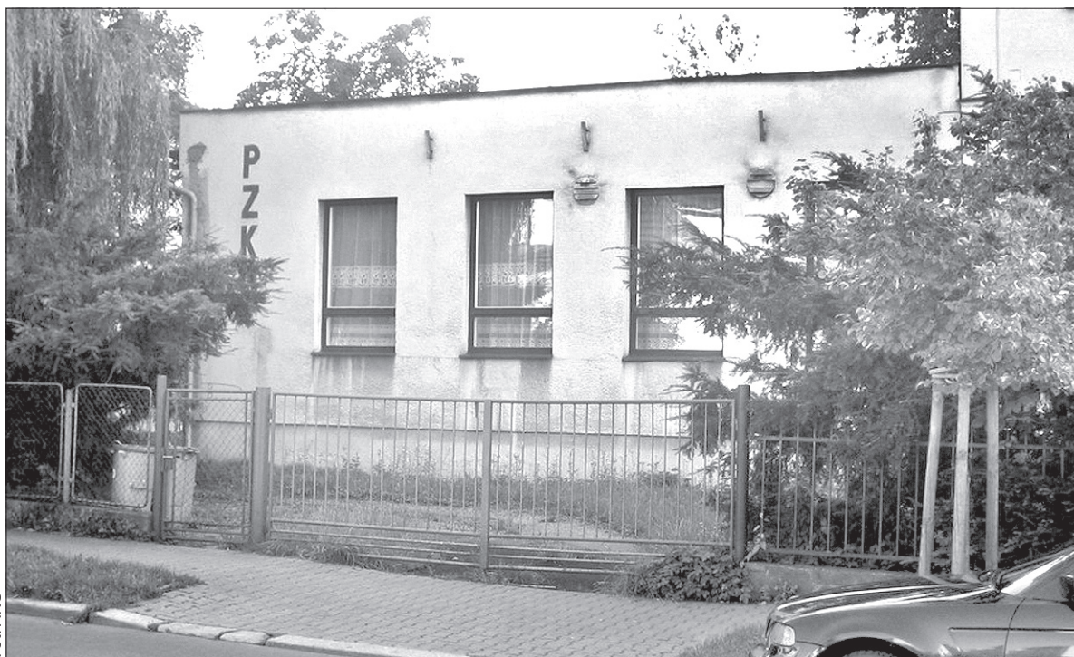
Budynek MK PZKO w Boguminie.