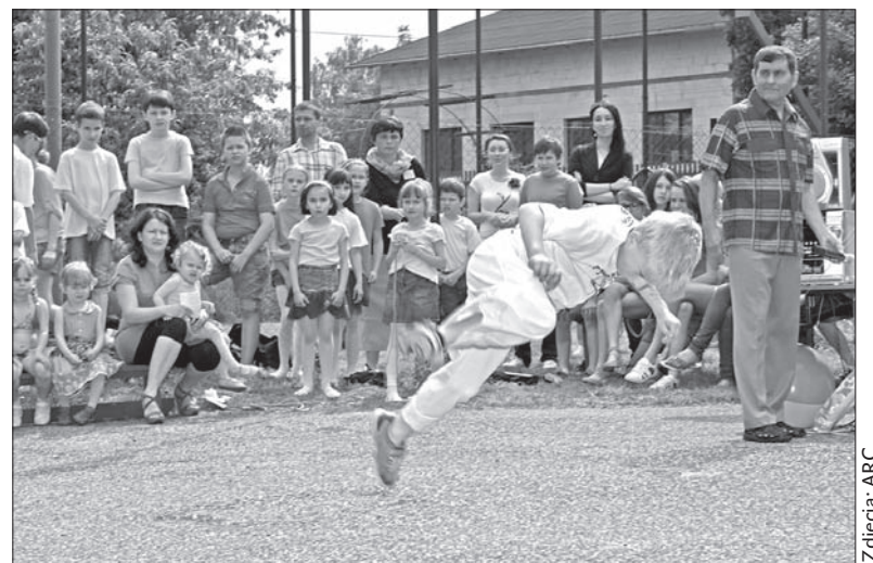
Nie zabrakło takich popisów wśród najmłodszych.