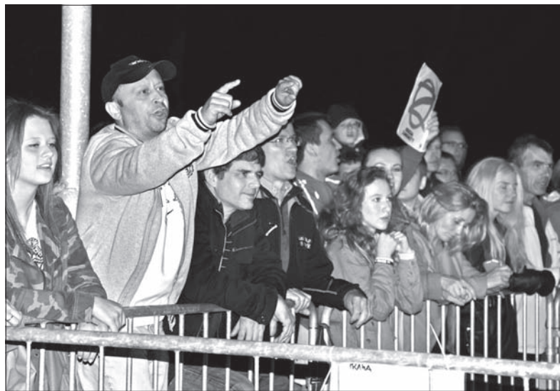
Fani polskiego rocka.