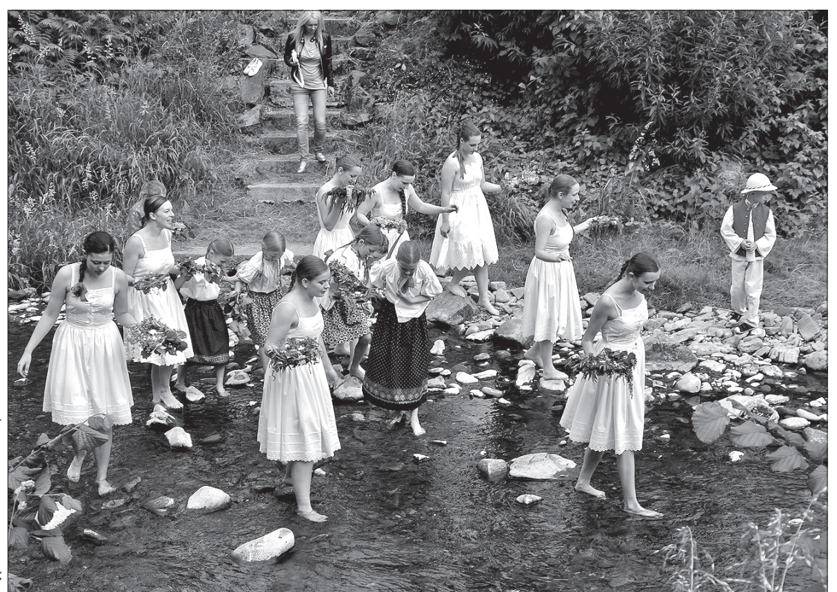
Bystrzyckie dziewczyny nad Głuchówką.

strzyca” i „Łączka” oraz gościnne – „Nowina” i „Zaolzi”. Punktem kulminacyjnym był pochod nad Głuchówką i puszczanie wianków. (dc)