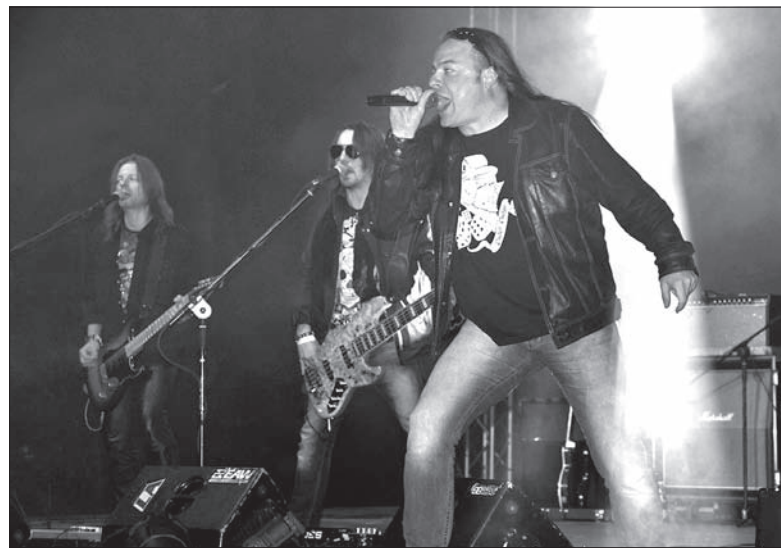
Oddział Zamknięty – główny gość festiwalu.