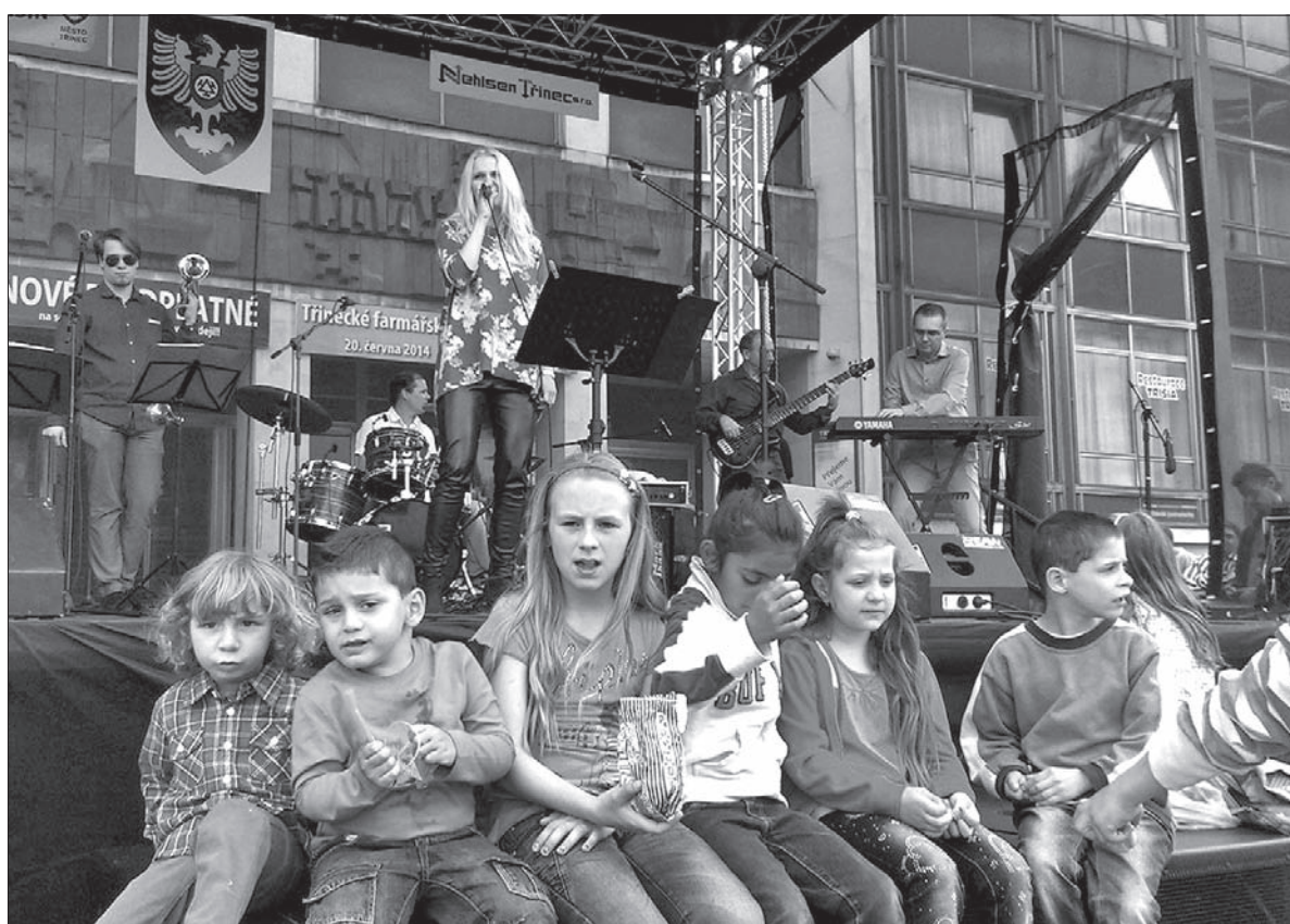
Na Przeglądzie Mniejszości Narodowych w Trzyńcu sporo było dzieci. Na podium zespół gościnny z Bielska-Białej.

W Trzyńcu mniejszości narodowe przygotowały program na niedzielne popołudnie. Przegląd Mniejszości Narodowych odbył się na placu przed Domem Kultury „Trisia”. Publiczności zebrało się sporo. Wśród widzów, jak co roku, sporo było Romów, którzy przyszedli na plac całymi rodzinami. Na sce-