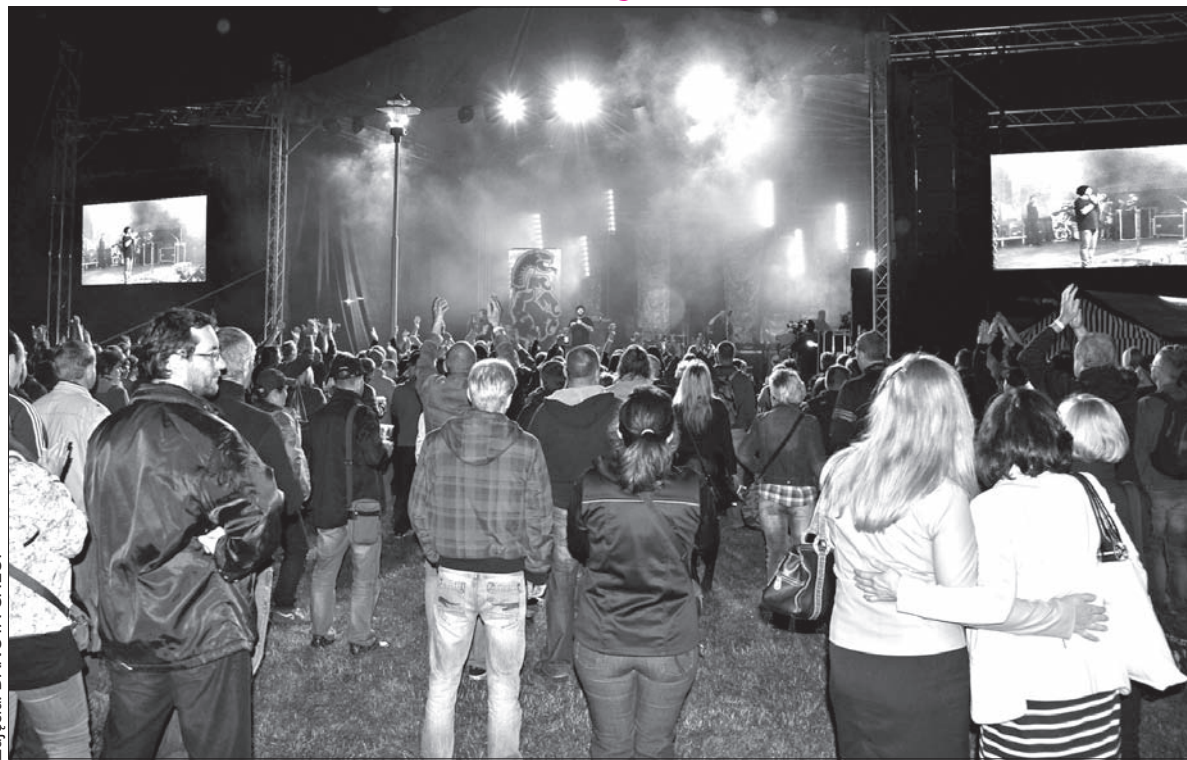
Atmosfera Gróm Rockfestu w Karwinie-Frysztacie.

Koncert Oddziału Zamkniętego rozpoczął się przed godz. 23. Nawet o tej zaawansowanej godzinie można