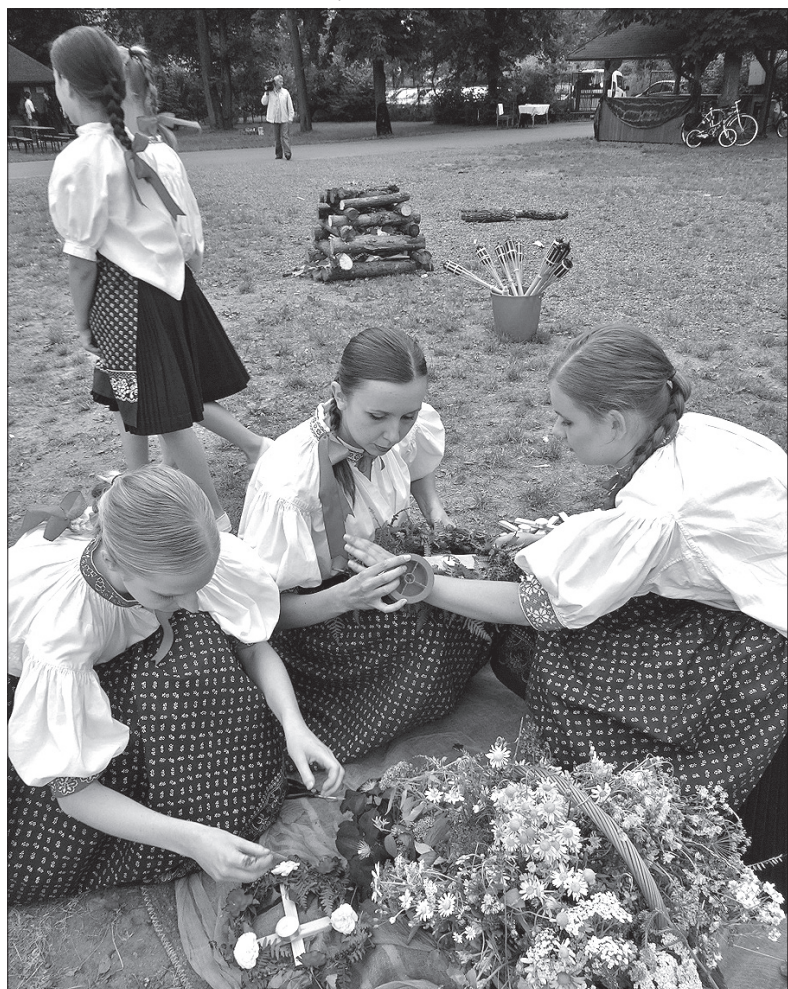
Przygotowanie wianków do obrzędu.

Tradycje świętojańskie pielęgnyje od lat Miejsce Koło Polskiego Związku Kulturalno-Oświatowego w Bystrzycy. W sobotę w Parku