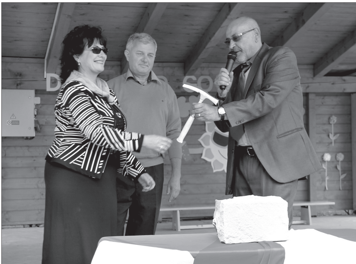
Symboliczne osadzenie kamienia węgielnego pod budowę przedszkola w Gnojniku.

Przypomnijmy trudności, które stały na drodze do rozpoczęcia bu-