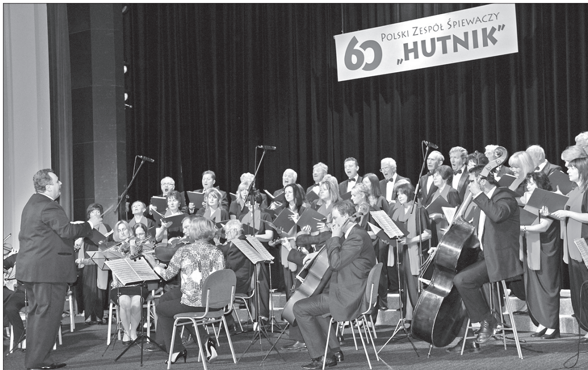
PZS „Hutnik” i Trzyńska Orkiestra Kameralna wspólnie wykonały utwór „Missa brevis” Josepha Haydna.