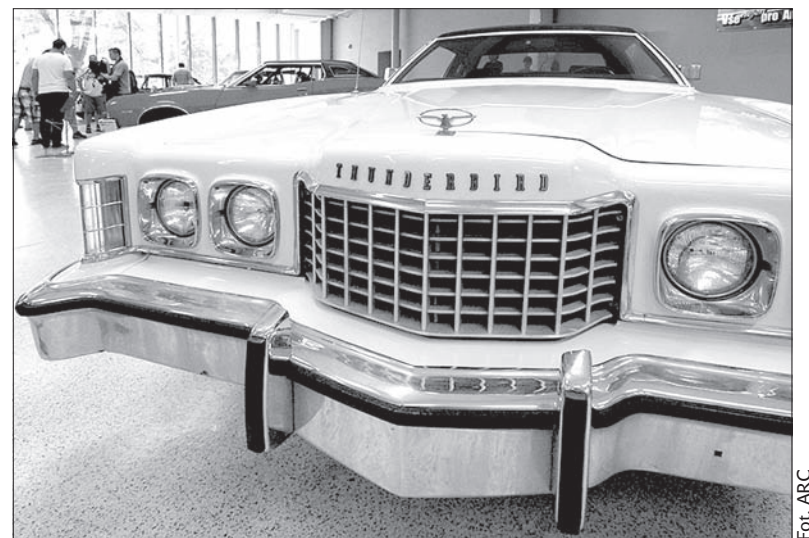
Amerykański weteran to lśniący chrom i ogromna maska.

W ramach wystawy przewidziano konkurs piękności. Uczestnicy będą mogli głosować na najpiękniejsze weterana, a także wygrać jedną z trzech atrakcyjnych nagród. Jedną z nich jest przejażdżka po mieście wybranym modelem. (sch)