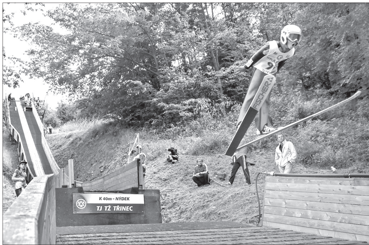
Jeden z wielu udanych skoków na dużym obiekcie w Nydku.

Piątkowy konkurs w Nydku będzie też okazją dla rodziców, którzy pragną zgłosić swoje dziecko do trzynieckiego klubu skoków narciarskich. – Fachową radą służyć będą nasi trenerzy, zapraszamy chętnych do konsultacji i zaprezentowania