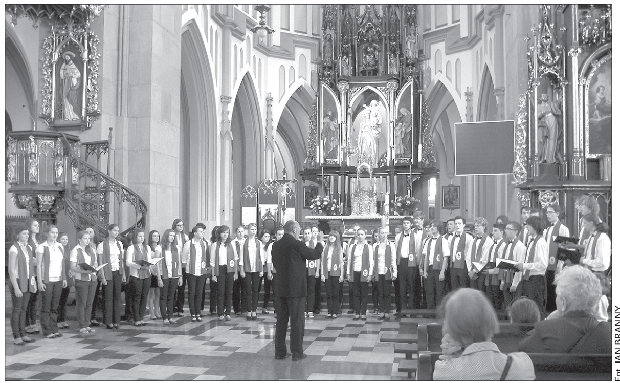
„Collegium Iuvenum” podczas koncertu na IV Krakowskim Festiwalu Chóralnym.