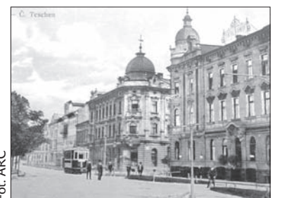
Ulica Dworcowa, dawniej.

madzonych fotografii zobaczymy dziś na spotkaniu w Klubie Muzeum. Od 2 lipca będzie można oglądać w Klubie inną wystawę fotograficzną – zdjęcia fotografików z klubu „Dzwonek” nt. „Wiosenne motywy”. (dc)