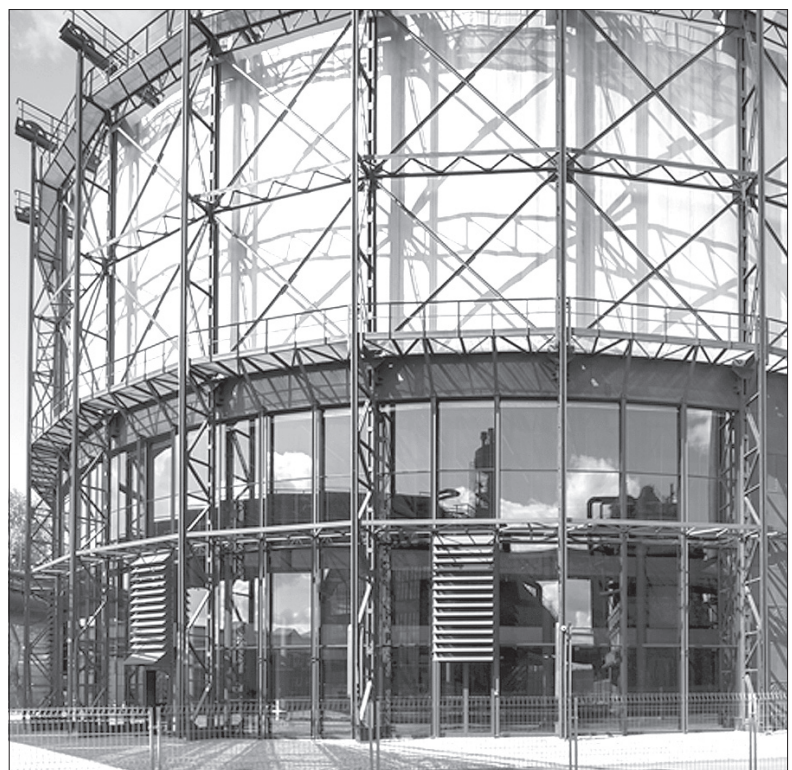
Hala „Gong” została zaprojektowana przez architekta Josefa Pleskota.

Dwie nagrody otrzymały budowle wchodzące w skład ostrawskiego kompleksu Nowa Karolina. Jury doceniło architekturę bramy łączącej historyczne centrum Ostrawy z kompleksem handlowo-rozrywkowym oraz domy wchodzące w skład Rezydencji Nowa Karolina.