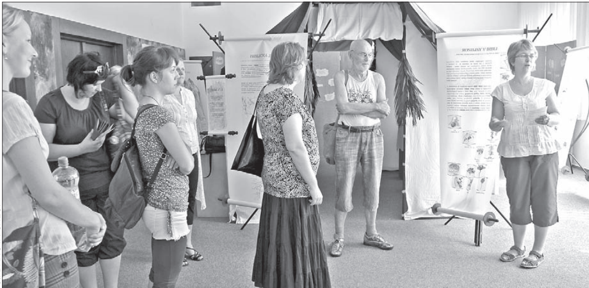
Świat Biblii na wystawie w Czeskim Cieszynie.

– Nie będzie w tym roku występu gwiazdy folk-rockowej z Polski. Natomiast absolutną nowością jest to, iż po obrzędzie puszczania wianków po Głuchówce i muzykowaniu przy ogniskach, wyruszymy wszyscy na poszukiwanie... kwiatu paproci. Miejmy nadzieję, że temu, kto go znajdzie, ten cenny kwiat przyniesie sporo szczęścia – dodaje wicewójt. (kor)