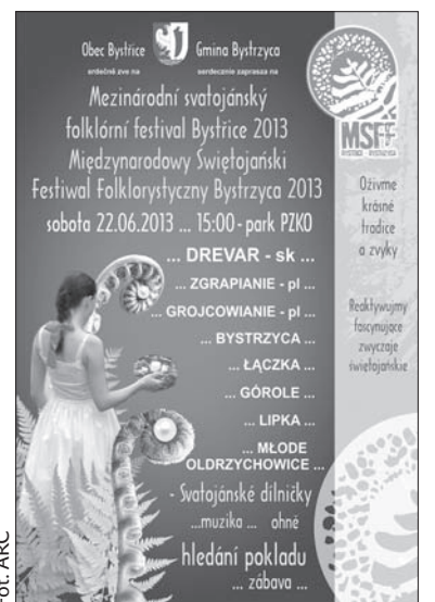
Plakat zapowiadający imprezę.