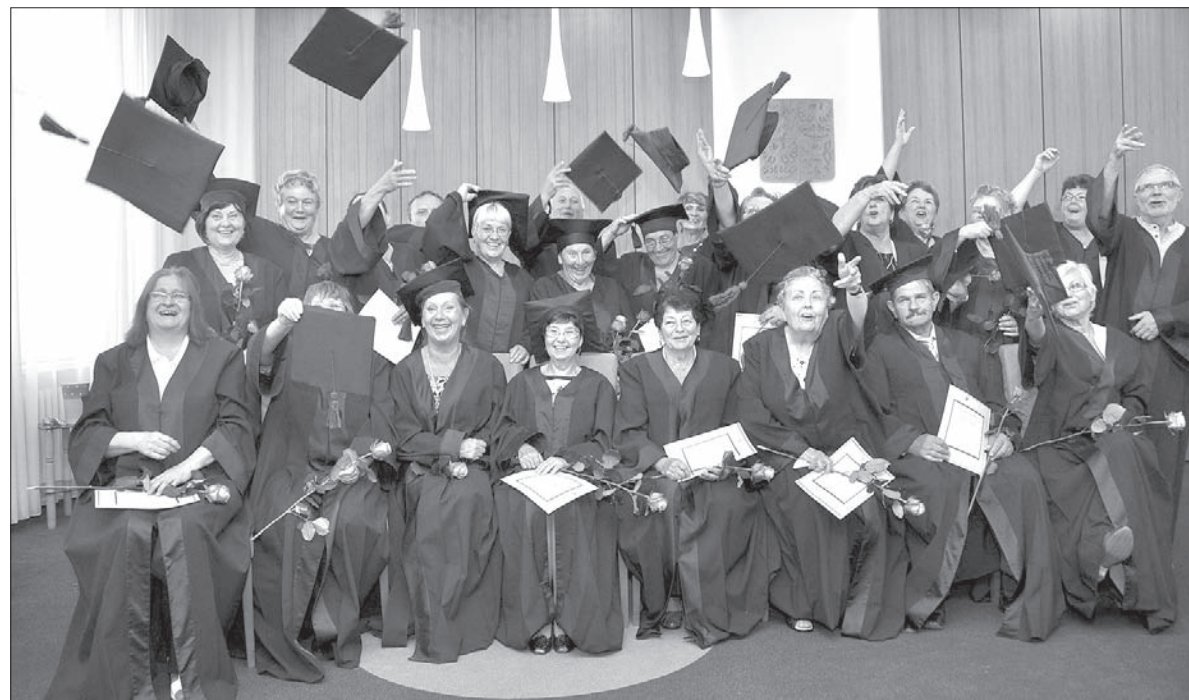
Seniorzy z Bogumina i Rychwałdu z certyfikatami ukończenia studiów.