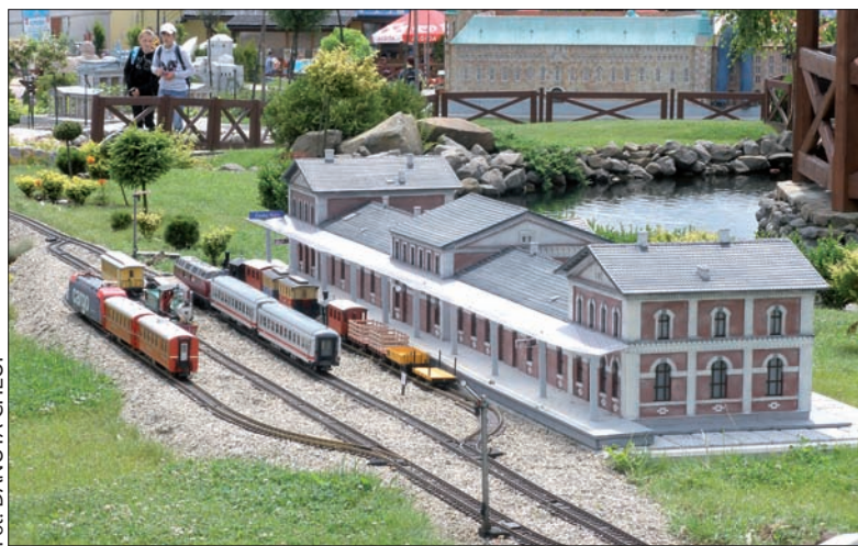
Model dworca kolejowego w Czeskim Cieszynie w Parku Miniatur w Inwałdzie.

Miniatur, coś zaskoczy czy zdziwi podczas wakacyjnych wojaży. Nie zapomnijcie o tym do nas napisać lub przysłać zdjęcia z komentarzem. Bardzo chętnie je w naszej rubryce opublikujemy. Na autora najciekawszego listu z wakacji i najbardziej udanego zdjęcia będą we wrześniu czekały nagrody. (dc)