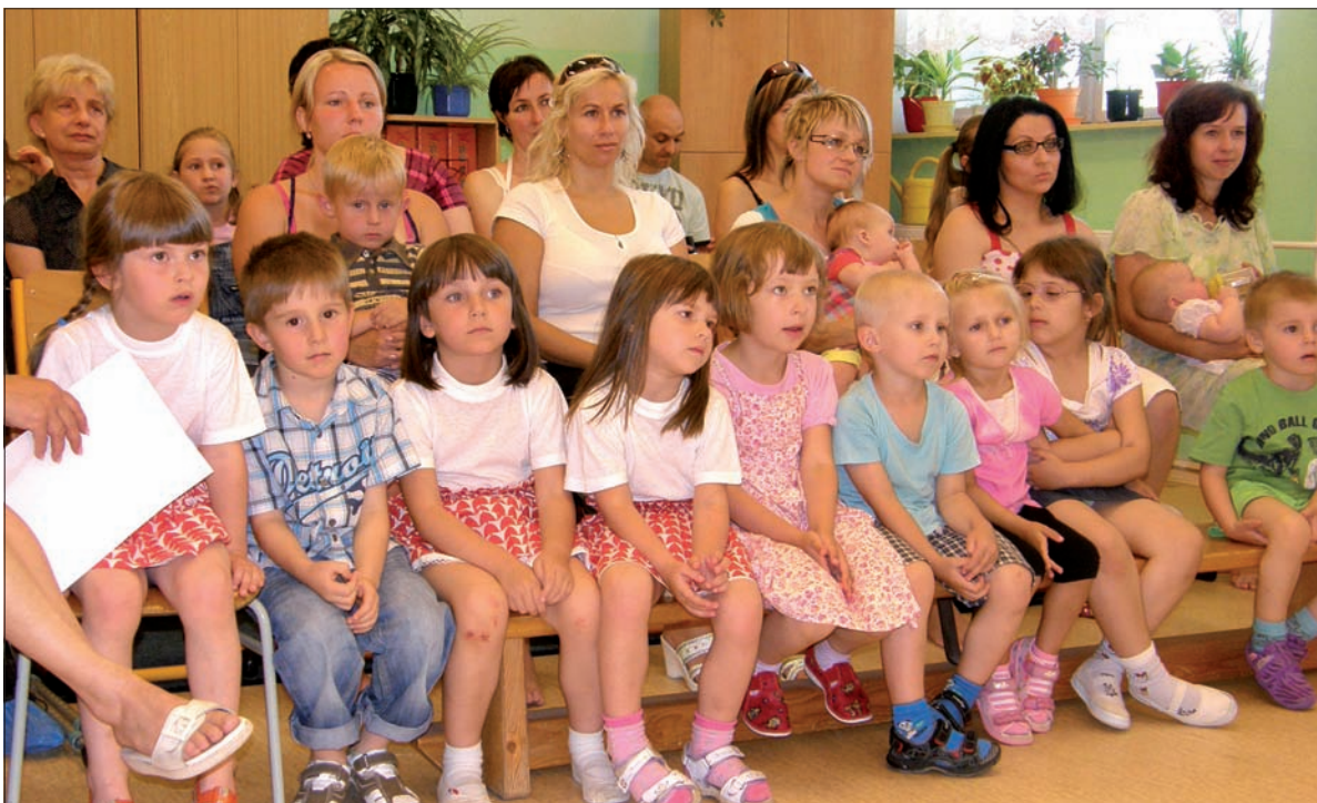
Polska szkoła i przedszkole w Orłowej-Lutyni tworzą jedną wielką rodzinę. Zakończenie roku szkolnego świętują zawsze razem.