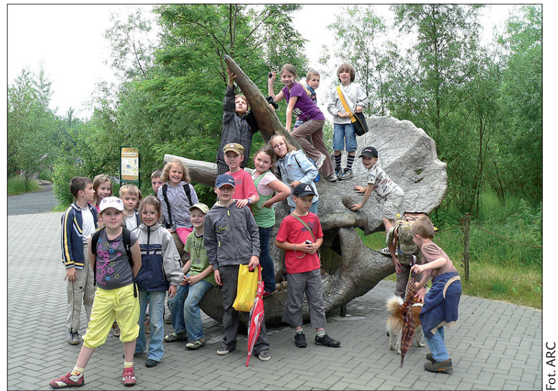
Dzieci opanowały prehistorycznego potwora.