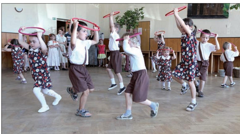
Występują dzieci z polskiego przedszkola w Olbrachcicach.