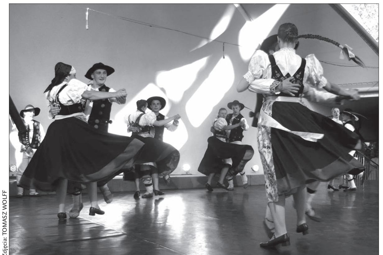
Koncert z okazji 60-lecia ZR „Wisła” otworzył tegoroczny Tydzień Kultury Beskidzkiej.