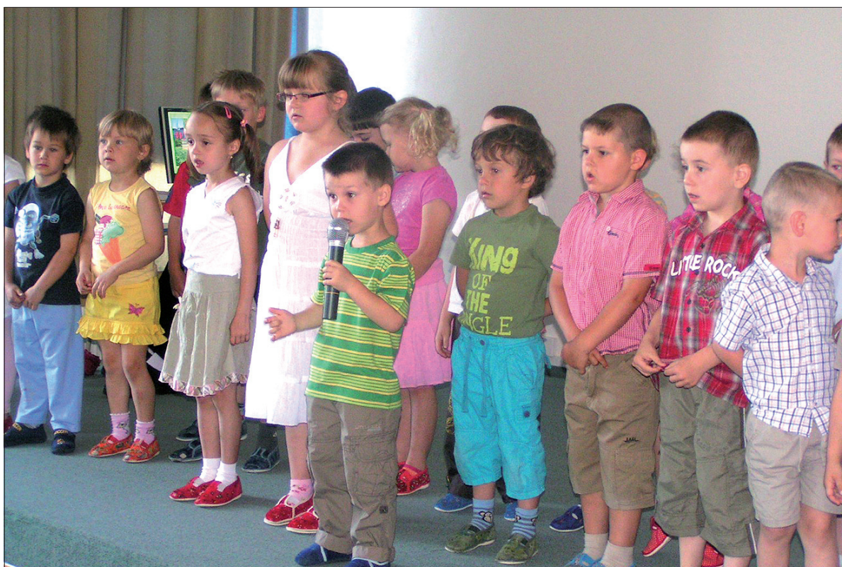
Górnosuskie przedszkolaki żegnają rok szkolny oraz grupę starszaków, którzy po wakacjach rozpoczną naukę w pierwszej klasie.