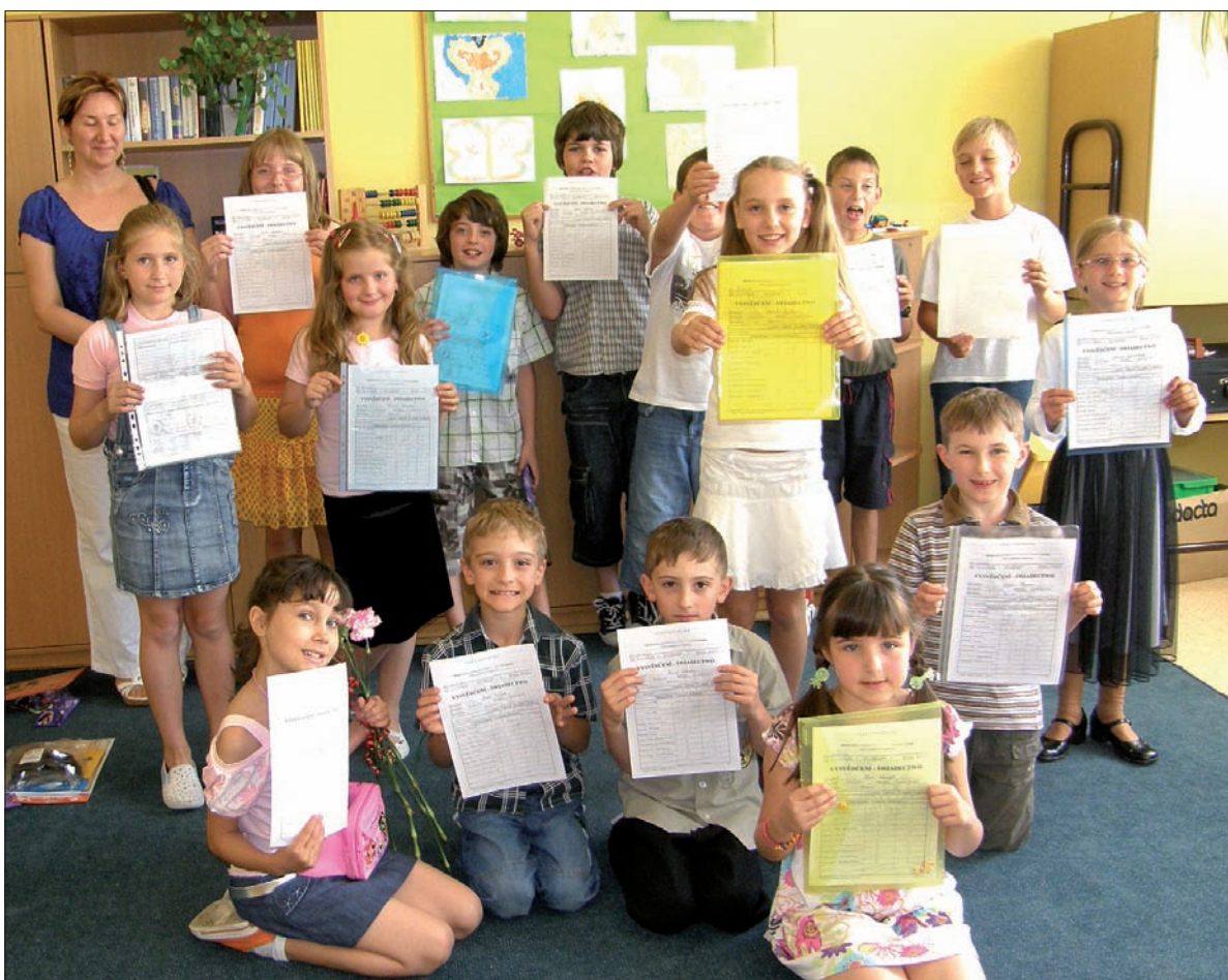
Radość z rozdanych świadectw. Na piętnastkę uczniów polskiej szkoły w Orłowej-Lutyni czeka wakacyjna przygoda.