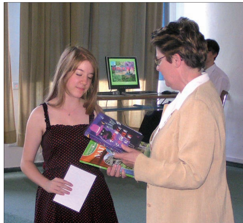
Zakończenie roku szkolnego w PSP Sucha Górna jest okazją do przyznania nagród dla najaktywniejszych uczniów.