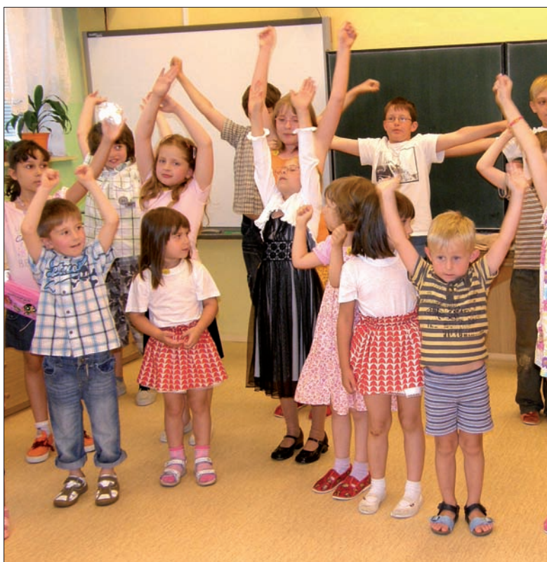
Wspólna przedwakacyjna piosenka w wykonaniu przedszkolaków i uczniów PSP w Orłowej-Lutyni.