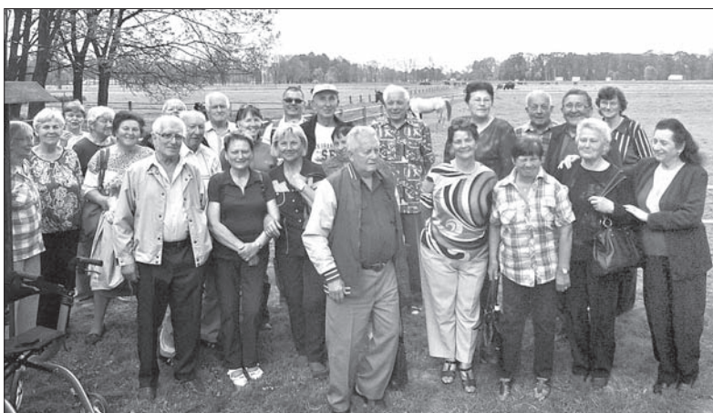
Z wizytą w stadninie koni w Ochabach.