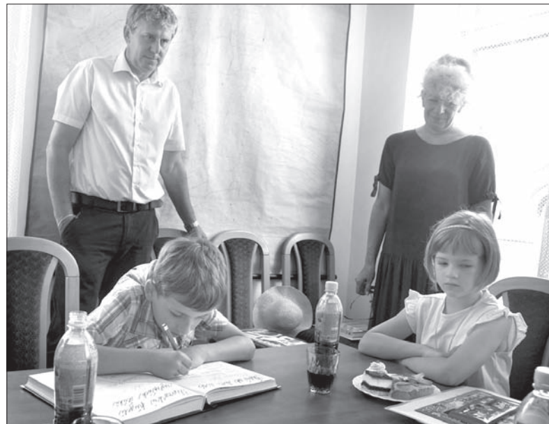
Wyróżnieni uczniowie wpisali się do kroniki gminnej.

Wyróżnieni uczniowie po wpisaniu się do kroniki gminnej otrzymali dyplomy, książki i słodycze. (sch)