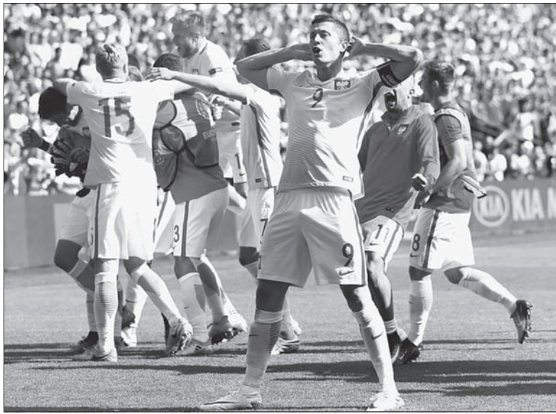
Rośnie popyt na polskich piłkarzy.

Na celowniku europejskich klubów znajdują się nie tylko polscy