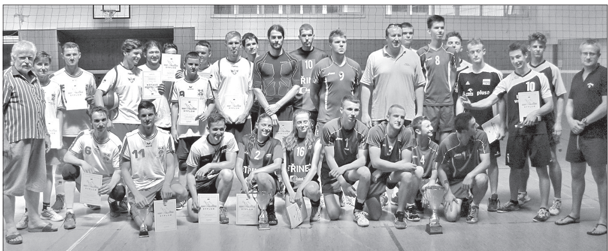
Zadowolone miny młodych siatkarzy są najlepszą reklamą turnieju.

1. Białoruś-Grodno, 2. Trzyniec-Zaolzie, 3. Litwa Bujwidze, 4. IX LO Wrocław, 5. Polskie Gimnazjum im. J. Słowackiego w Czeskim Cieszynie.