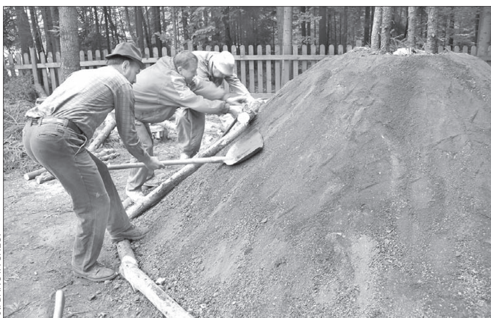
Budowa mielerza w Koszarzyskach.