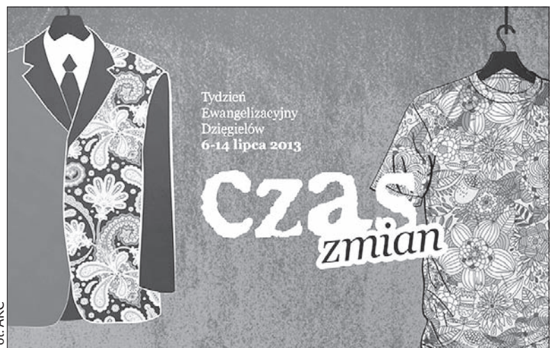
Plakat zapowiadający tegoroczny TE.

Podczas wernisażu wystawy (dziś, godz. 16.00) Krajca nie tylko prezentuje swoje zdjęcia, ale zagra ponadto na typowym australijskim instrumencie didgeridoo oraz przeczyta swoje wiersze zainspirowane piękną beskidzką przyrodą. (kor)