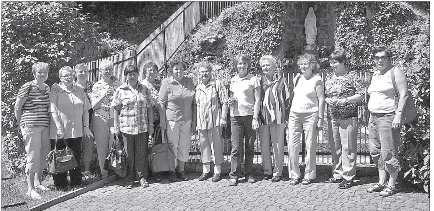
Członkinie Klubu Kobiet z Karwiny-Raju przed źródłem „z wieczną wodą” w Górnej Łomnej.

zmu wodą ze źródła i pieśń „Płyniesz Olzo”. W godzinach popołudniowych zatrzymano się w Koniakowie w celu zwiedzenia muzeum koronek i spożycia późniejszego obiadu. Po wspólnej pogawędce na tarasie restauracji