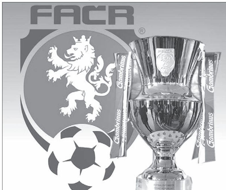
Logo Pucharu Czeskiej Poczty.

Lipiec stoi pod znakiem fazy wstępnej Pucharu Czeskiej Poczty. W eliminacjach do głównej rundy wystartują też dwa kluby z naszego regionu – dywizyjne zespoły Hawierzowa i Piotrowic. Hawierzowianie zmierzą się 14 lipca na wyjeździe z beniaminkiem 4. ligi – Beneszowem Dolnym, zaś Lokomotywa Piotrowice w tym samym dniu z Wrzesiną (także na wyjeździe).