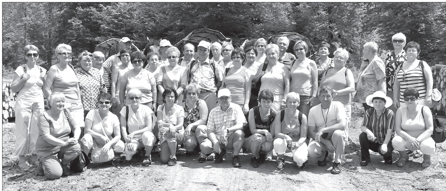
Podczas wycieczki do źródeł Olzy nie mogło zabraknąć wspólnej fotografii.