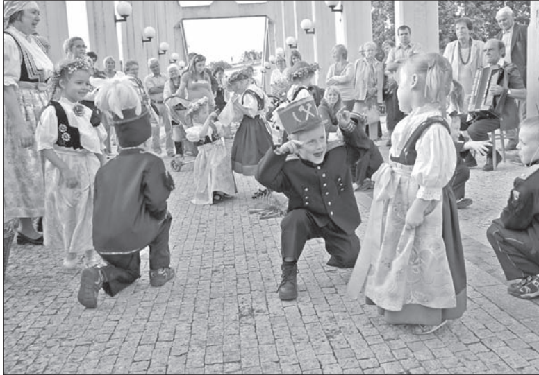
Przedszkolaki z Karwiny-Frysztatu tańczyły na Darkowskim Moście.