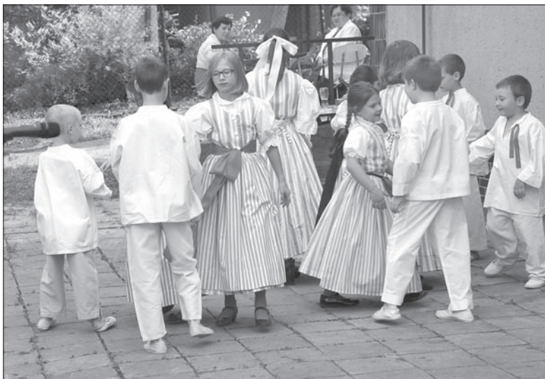
Występ „Skotniczki” rozpoczął orłowsko-lutyńskie „Wianki”.