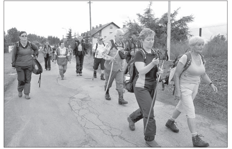
Piesi turyści z PTTS „BS” w RC do źródeł Olzy wędrowali z Koczego Zamku.