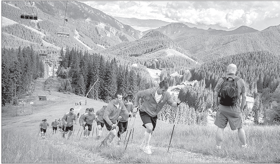
Peleton trzyńskich hokeistów w Niskich Tatrach.