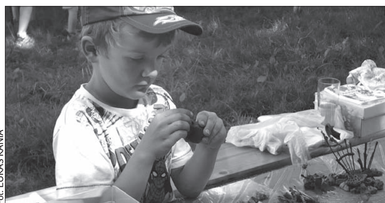
Dziecięcia wyobraźnia nie zna granic.

Wszystkie dzieci mogą np. wziąć udział w konkursie fotograficznym. Aparat można wypożyczyć na miejscu, na małych autorów najciekawszych zdjęć czekają atrakcyjne nagrody. (jb)