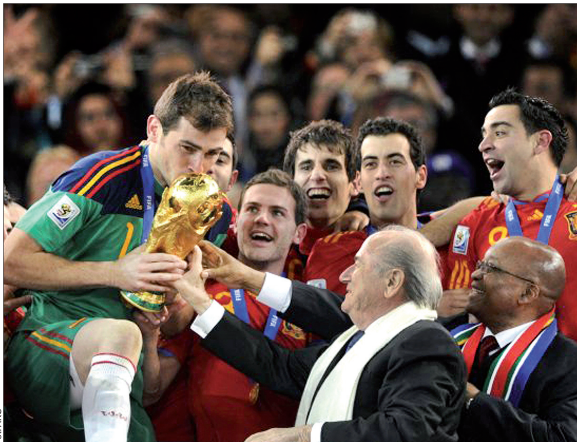
Hiszpanie z pucharem dla mistrza świata.

Nie tylko słynna ośmiornica Paul wyróżyła Hiszpanom złoty medal, pierwszy jakiegokolwiek krążek reprezentacji tego kraju w historii piłkarskich mistrzostw świata. Już przed rozpoczęciem mundialu Hiszpanie byli faworytem numer jeden dla Zbigniewa Bońka. – U Hiszpanów wszystko gra. Od bramkarza do napastnika. Grają na pamięć, mądrze i skutecznie. Potrafią długo utrzymywać się przy piłce tak, jak nikt inny. Mają dwa centra dowodzenia – Iniestę i Xavięgo. Tak to już w życiu bywa: dla jednych wszystko, dla drugich nic – skomentował grę mistrzów świata jeden z najlepszych polskich piłkarzy w historii, były gwiazdor Juventusu Turyn i AS Roma. Legenda polskiej piłki na swoim internetowym blogu trafiła też w innego medalistę, Holandię. Pod wrażeniem gry Hiszpanów byli zresztą wszyscy Polacy, zwłaszcza po druzgocącej porażce z kadrą Vi-