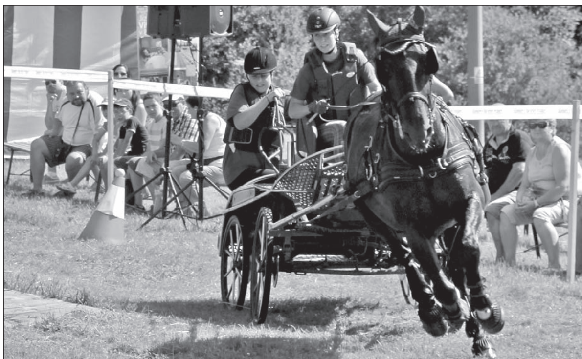
Zaprzęgami powożyły dwuosobowe załogi.