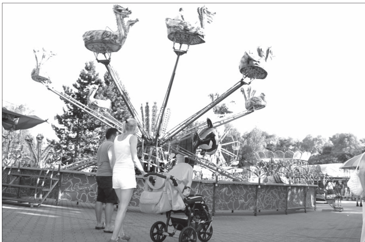
Stonawskiemu odpustowi ku czci św. Marii Magdaleny jak zwykle towarzyszyło wiele atrakcji dla dzieci.

W sobotę odbył się również XVI Gminny Turniej Piłki Nożnej o Puchar Wójta Stonawy oraz coroczny konkurs w koszeniu kosą wysokiej trawy. W czasie obu odpustowych dni na stonawian i przyjezdnych czekało wiele odpustowych atrakcji i straganów. Na pobliskiej łące rozlokowały się karuzele, nie zabrakło stoisk ze smakołykami, zabawkami, rękodziełami i innymi produktami odpustowymi. W Parku PZKO na dzieci czekały zabawy i konkursy. W programie były koncerty i wystę-