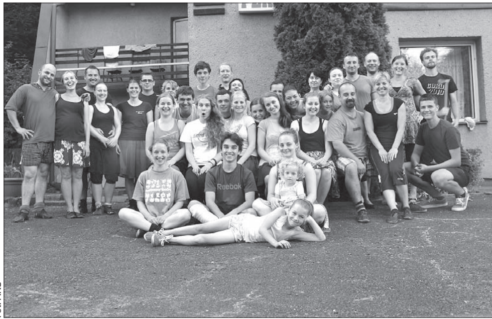
W czasie lipcowego zgrupowania „Bystrzyca” na próbach spotykali się wszyscy tancerze.