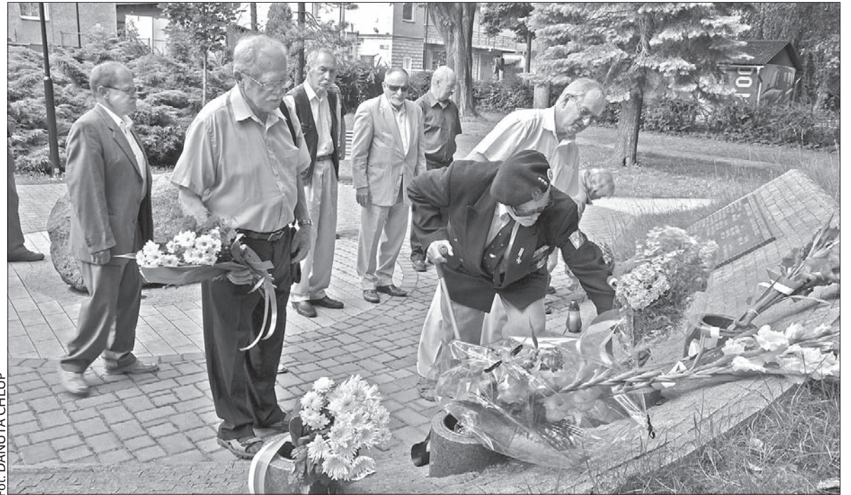
Uczestnicy aktu wspomnieniowego składają kwiaty przy pomniku ofiar II wojny światowej.

Po złożeniu kwiatów i zapaleniu zniczy obecni odśpiewali „Rotę”. (dc)