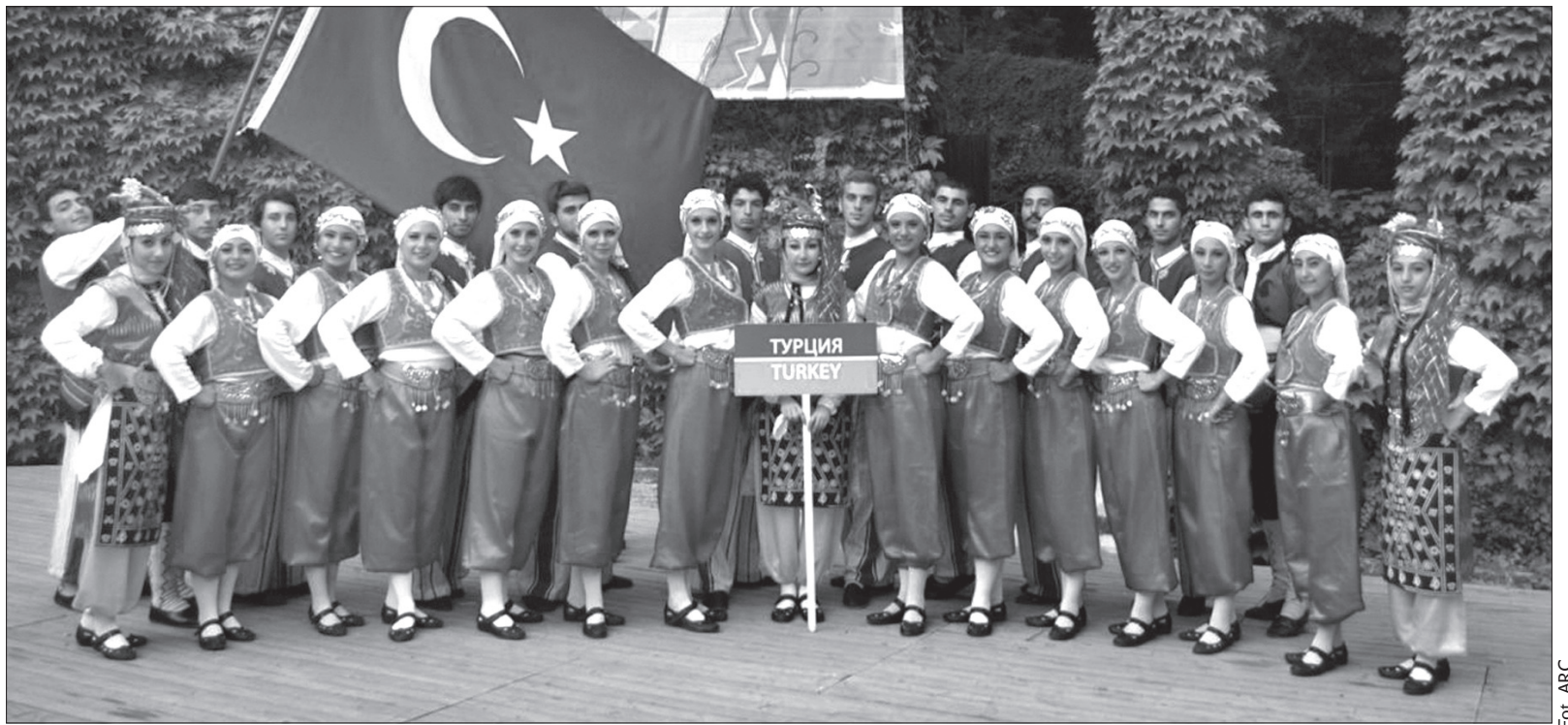
Wśród zagranicznych zespołów, które zaprezentują się świętogorolskiej widowni, będzie m.in. turecki „Aegeanfolk”.