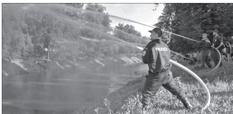
Strażacy z obu stron Olzy uczcili pamięć tragicznie zmarłych kolegów utworzeniem mostu wodnego nad rzeką.

Od kilku lat polscy i czescy strażacy upamiętniają tragiczne wydarzenia z lipca 1970 przez utworzenie symbolicznego mostu wodnego na Olzie. Z obu brzegów kierują na drugą stronę strumienia wody. W nurt rzeki kładzie się symboliczny wieniec. Podobnie jak to było w poprzednich latach, także teraz niezwykle widowisko ku pamięci tragicznie zmarłych strażaków przyszyły nad Olzę oglądać tłumy ludzi z obu stron granicy. (ep)