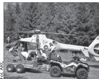
Po jednego z paralotniarzy przyleciał na Jaworowy śmigłowiec.

Chwilę po tej akcji ratownicy wezwani zostali do drugiego wypadku, do którego doszło niedaleko miejsca, z którego paralotniarze startują do lotu z Jaworowego. Tym razem innemu lotniarzowi nie powiodł się start, nie nabrał on odpowiedniej prędkości i spadł z wysokości około 20 metrów. Jak poinformował Svoboda, mężczyzna na chwilę stracił świadomość, GOPR-owcy musieli więc poprosić o pomoc lotnicze służby ratownicze. Rannego przetransportowano śmigłowcem do Szpitala Uniwersyteckiego w Ostrawie. (kor)