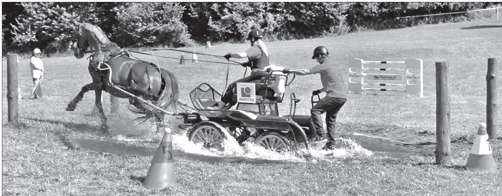
Zaprzęgi miały do pokonania liczne przeszkody.

W roku ubiegłym w zawodach zaprezentowały się dwie „czwórki”, i 16 „dwójek”, w tym roku natomiast zgłosiło się już pięć zaprzęgów czterokonnych i aż 21 dwukonnych – w sumie w zaprzęgach znalazło się ponad 60 koni, a najmłodsza uczestniczka powożąca