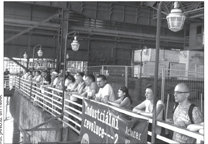
Industrialna atmosfera koncertów.

łak. W tym roku na terenie festiwalu można było spotkać również grupy widzów z Austrii, Holandii czy Niemiec. (jb)