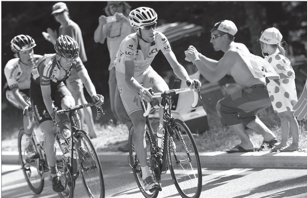
Vincenzo Nibali (z przodu), Leopold Koenig i Rafał Majka na trasie 13. etapu Tour de France.

Przełomem dla Majki był wyjazd do Włoch i starty w ekipie Gragnano Petroli Firenze. Udana występ w włoskich wyścigach zaowocowały współpracą z wpływowym mecenasem włoskiego kolarstwa, Giovan-