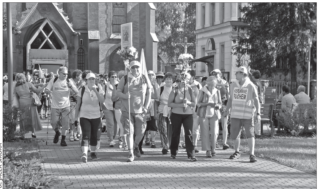
Uczestnicy 24. Pieszej Pielgrzymki Zaozlie – Jasna Góra wyruszyli w kierunku Częstochowy w sobotę rano, po mszy św. w czeskocieszyńskim kościele pw. Najświętszego Serca Pana Jezusa.