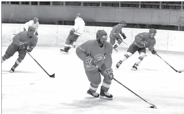
Podczas wczorajszego treningu w Werk Arenie.