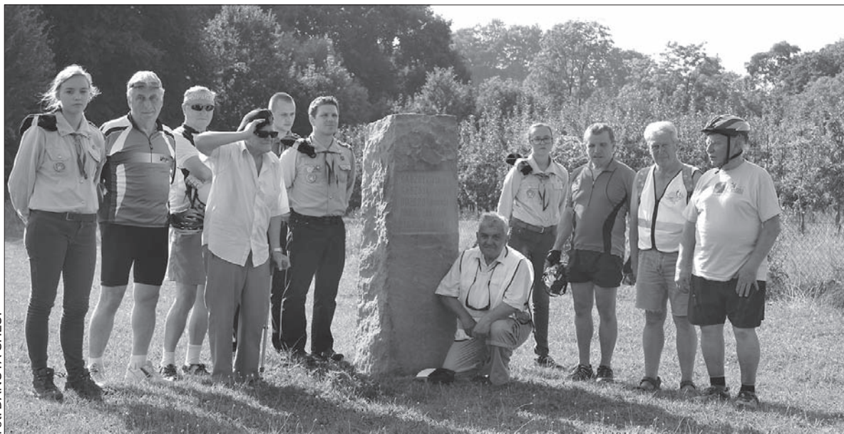
Rajdy po żywocickich stelach odbywają się systematycznie od kilku lat.