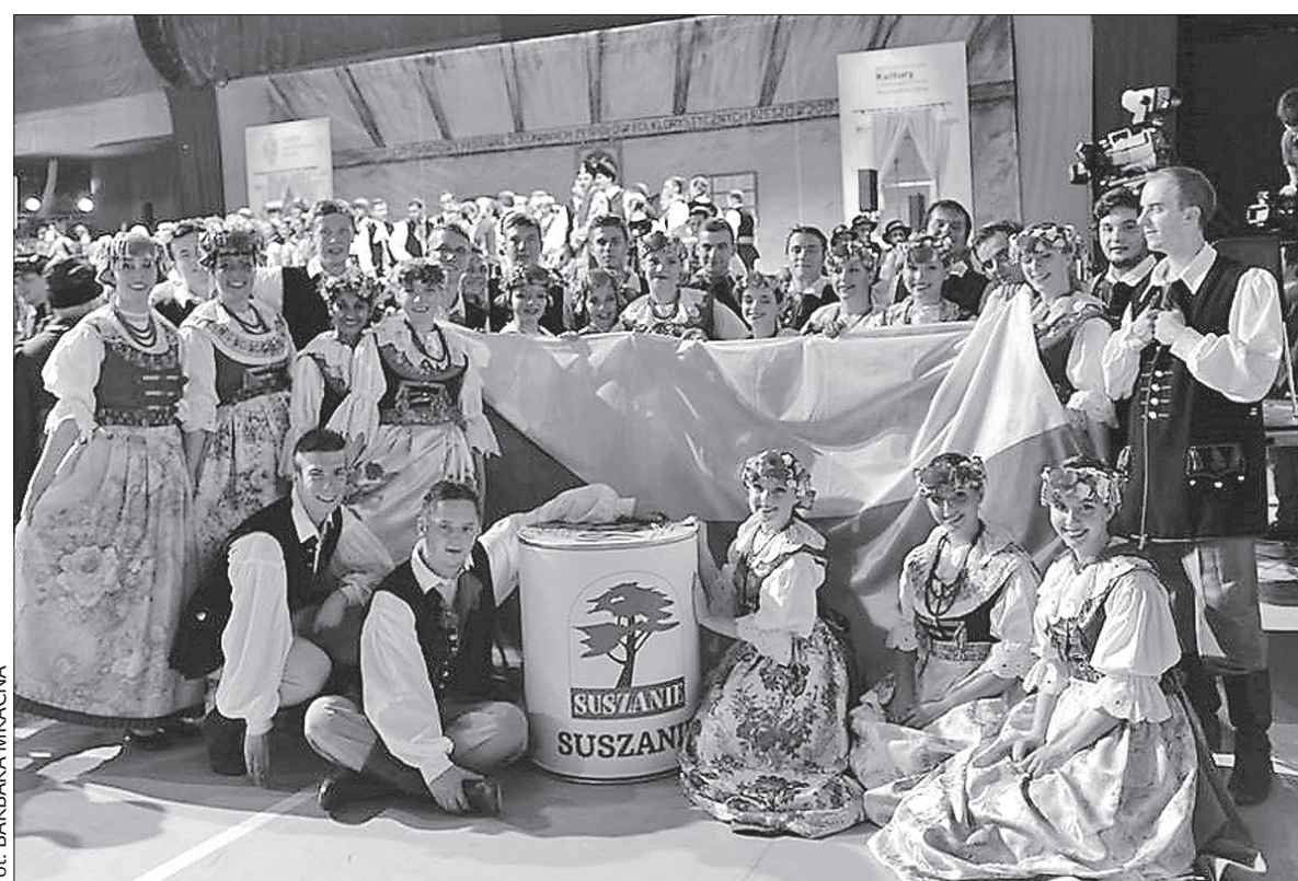
Zespoły Pieśni i Tańca „Suszanie” z Suchoj Górnjej i „Olza” z Czeskiego Cieszyna wzięły w tym tygodniu udział w XVII Światowym Festiwalu Polonijnych Zespołów Folklorystycznych w Rzeszowie. Na zdjęciu „Suszanie” po Koncercie Galowym, który odbył się we wtorek w hali widowiskowej. Festiwal zakończył się wczoraj. Wkrótce zamieścimy bardziej obszerną relację. (dc)