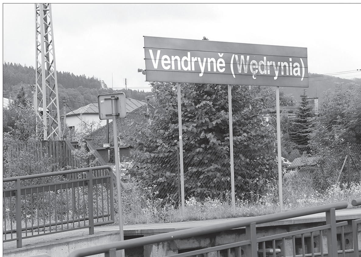
Nieznani sprawcy „popisali” się także na stacji kolejowej.