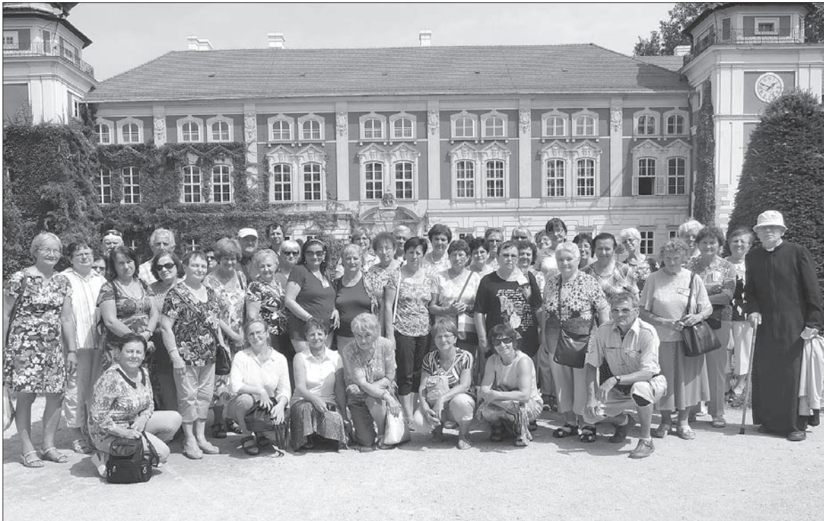
Pielgrzymi przed pałacem w Łańcutu.

Z Łańcuta pielgrzymi udali się do Przemysła, najstarszego miasta na wschodzie Polski. W przemyskiej archikatedrze z XVI wieku Cieszynianie mieli własną mszę