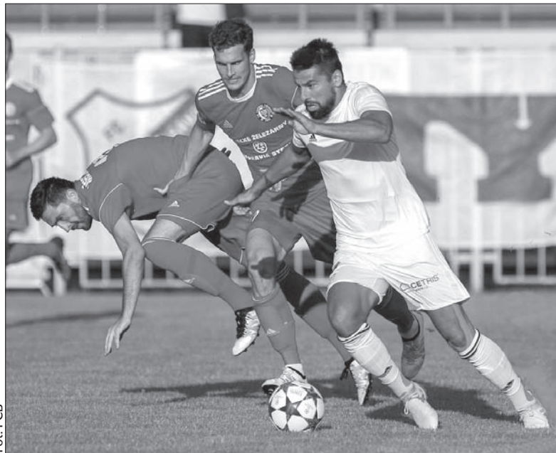
Przy piłce Milan Baroš, jedna z gwiazd ligi.