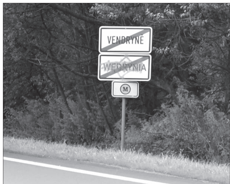
Zdjęcia: MAŁGORZATA BRYL