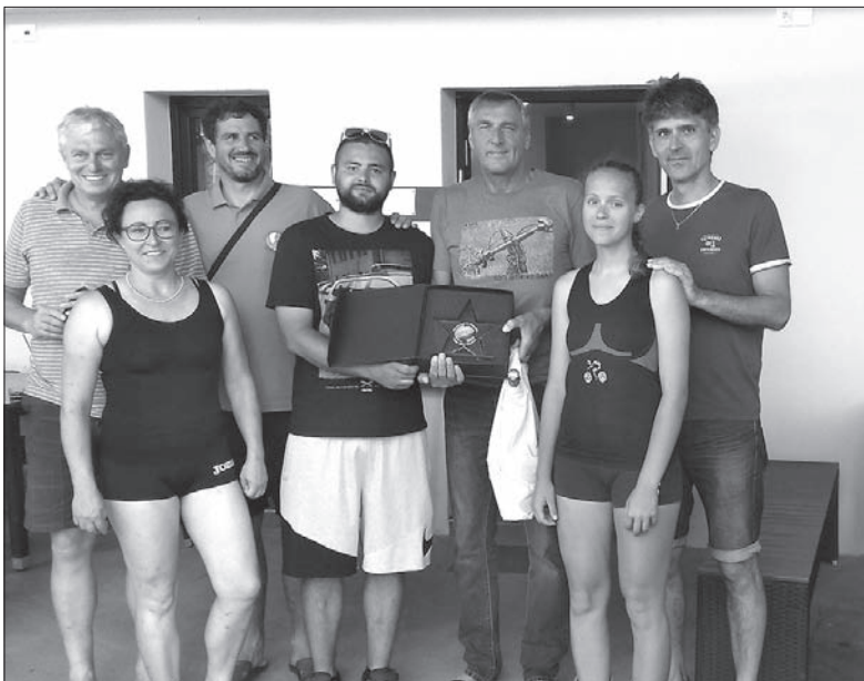
Zwycięska słowacka drużyna.