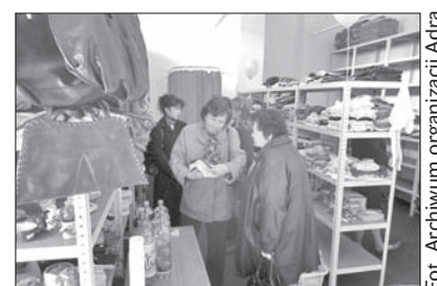
Ubrania dla najbardziej potrzebujących Adra oferuje już w Hawierzowie.

Ubrania rozdawane będą za darmo lub za symboliczną sumę 10-20 koron. Należy jednak przedstawić potwierdzenie o pobieraniu zasiłku dla najbardziej potrzebujących lub zaświadczenie o złej sytuacji materialnej. (ep)