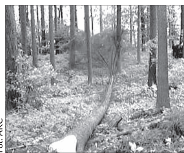
Fragment lasu koło Hawierzowa.

Lasy podmiejskie, często bezpośrednio wkomponowane w osiedla,