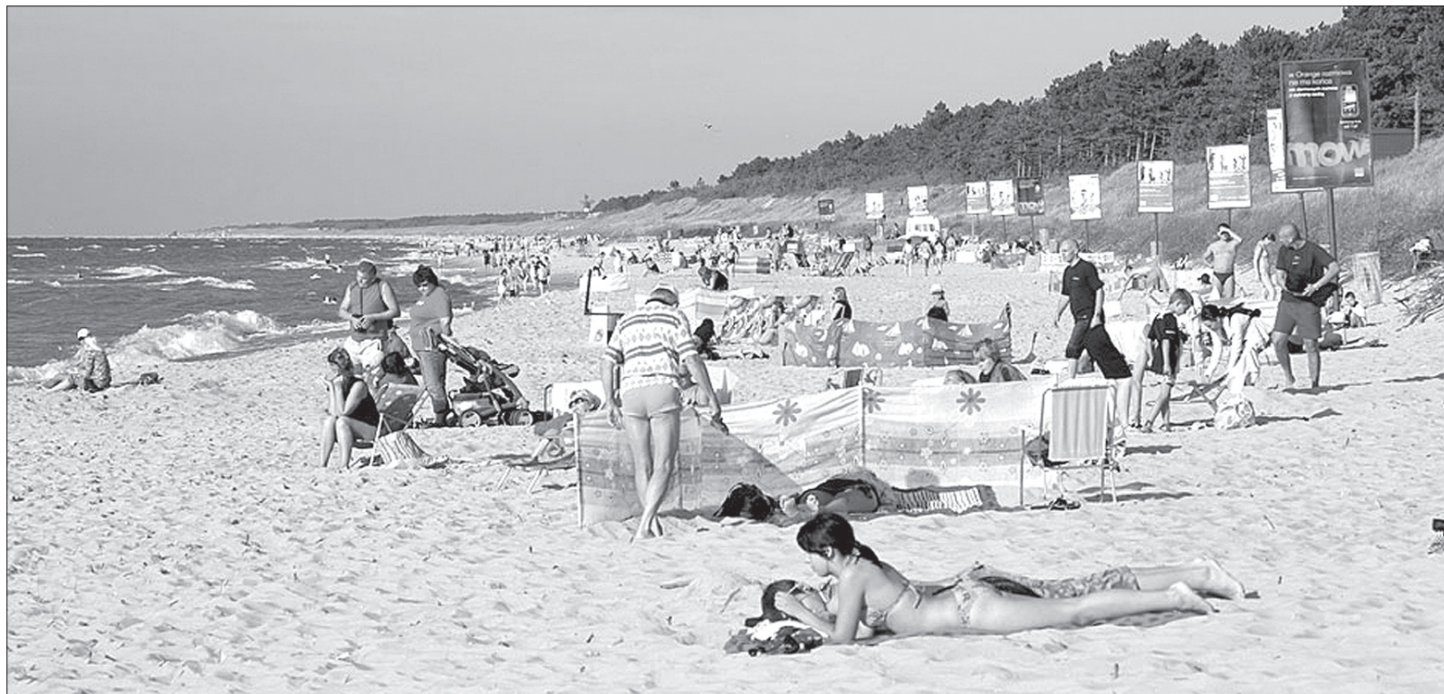
Piękna pogoda przyciąga ludzi na plaże. Ratownicy ostrzegają, by uważać na fale i prądy.

PROBLEM: W Bałtyku utonęła w tym sezonie rekordowa liczba osób. Od soboty do poniedziałku na całym wybrzeżu życie straciło w wodzie aż 16 osób. To najtragiczniejszy bilans od lat. Jak podkreślają ratownicy, przyczyną większości utonięć jest ludzka nierozważność, nie docenianie morza oraz alkohol. Kto wybiera się nad wodę, powinien przypomnieć sobie kilka podstawowych zasad bezpieczeństwa.