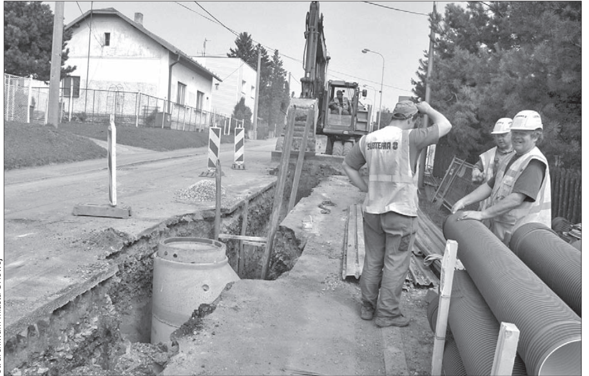
Budowa kanalizacji ściekowej w Orłowej.

Miasto podpisało umowę z wykonawcą kanalizacji, spółką Subterra. Umowa obejmuje również naprawę dróg asfaltowych, które zostały w związku z budową rozkopane. Nowa nawierzchnia ma pokryć szerokość wykopu oraz po pół metra z każdej strony. Spółka budowlana nie zgadza się na wykonanie remontu, argumentując, że parametry techniczne dróg, o które chodzi, nie odpowiadają obowiązującym obecnie normom technicznym. Spółka Subterra chce całkowicie przebudować te drogi, wobec czego miasto musiałoby zapłacić dodatkowo 64 mln koron. Jeżeli tak się nie stanie, spółka budowlana zamierza zaskarżyć miasto, które – zdaniem jej kierownictwa – naraża mieszkańców na niebezpieczeństwo. – Kontynuacja budowy według dotychczasowego projektu oznacza, że odpowiedzialne osoby zamawiającego (czyli ratusza – przyp. red.) mogą popełnić czyn karalny – stoi w liście, który Subterra rozesłała wszystkim radnym miasta. Argument, że drogi, o które toczy się spór, od lat bez problemu służą ludności, nie trafia do przedsiębiorstwa. – Miasto buduje kanalizację, nie zaś nowe drogi i od listopada ub. roku stara się skłonić firmę Subterra, by rozpoczęła naprawy zgodnie z