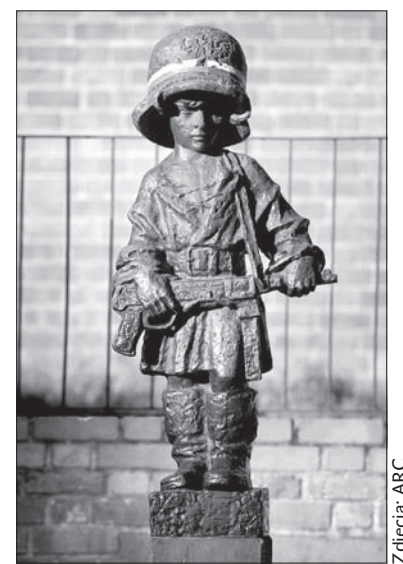
Pomnik małego powstańca.