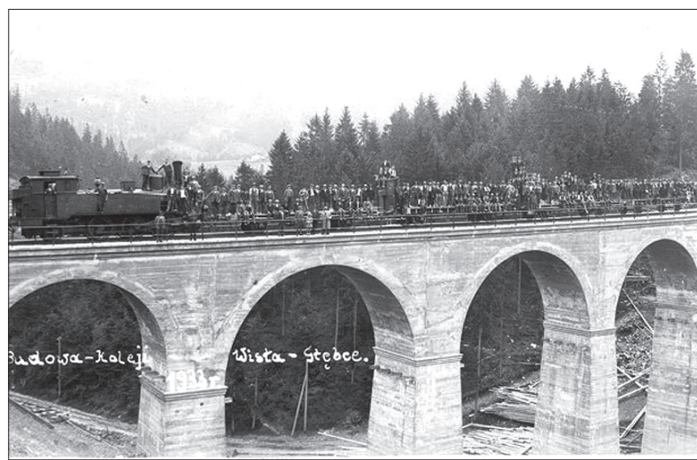
Budowa wiaduktu skończyła się w 1932 roku.

49. Tydzień Kultury Beskidzkiej rozpoczął się w ten weekend. W Wiśle tygodniowe święto folkloru otworzył barwny korowód, w którym uczestniczyły setki śpiewaków i tancerzy. Wszyscy przemaszerowali przez centrum Wisły, by dotrzeć do wiślańskiego amfiteatru im. Stanisława Hadyny, gdzie przy dźwiękach trombity zainaugurowano imprezę. Bardzo dużo działa się także w Żywcu, gdzie równolegle do TKB odbywał się Festiwal Folkloru Górali Polskich. Żeby tradycji stało się zadość, sygnał do otwarcia dała pieśń „Szumi jawor”. Sobotni koncert w stolicy Żywiecczyny otworzył występ zespołu „Limanowianie” z Limanowej. Z polskich grup biorących udział w konkursie wystąpili jeszcze: „Skalni” z Krakowa, zespół studencki, od wielu lat prezentujący się na estradach Tygodnia Kultury Beskidzkiej; „Hulajniki” z Milówki oraz „Oldrzychowice” z Oldrzychowic, które w 2010 roku wygrały Festiwal Folkloru Górali Polskich. Tradycyjnie już, oprócz Wisły i Żywca, folklorystyczne występy można oglądać także w Markowie Podhalańskim, Oświęcimiu i Szczyrku. (wot)