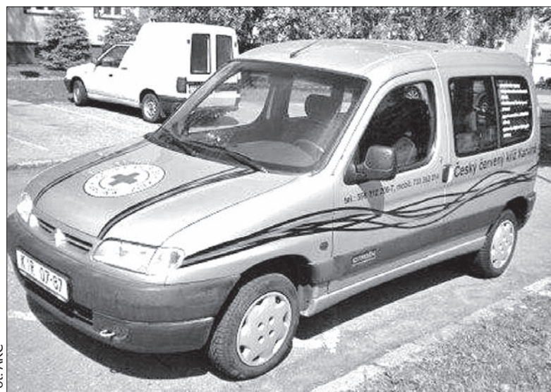
Samochód, który wozi seniorów do lekarza, po zakupy, do znajomych...