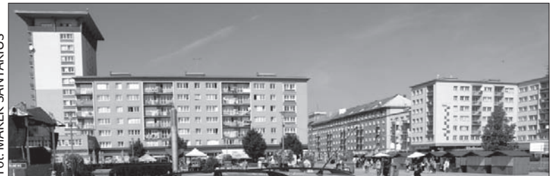
Centrum Hawierzowa.

wynosił 800 koron. Miasto wyremontowało dotąd 2,2 tys. mieszkań komunalnych z ogólnej liczby 7,7 tys. Do końca przyszłego roku ma ocieplić kolejnych 1,6 tys. mieszkań. Na inwestycję zaciągnęło kredyt w wysokości 150 mln koron, który będzie spłacany właśnie z dochodów z czynszu. (dc)