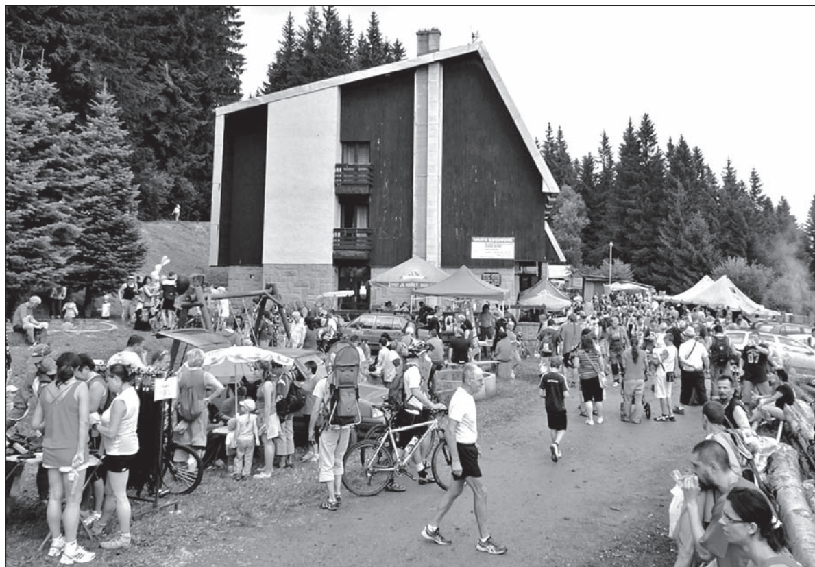
W niedzielę na Kozubową ludzie dotarli na piechotę, rowerami oraz (niestety) samochodami.

(wyniki z biegu na str. 8)