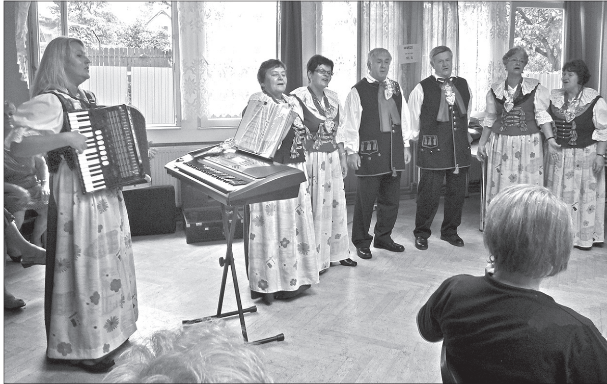
Festynową publiczność bawiły „Olzanki” z Olzy.

Odpust św. Anny i Festyn Ogrodowy Miejsowego Koła Polskiego Związku Kulturalno-Oświatowego – te dwie imprezy w Karwinie-Raju idą w parze. W tym roku festyn odbywał się pod znakiem jubileuszu 65-lecia Koła i całego Związku.