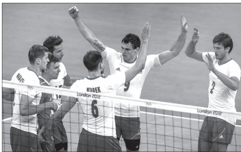
Polscy siatkarze rozbili Włochów, dziś pora na Bułgarów

Siatkarze pokonali Włochów w wielkim stylu 3:1 i są na najlepszej drodze do awansu z grupy A. – Mecz z Włochami zaczęliśmy nerwowo, bardzo dziwnie. Musieliśmy chyba zapłacić frycowe, był to przecież dla nas mecz otwarcia. Na szczęście udało nam się przetrzymać nawałnicę włoskiej zagrywki. Oni już się później w tym elemencie trochę pogubili, a my przejęliśmy inicjatywę i dobiliśmy przeciwnika – powiedział polskim dziennikarzom środkowy