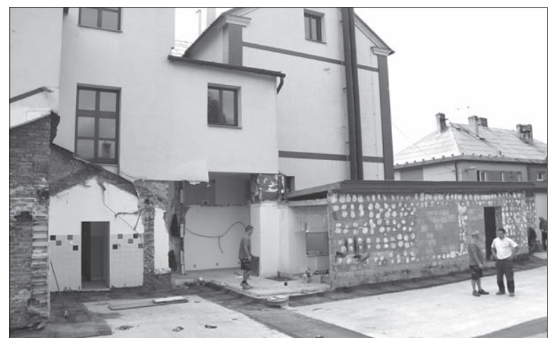
Remont wędrzyńskiej polskiej podstawówki idzie pełną parą. Tam, gdzie teraz można spotkać robotników, już niedługo stanie nowa szatnia dla dzieci, a stara zostanie zagospodarowana na klasę. Firma budowlana ma zdążyć z remontem, który obejmuje również toalety i lokal dyrekcji, przed rozpoczęciem roku szkolnego. Ten w wędrzyńskiej polskiej szkole zaplanowano na poniedziałek 5 września. (sch)