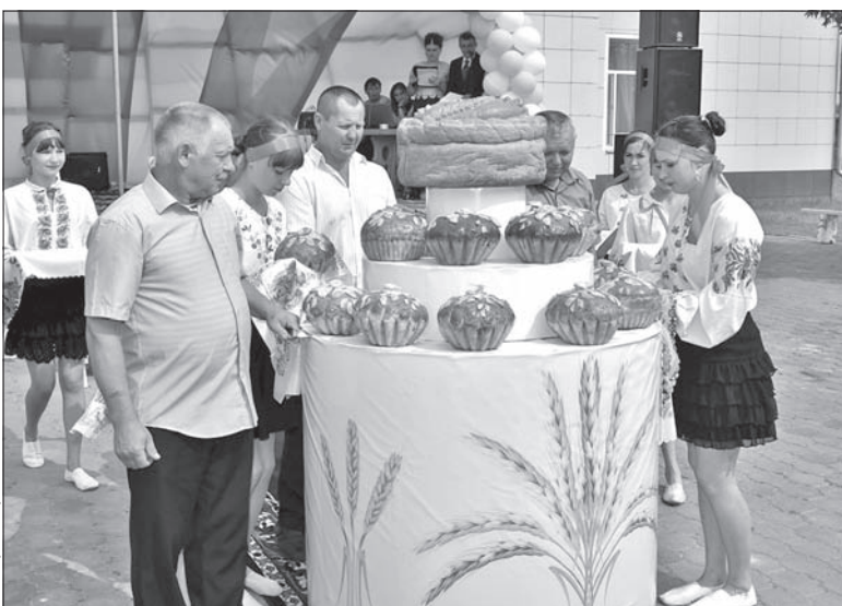
Większość mieszkańców Jasnej Polany stanowią Polacy.