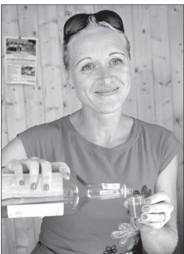
Perpetum mobile według gorola: – Wypij, bo nalote – nalyj, bo wypite, Wypij, bo nalote – nalyj, bo wypite...