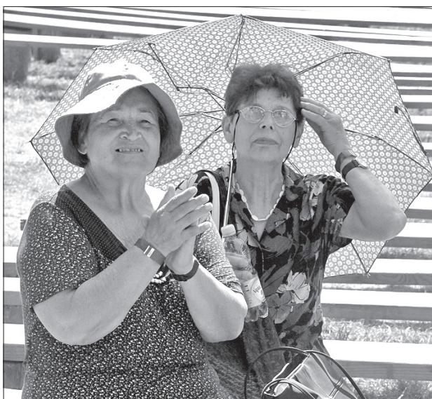
Słońce i upał nie odstraszyły widzów finalowego koncertu w Lasku Miejskim.