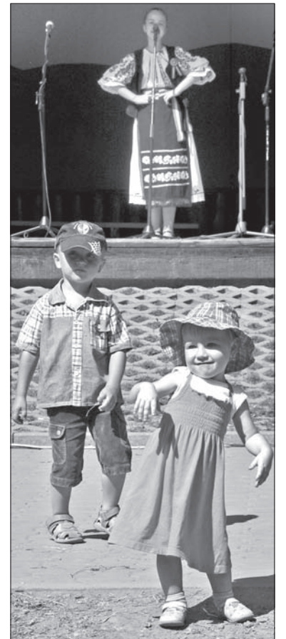
Dzieci tańczą przy muzyce rumuńskiego zespołu Datina Turdeana.