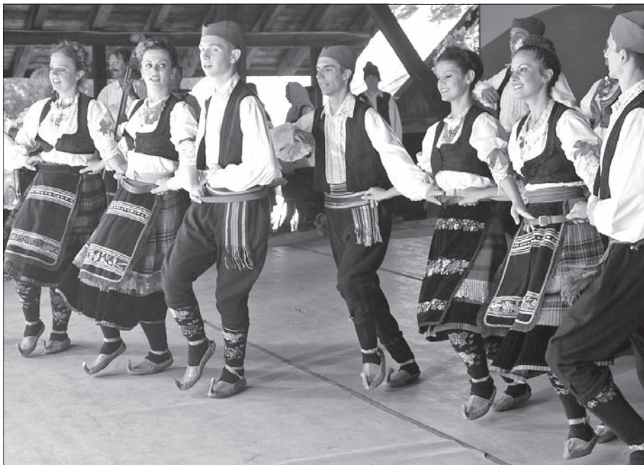
Z Serbii przyjechał zespół Smederevo, który zaprezentował się również widzom TKB.