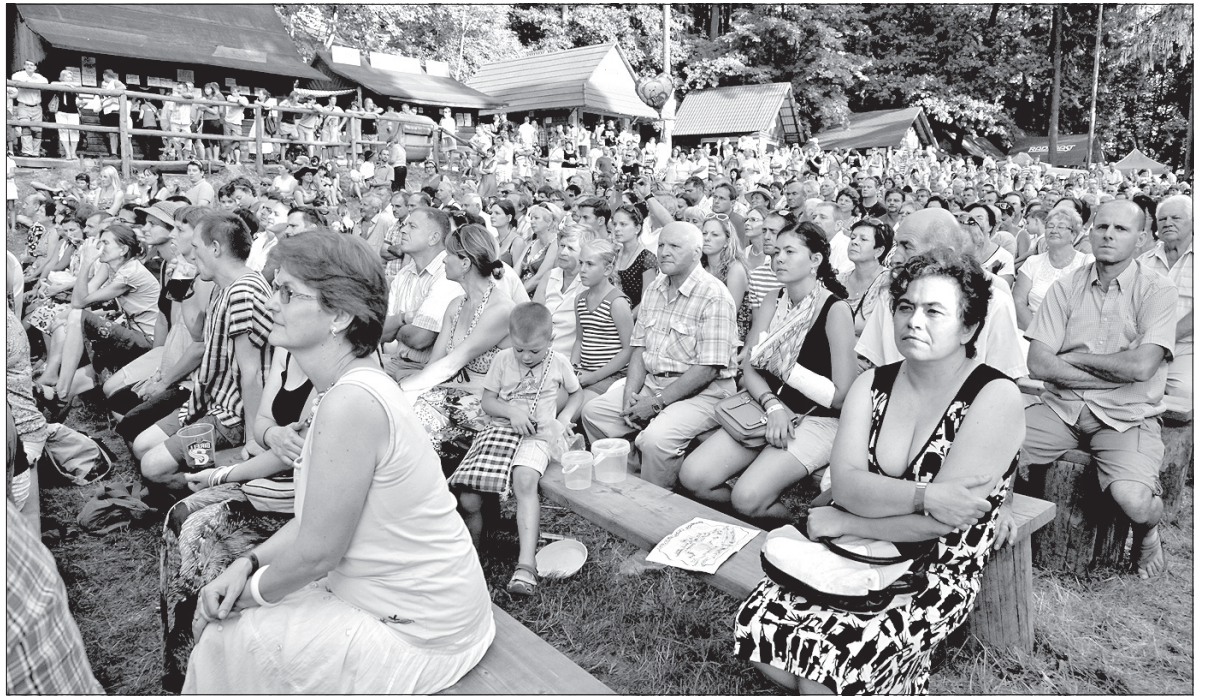
W niedzielne popołudnie o miejsce na widowni było trudno.