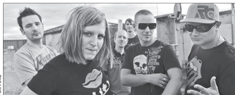
Do gwiazd muzycznej części festiwalu należy czeska formacja taneczna Skyline.

Na scenie teatralnej zagości m.in. wataha OSTR.ŪŽ.I.N.Y oraz Warsztat Teatralny, nie zabraknie ciekawych filmów z festiwalów Tell it quick, Jeden svět, Anifest, a także programu towarzyszącego w postaci pokazu rowerów BMX i innych ciekawostek. (ep)