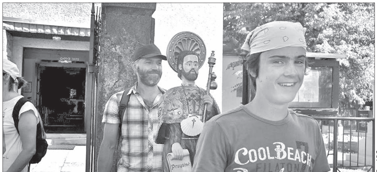
Pielgrzymi nieśli figurę św. Jakuba.