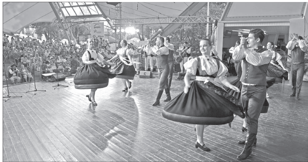
Owację publiczności wywołał także występ Zespołu Pieśni i Tańca „Olza”.

Turcji za wykonawstwo muzyczne i technikę taneczną, „Wołynianka” z Łucka na Ukrainie za prezentację fragmentów wesela z Polesia Wołyńskiego, „Wielkopole” z Poznania za stylową prezentację wielkopolskich zwyczajów karnawałowych w strojach, muzyce, tańcach i rekwizytach, „Datina Turdeana” z Turdy w Rumunii za prezentację zwyczaju wyboru najlepszego żniwiarza, „Brenna” z Brennej za wiernie tradycji przedstawienie części weselnego obrzędu oczepin i tańców własnego regionu oraz grupa „Paraguay Rokove” z Asuncion w Paragwaju za prezentację wartości kulturowych Paragwajczyków.