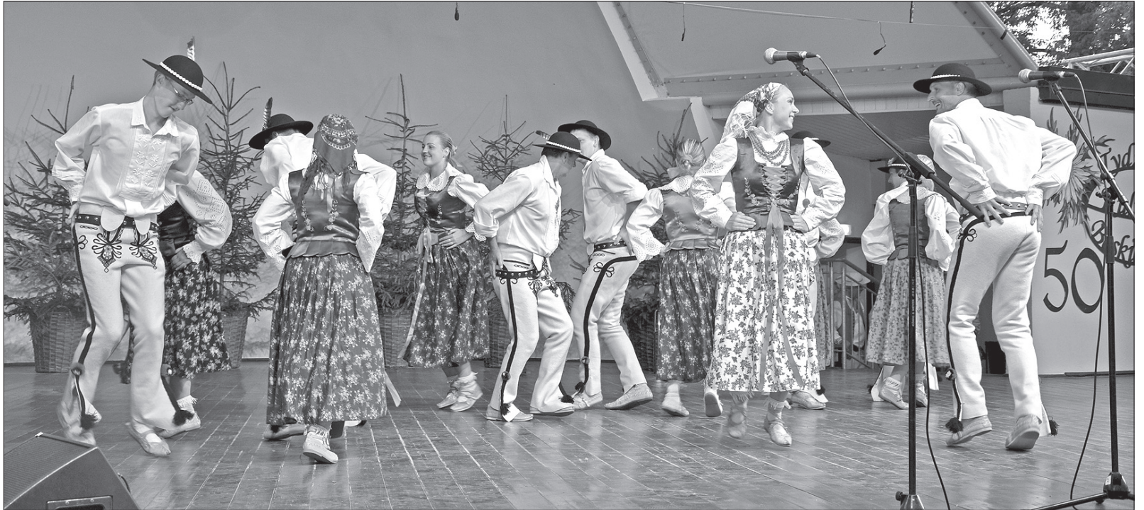
Na wiślańskiej scenie TKB zaprezentował się m.in. zespół „Zaolzi” z Jablonkowa.

Po szczegółowej analizie programów wszystkich zespołów jurorzy przyznali tytuł Grand Prix zespołowi „Májek” z Brna w Republice Czeskiej. Przyznano również sześć innych nagród. Otrzymały je zespoły: „Kocaeli Armelit” z Izmitu w