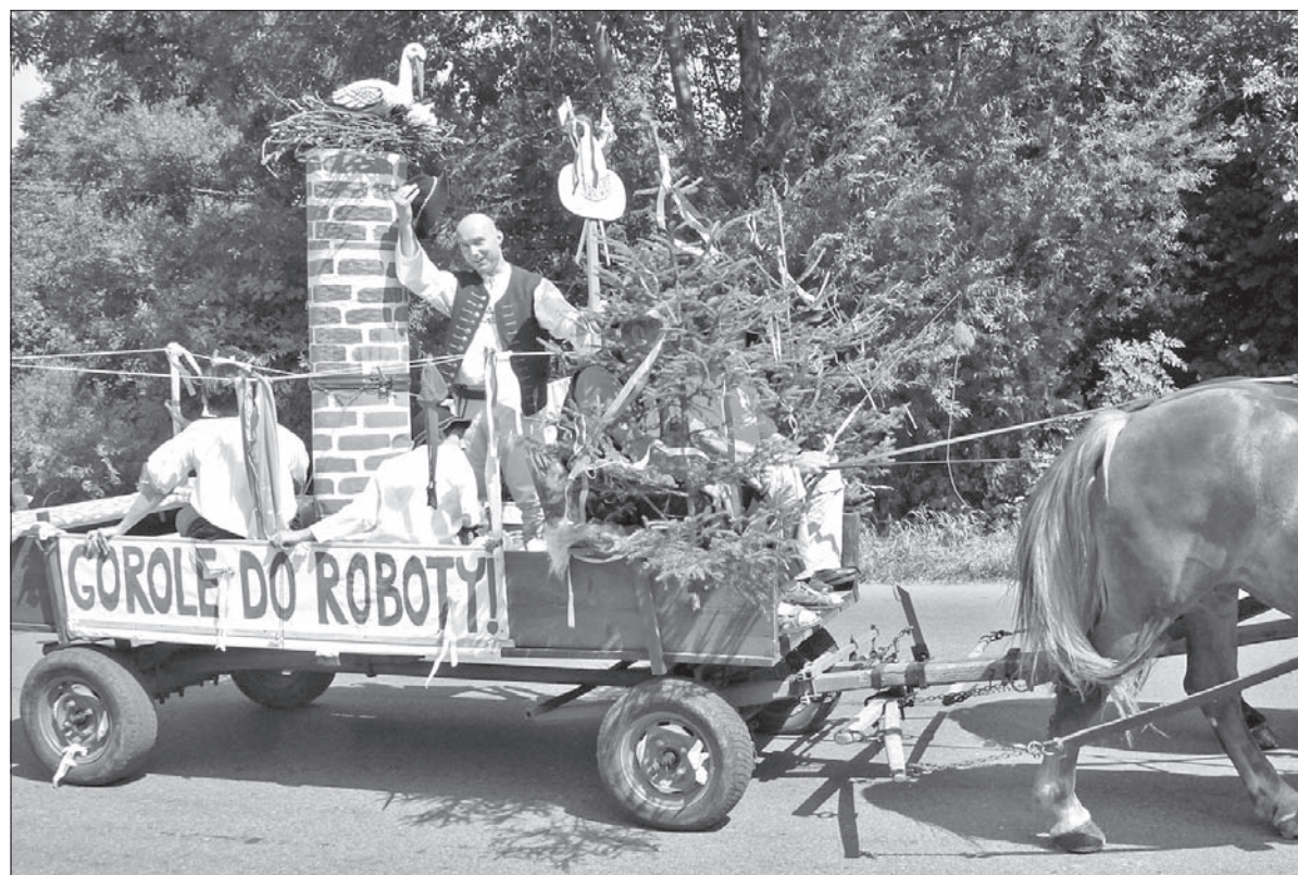
Wymowne hasło na wozie alegorycznym MK PZKO Boconowice.

polskiego przedszkola w Karwinie -Fryszacie wystąpiły z programem „Jak hawiryz Maślak kramarzył z Pusteckim”. Po występach zespołów z Polski, Serbii czy Rumunii przy-