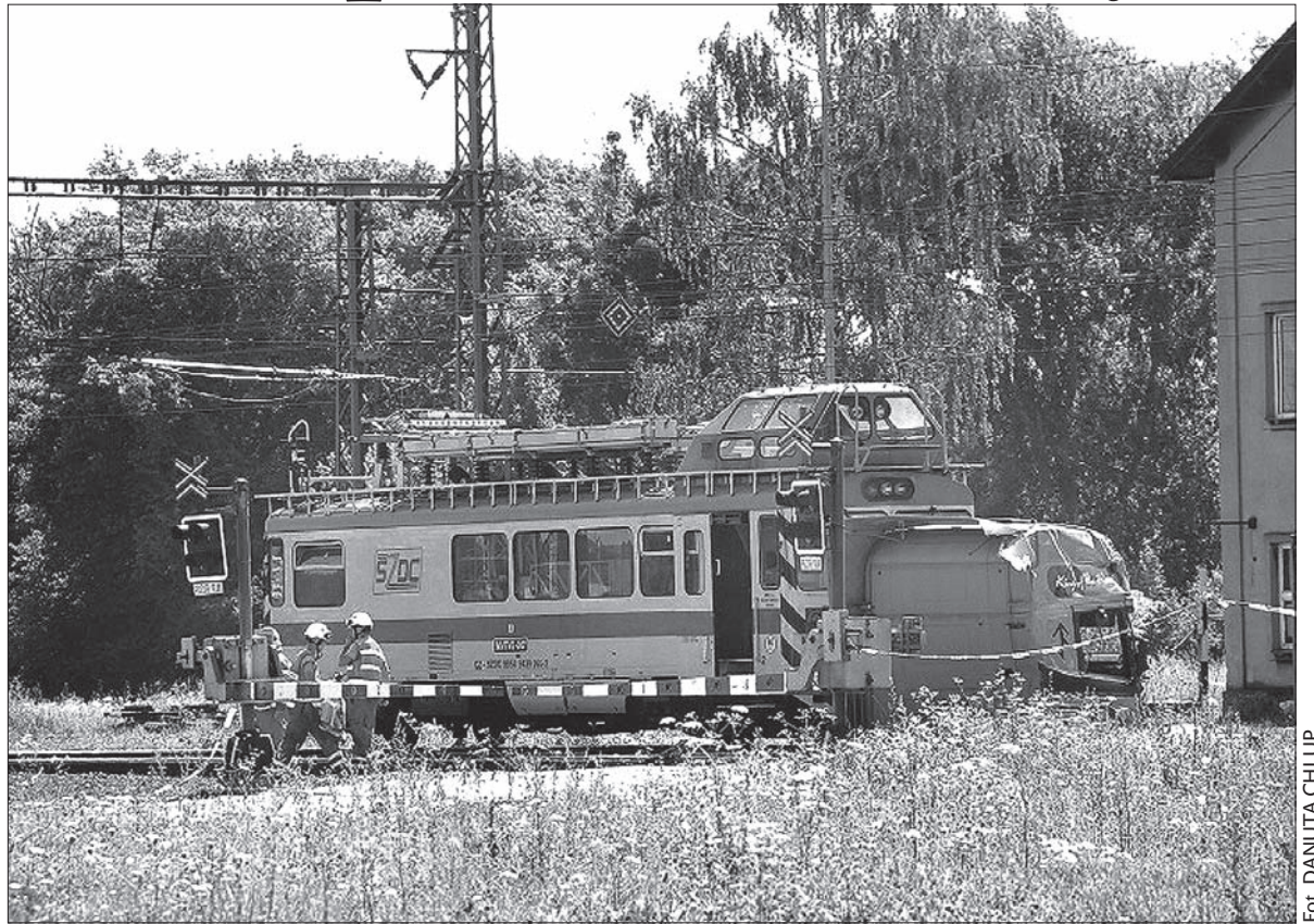
Odszkodowania rodzinom ofiar i rannym wypłaci ubezpieczalnia, w której ubezpieczony jest kierowca tira.

Rodziny ofiar otrzymają ponadto dary finansowe od województwa morawsko-śląskiego. We wtorek zdecydował o tym zarząd woje-