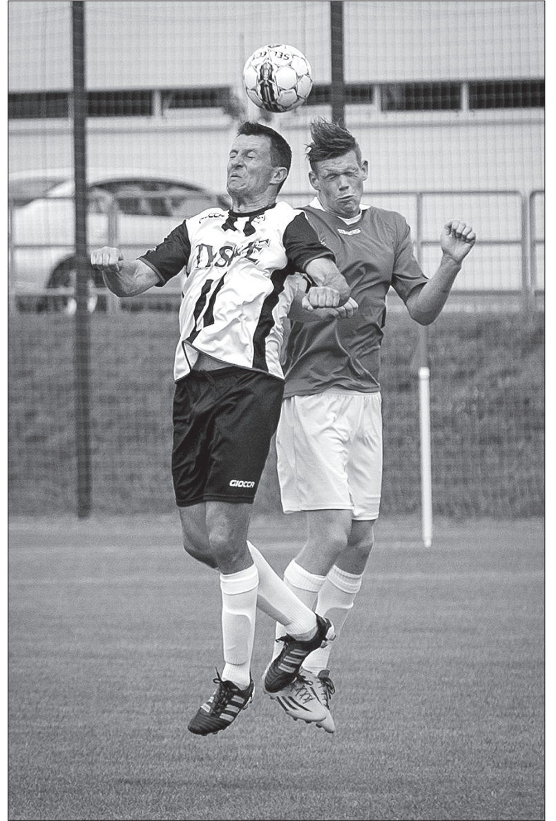
Nasi piłkarze pokonali we wtorek Kanadę 1:0.