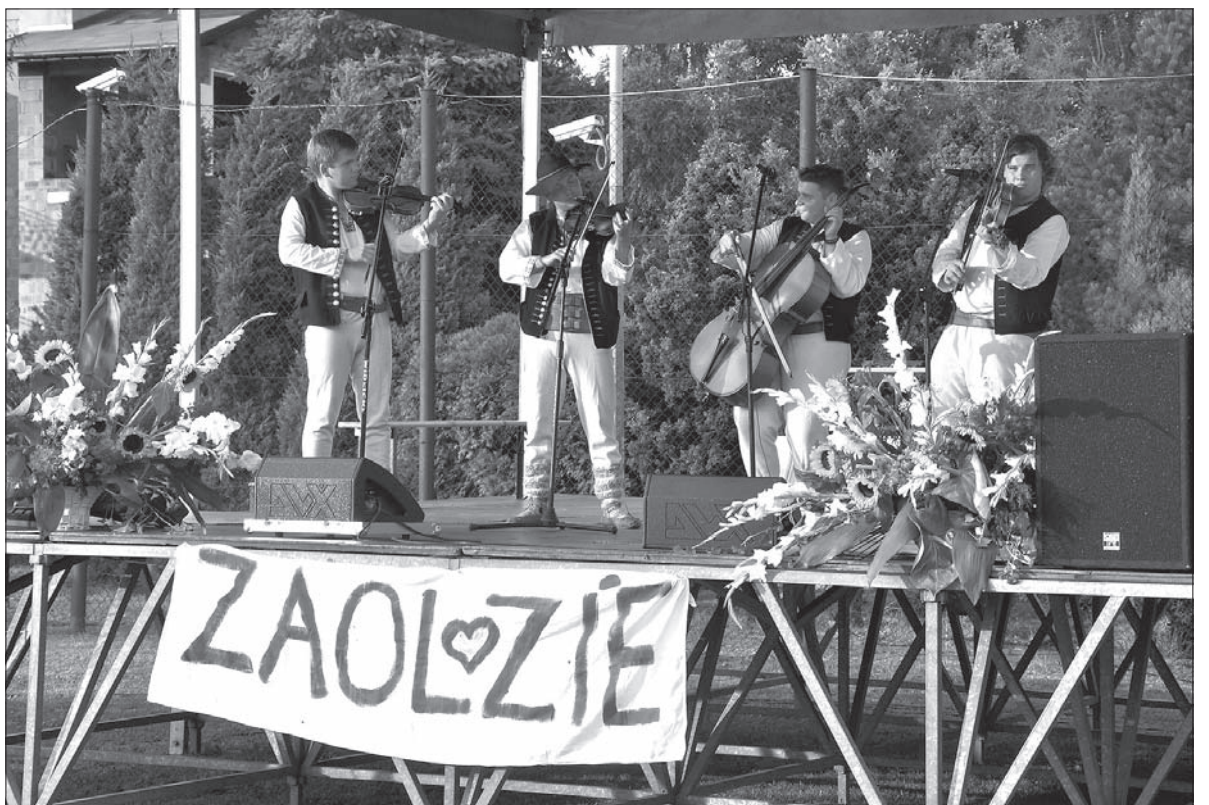
Kapela „Lipka” i jej góralskie granie w Wodzisławiu Śląskim.