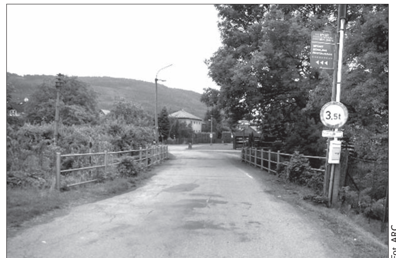
Włodarze Šmílovic apelują, by na ten most samochodem nie wjeżdżać.