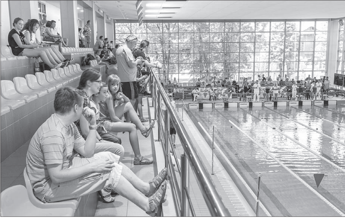
Emocje na basenie w Rybniku.