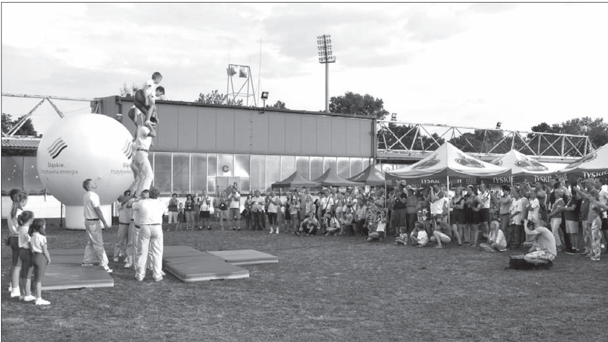
Wędryńscy „Gimnaści” zauroczyli wszystkich podczas Dnia Zaolzia w Wodzisławiu Śląskim.