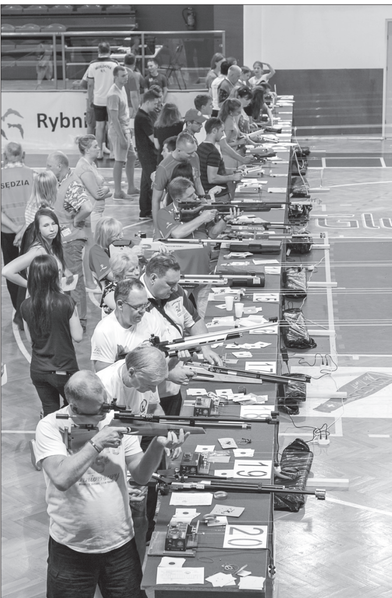
Zaolziańscy strzelcy wywalczyli cztery medale.