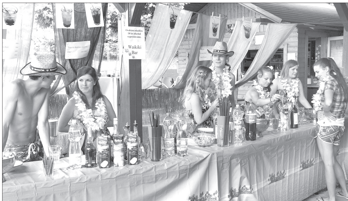
Waiki Bar Klubu Młodych „Gróń” oferował całą gamę drinków.

W poszukiwaniu ciepłego plażowego piasku nie trzeba jeździć na drugi koniec świata. W sobotę część parku przed Domem PZKO w Bystrzycy zamieniła się w egzotyczną plażę. Co prawda zabrakło morza, ale ten mankament rekompensował z nawiązką program imprezy – VI Hawaii Party, zorganizowanej przez Klub Młodych „Gróń” przy Miejscowym Kole PZKO w Bystrzycy oraz bar „Destiny”.