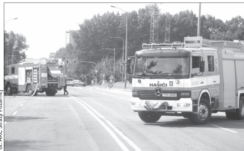
Wozy strażackie zablokowały ul. Dělnicką.

Na ul. Dělnickéj w pobliżu hipermarketu Globus na dwie godziny wstrzymano ruch kołowy. Pojazdy kierowano na drogi objazdowe. (dc)