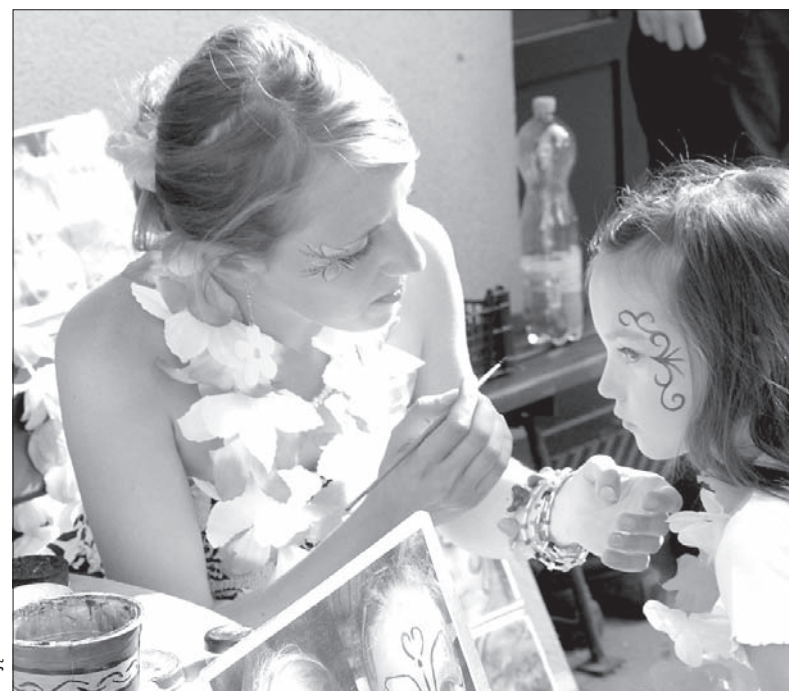
Na Hawaii Party nie zabrakło atrakcji dla dzieci.

W bystrzyckiej Hawaii Party bierze udział głównie młodzież oraz rodzice z małymi dziećmi. Dla najmłodszych klubowicze przygotowali bogaty program – stoiska sprawnościowe, malowanie na twarzy oraz własnoręczne malowanie koszulek.