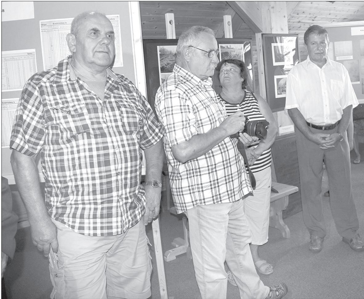
Nowszą historię tuneli w Mostach ilustrują kolorowe zdjęcia.

Wystawa o Tunelach Jabłonkowskich przybliży ich historię począwszy od 1868 roku, kiedy rozpoczęto wykupywanie parceli pod pierwszy tunel. Jego budowa trwała niespełna dwa lata, od 1871 roku mogły tędy przejeżdżać pierwsze pociągi.