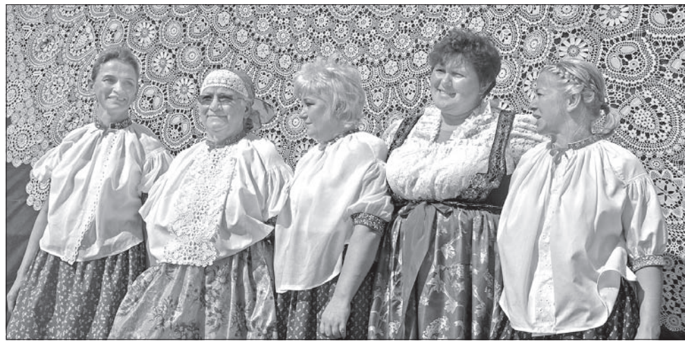
Gigantyczna koronka jest dziełem tych pań.

smę, żeby skoordynować całość. Najważniejsze, żeby to dzieło zobaczyło jak najwięcej osób – wyraziła nadzieję ostatnia z wymienionych.