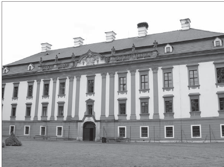
W zamku w Kuninie dobiega końca wystawa o Sienkiewiczu.