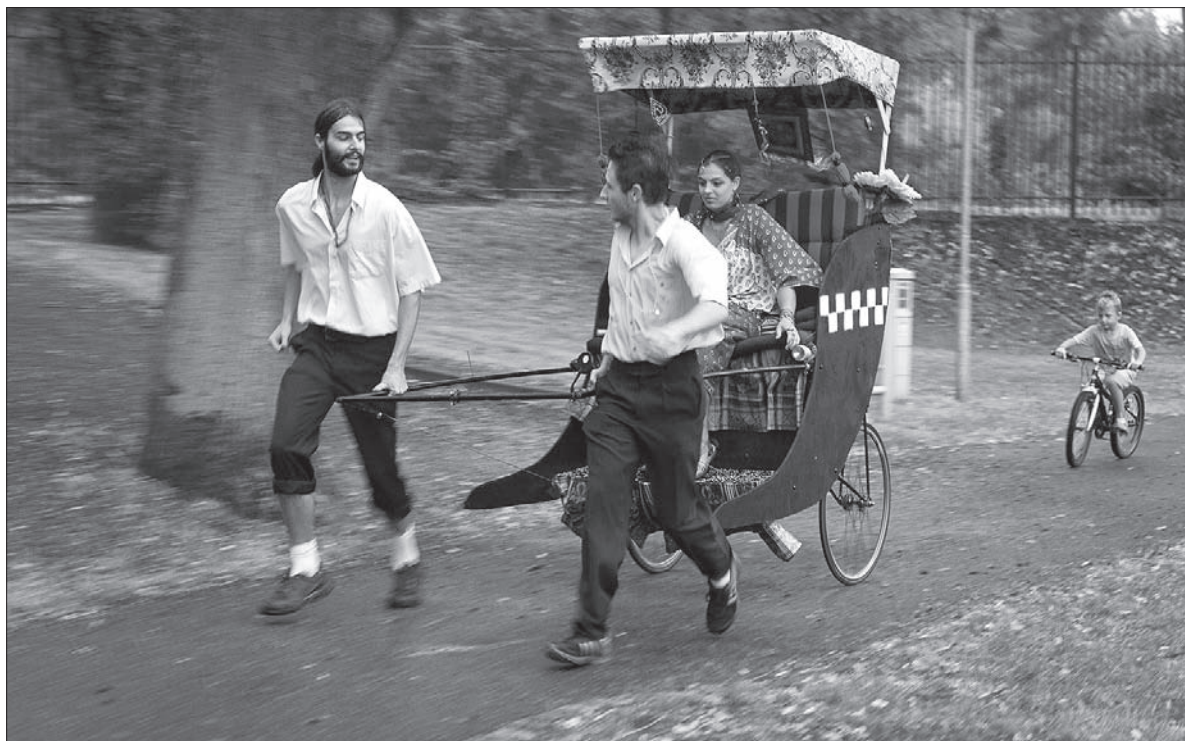
Bollywood Taxi na trasie wyścigu.

wyzwaniem była próba równowagi – piłeczkami umieszczonymi na drewnianej płycie należało trafić do czterech otworów.