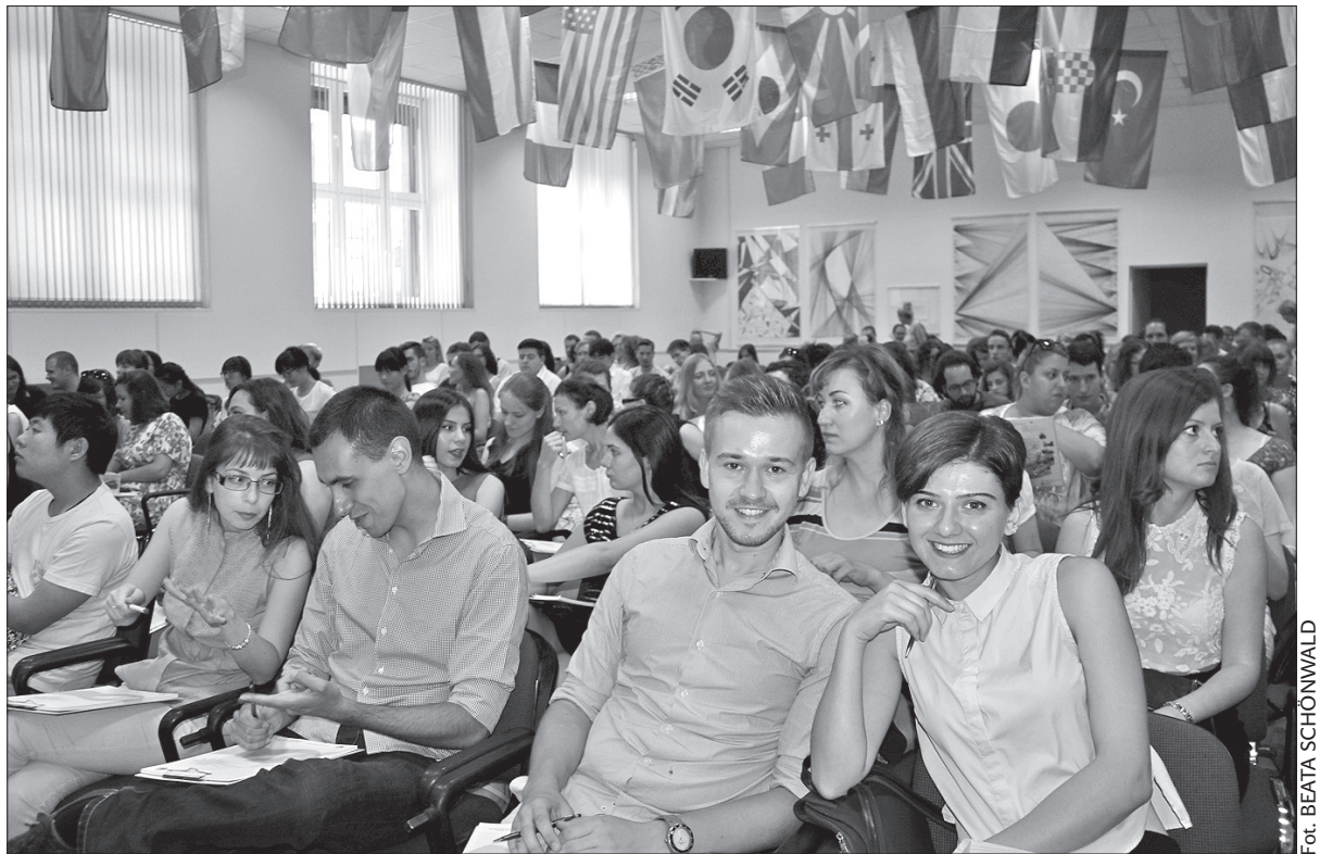
Ostatnie chwile oczekiwania. Za chwilę rozpocznie się wielkie dyktando dla cudzoziemców.