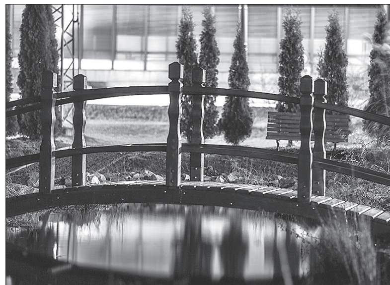
Wirtualnie można odwiedzić m.in. mały park z oczkiem wodnym przed Urzędem Gminy.