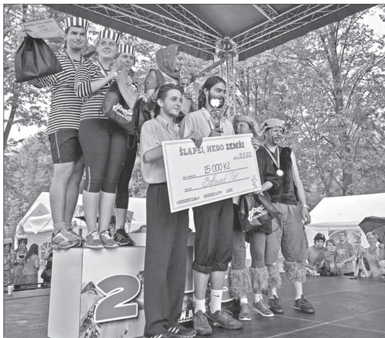
Podium dla najlepszych trzech ekip.

A są one ciekawe. W ostatnim wydaniu „Jedź albo zgin” było ich sześć. Pierwsza polegała na znalezieniu igły w stogu siana. Następna polegała na postawieniu loga wyścigu z wielkich „klocków” zrobionych z pudeł kartonowych. Kolejnym zadaniem było pokonać slalom między oponami. Potem także oponami trzeba było rzucić, by trafić na betonowy słupek. Następnie drużyny musiały obwiązać jednego członka załogi papierem toaletowym „na mumie”. Ostatnim