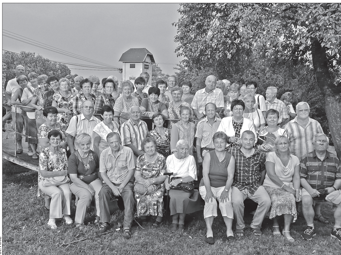
Pamiątkowe zdjęcie uczestników spotkania.