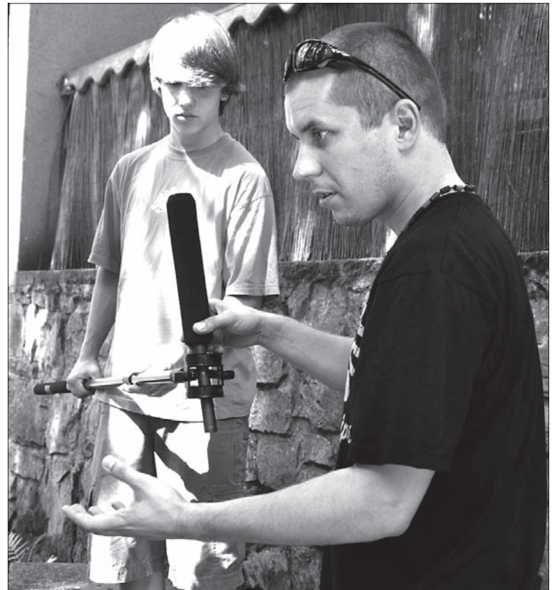
Jeden z wykładowców pokazuje, jak pracować z mikrofonem.