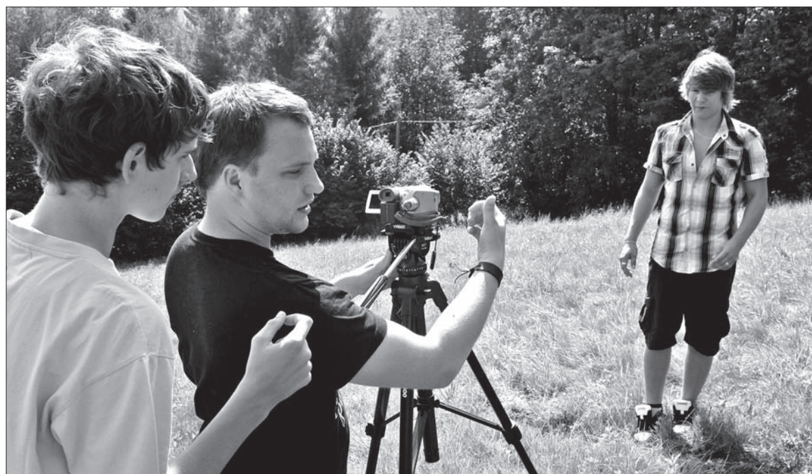
A tu już rodzi się filmowa etiuda.

Czy niektórzy z kursantów mogliby pójść w przyszłości na studia teatralne czy filmowe? – Widzę w tych młodych ludziach potencjał, wielu z nich próbuje. Obecnie jednak na studia teatralne trudniej się dostać, niż dawniej. Ale chętnie w przyszłości przywitałbym nawet kogoś z nich w Scenie Polskiej. A cieszy mnie, że niektórym ludziom, którzy w Koszarzyskach bawili się w film, udało się