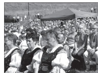
Kolejne spotkanie wiernych.

W sobotę pokaz strzyżenia owiec oraz tradycyjnej obróbki wełny zaprezentowali górale z Koszarzysk, którzy regularnie biorą udział Jarmarkach Pasterskich. W Koniakowie członkowie koszarzyskiego Ogniska Oddziału Górali Śląskich nie tylko jednak prezentowali dawną obróbkę wełny. Promowali także mistrzostwa w „strziganu” owiec, które odbędą się w sobotę, 29 sierpnia, o godz. 14.00 w Nydku „Na posiółku”. Zawody organizuje Spółka Koliba wspólnie m.in. z Ogniskiem Górali Śląskich oraz Miejscowym Kołem PZKO. (wik)