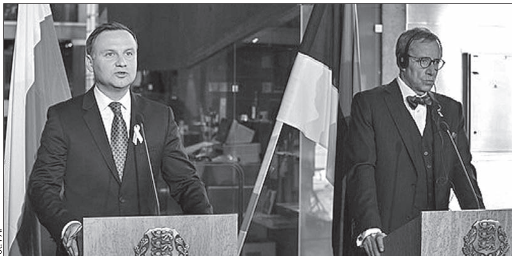
Prezydent RP Andrzej Duda (z lewej) przemawia w Muzeum Okupacji w Tallinie.

– Nie ma pokoju na świecie bez poszanowania prawa międzynarodowego, to jest sprawa jednoznaczna, nie wolno nam się zgadzać, kiedy to prawo międzynarodowe jest naruszane, kiedy naruszane są granice, kiedy naruszana jest suwerenność i niepodległość krajów. Tak się niestety znowu dzieje w Europie – powiedział.