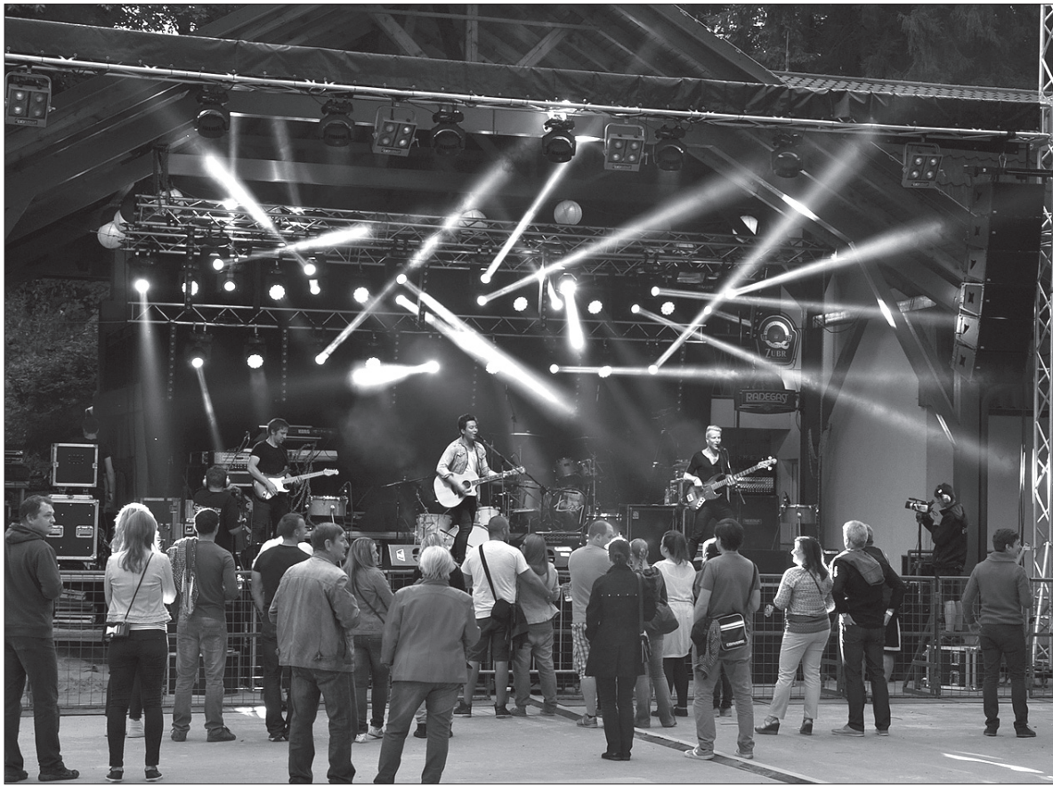
Bystrzycki Zlot przyciągnął fanów dobrej muzyki z całego regionu.