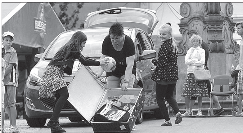
Podczas rekordowego pakowania bagażu bawiono się doskonale.

py Środkowo-Wschodniej jest niezwykle ważna. – Chciałbym, żeby łańcuch, który nazwano „Łańcuchem Wolności”, który stworzyliście, był kiedyś łańcuchem, który będzie sięgał od Morza Bałtyckiego, od Tallina, poprzez całą Europę Środkową, aż do Morza Czarnego i Morza Śródziemnego. To byłaby realizacja pewnego marzenia, wielkiej idei tworzenia i budowania wspólnoty – zaznaczył Andrzej Duda. (PAP)