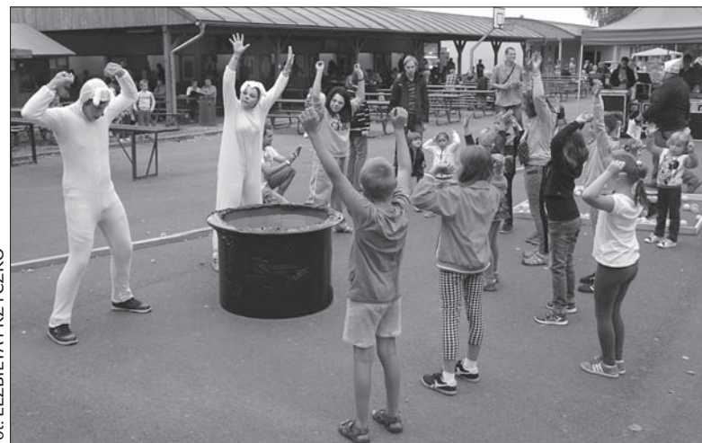
Jak zabawa, to dla całej rodziny! O najmłodszych uczestników Karnawału zadbał Klub Zabawy i Sportu Zaolzie.

Będzie jednak jeszcze okazja do spotkania z zaprzyjaźnionymi gminami. W Wędryni, w której ludzie faktycznie lubią się bawić, tego lata niemal w każdy weekend coś się dzieło. Koniec wakacji nie oznacza jednak zakończenia imprezowego sezonu. – Teraz szykujemy dużą imprezę: olimpiadę gmin partnerskich, która odbędzie się u nas 5 września. W nietypowych dyscyplinach na wesoło zmierzą się drużyny z Wędryni, Golezowa i Cziernego – powiedział naszej gazecie wójt Raszka. (ep)