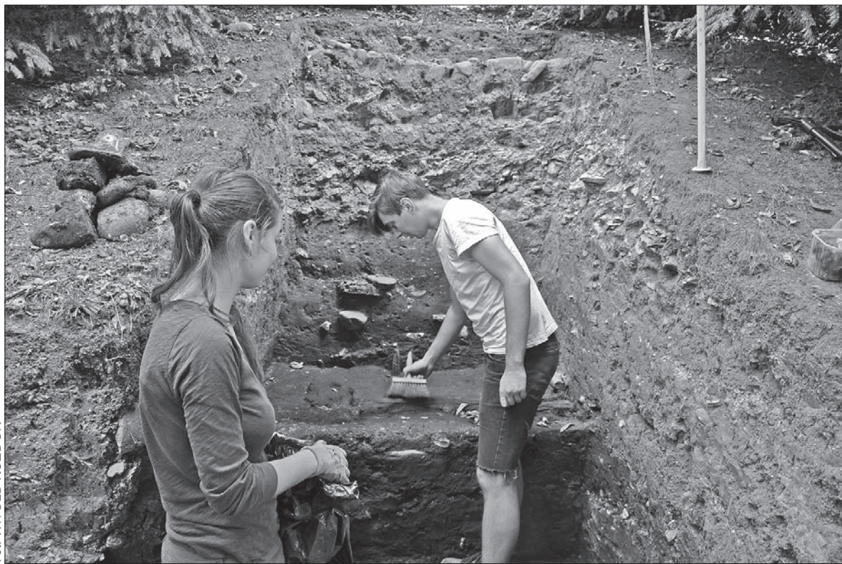
Archeologiczne badania potrwają na Wzgórzu Zamkowym do połowy września.

Odkrycie przypór to wielka sensacja. Na pierwsze dwie archeolodzy natknęli się przed dwoma laty. Kolejne dwie odkopali rok temu w styku nawy i absydy. – Tegoroczna jest więc piątą. Wykonaliśmy jeszcze jeden wykop od strony południowej, by sprawdzić, czy nie ma tam przypory numer sześć. Właśnie jesteśmy w trakcie pracy, ale już teraz odkry-