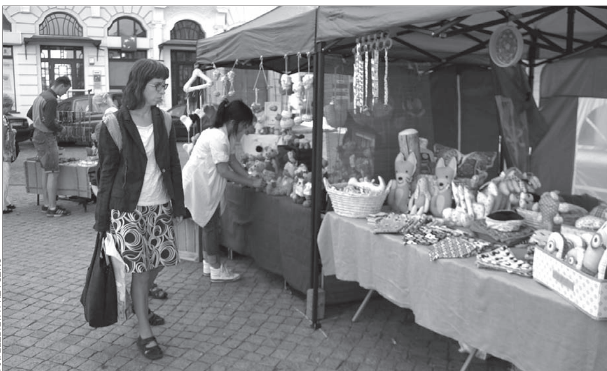
Na Jarmarku Piastowskim można było kupić wiele pięknych rzeczy, wszystkie zostały wykonane ręcznie.