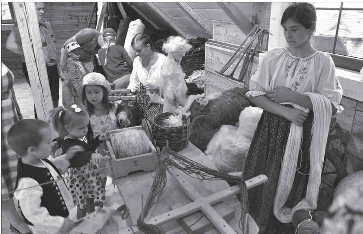
Podczas imprezy m.in. zaprezentowano tradycyjną obróbkę wełny.