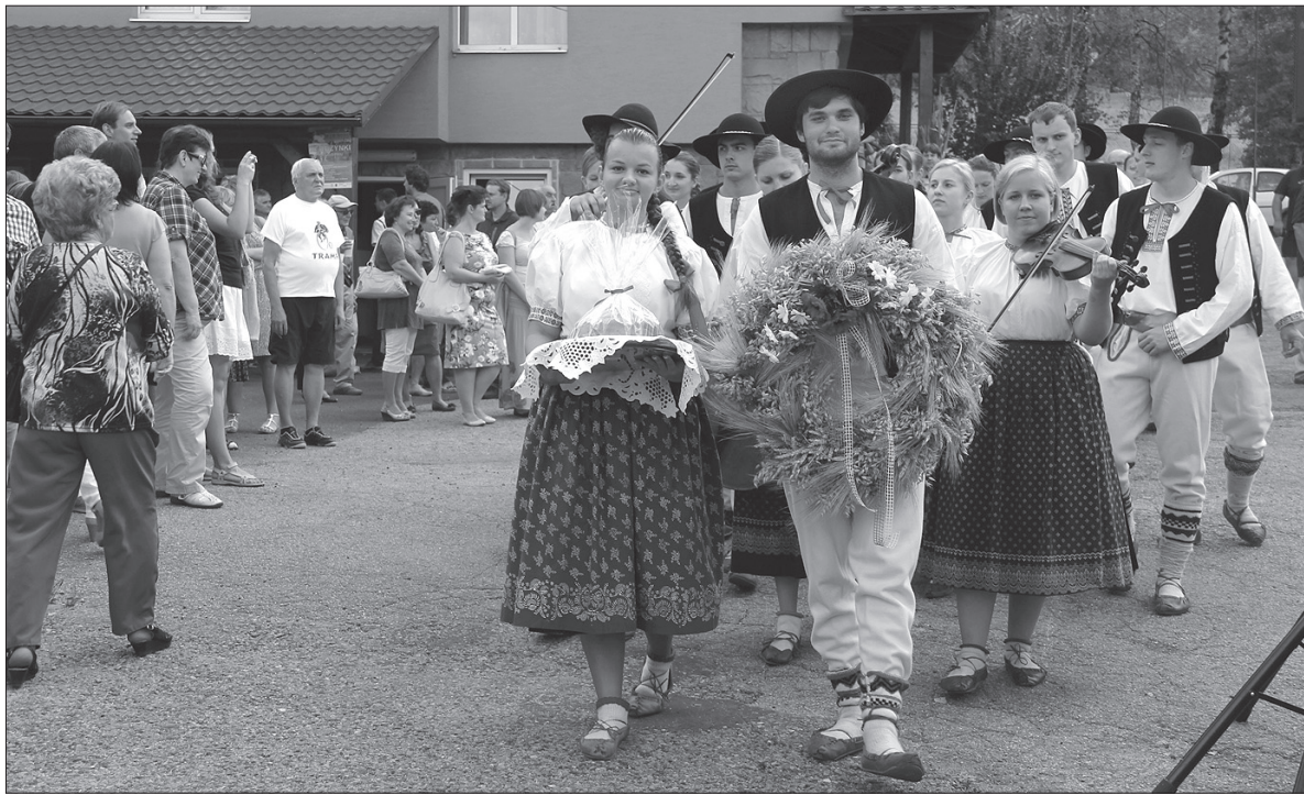
Dożynkowy wieniec przynieśli gospodarzom członkowie zespołu „Oldrzychowice”.

– Plon niesiemy, plon, gospodarzom w dom, co by dobrze plonowało, po sto korcy z kopy dało – śpiewali członkowie zespołu „Oldrzychowice”, przynosząc wieniec gospodarzom. Dożynkowi goście bawili się przed Domem PZKO, na scenie występowały zaproszone zespoły, a między stolikami krążyli