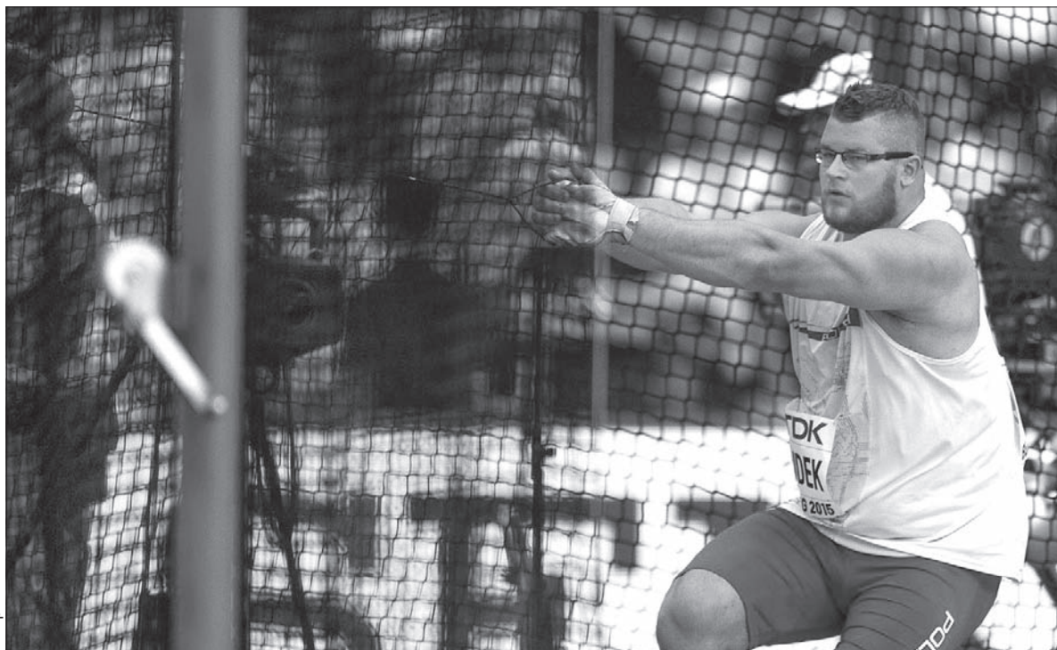
Paweł Fajdek obronił w Pekinie złoto w rywalizacji rzutu młotem.