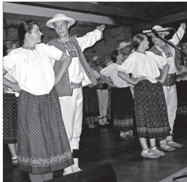
Zespół „Istebna” na scenie w Oldrzychowicach.

Bez wątpienia główną rolę w programie dożynkowym odegrał zespół „Oldrzychowice”, należący do najbardziej znanych zespołów folklorystycznych w naszym regionie. To on przedstawił obrządek dożynkowy i zatroszczył się o pierwszą