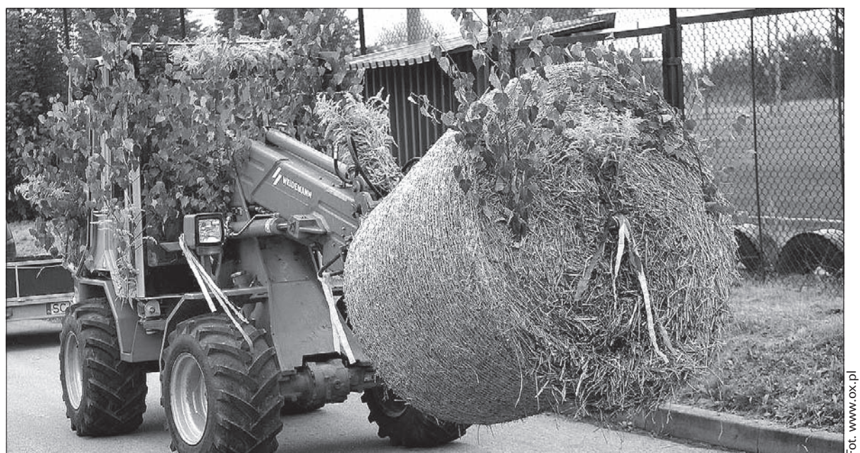
Kaczyce: Bez prezentacji sprzętu rolniczego nie mogą się obejść żadne dożynki.