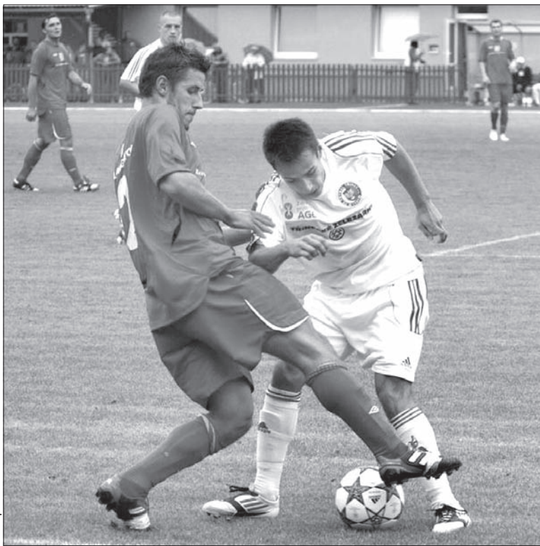
Trzyńczanie utrzymali fotel lidera 3. ligi.