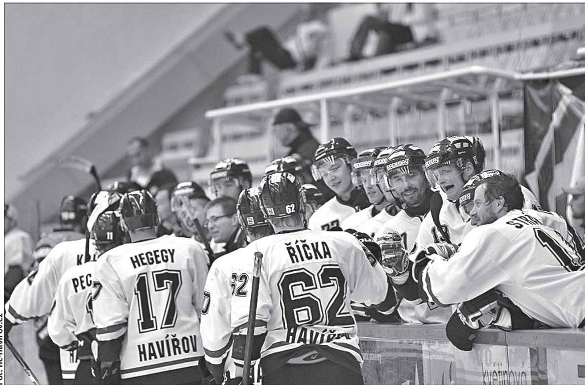
Forma hawierzowskich hokeistów robi wrażenie.