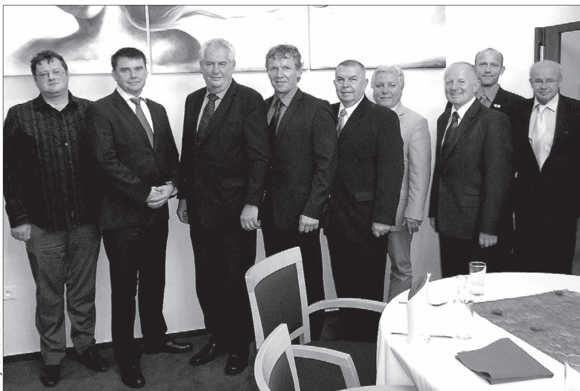
Z kandydatem na prezydenta Republiki Czeskiej, Milošem Zemanem (trzeci z lewej) spotkali się we wtorek w Stonawie również przedstawiciele polskiej mniejszości z Zaolzia.