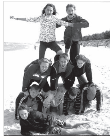
Dzieci od razu pobiegły na plażę.