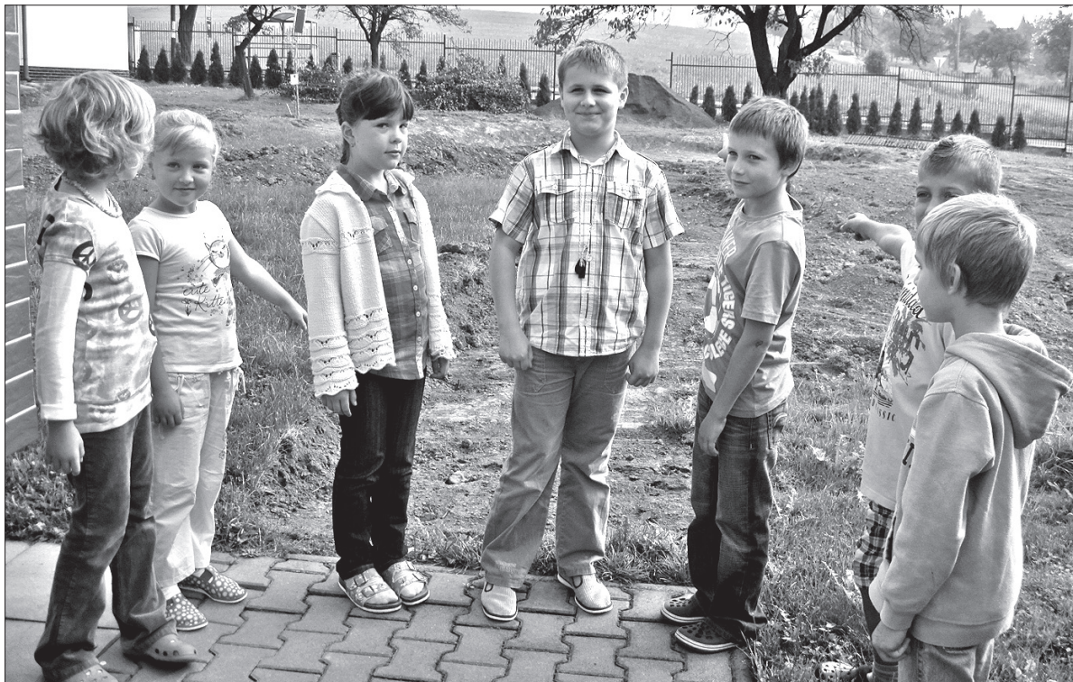
Tu będzie „zielona klasa”! – pokazują uczniowie węgryńskiej podstawówki.

Jak podkreśla pani dyrektor, do realizacji tego zadania włączyli się z