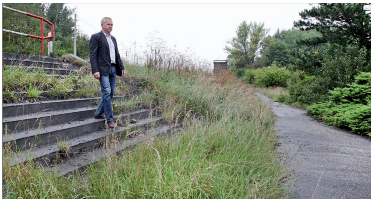
Z Gimnazjum Polskiego w Orłowej-Łazach ostały się tylko schody i bieżnia.