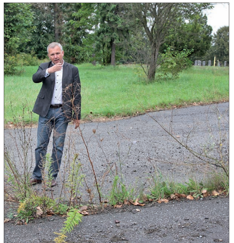
Tu, koło kopalni „Henryk”, stała gospoda U Altmana, w niej spotykaliśmy się dwa razy w tygodniu na próbach „Górnika”.