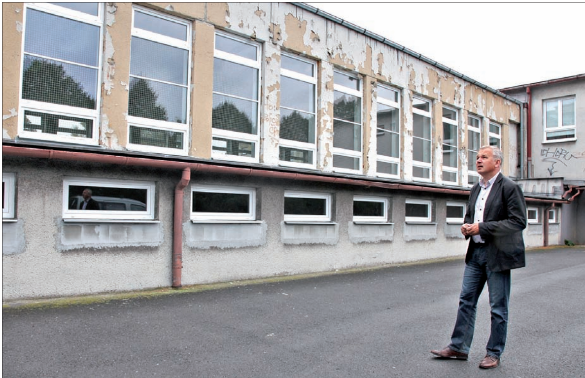
Sala gimnastyczna byłej PSP w Karwinie-Nowym Mieście wyraźnie marnieje.