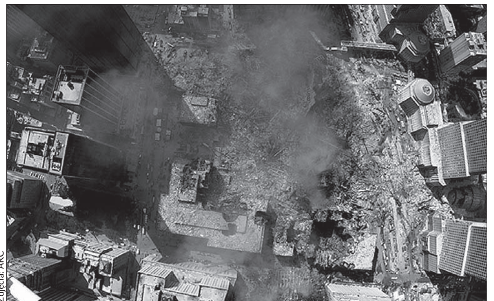
Dymiące ruiny WTC.