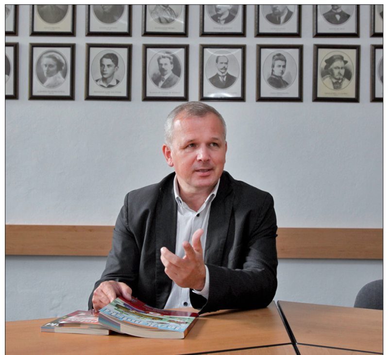
Te podręczniki z Polski udało się zakupić dla szkół dzięki dotacji z czeskiego resortu szkolnictwa.