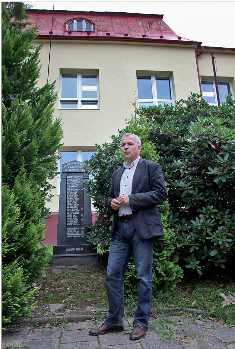
Te ofiary I wojny światowej z Błędowic zasługują na pamięć.

– Była to klasyczna szkoła wiejska, w której wszyscy się znali, a która była centrum polskiego życia społecznego w Błędowicach. Wspaniale współpra-