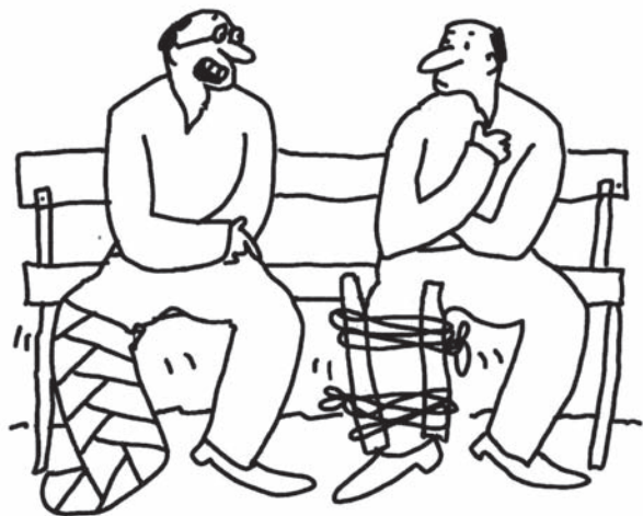
Ja musiałem zapłacić za nadstandard!