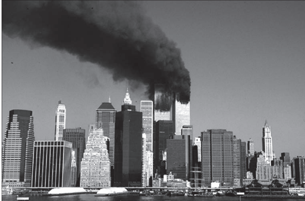
Apokalipsa w sercu Nowego Jorku.