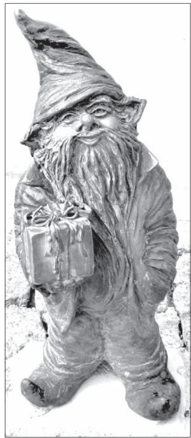
Krasnale wpisali się w krajobraz Wrocławia.

Pod koniec sierpnia MK PZKO w Ligotce Kameralnej zaprosiło nas na wycieczkę. Dzięki dotacji finansowej z gminy Ligotka Kameralna na autobus, mogliśmy pojechać trochę dalej, tym razem aż do Wrocławia. Takiej okazji się nie odrzuca, więc wyruszyliśmy. Jednym z interesujących miejsc, koło którego przejeżdżaliśmy, było jedno z najstarszych śląskich miast – Racibórz, znany z fabryki cukierniczej „Mieszko”. Równocześnie dowiedzieliśmy się, że jest to jedno z miast z najniższym wskaźnikiem bezrobocia. Mogliśmy też z ciekawością obejrzeć dwujęzyczne tablice miejscowości, polsko-niemieckie. O tym, że zbliżamy się do celu, informował nas widok na najwyższy budynek w Polsce – Sky Tower, wznoszący się na wysokość 212 m. Wreszcie dotarliśmy do celu. Wrocław, leżący nad Odrą i jej czeremra dopływami, z tego powodu często nazywany jest Wenecją Północy. Plasuje się na czwartej pozycji w Europie pod względem liczby mostów. Wyprzedzają go tylko Amsterdam, Wenecja i Petersburg. Wrocław jest też czwartym miastem pod względem liczby ludności w Polsce, w stolicy Dolnego Śląska mieszka