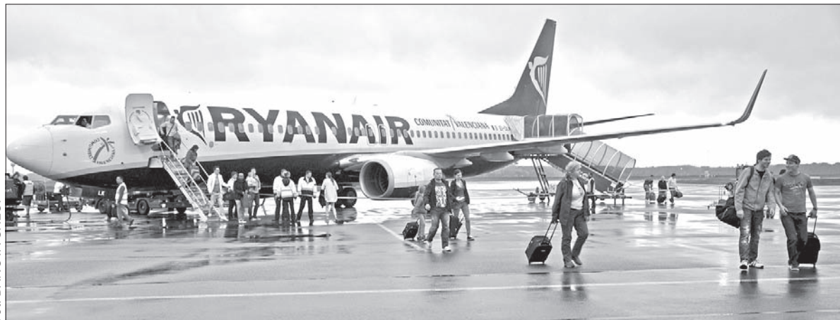
Lotnisko Leoša Janáčka w Mosznowie.

kańców Śląska Cieszyńskiego. Z Czeskiego Cieszyna można dojechać do Sedlnic za ok. półtorej godziny. Trzeba się jednak liczyć z przesiadkami – w Studence, ewentualnie też w Ostrawie-Swinowie. (dc)