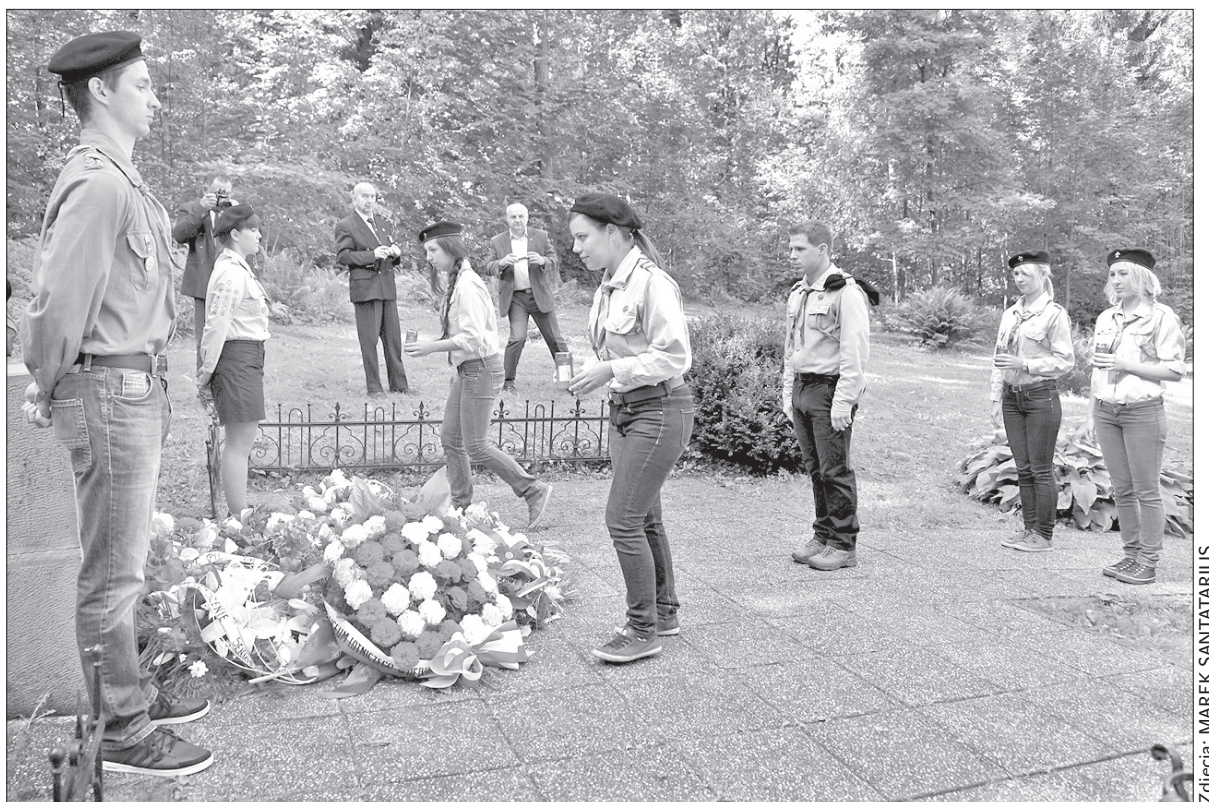
Wieniec złożyły m.in. delegacje z różnych szkół.

Właściwe obchody 81. rocznicy tragedii polskich bohaterów przestworzy zaplanowane są na jutro. – Na 11 września przygotowujemy dzień otwartych drzwi. Zapraszamy wszystkich zainteresowanych do zwiedzenia izby pamięci, złożenia kwiatów. W Domu Polskim Żwirki i Wigury będziemy od godz. 10.00 do 19.00, a o 16.00 odbędzie się msza w intencji ofiar katastrofy z 1932 roku. Po nabożeństwie zapraszamy do Domu Polskiego na kawę lub herbatę. Przyjedzie wielu sympatyków lotnictwa i weteranów – dodał Smugała. (ep)