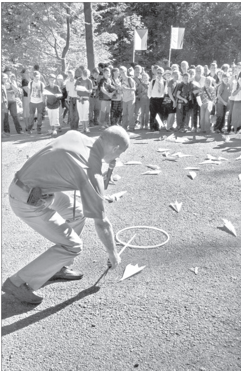
Na imprezie nie zabrakło także gier i zabaw.