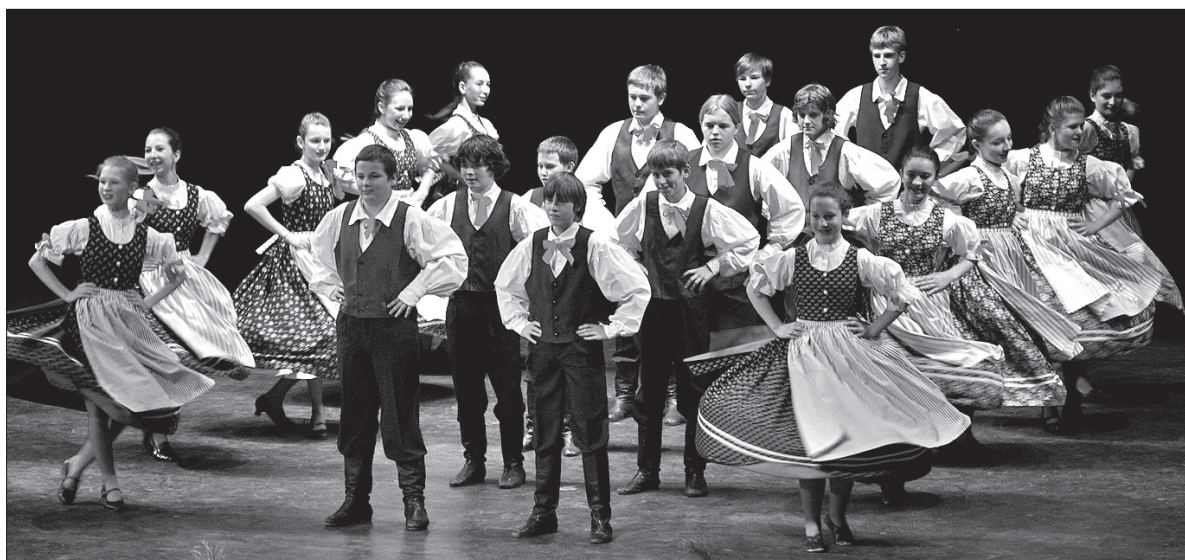
Zespół „Błędowice” przygotowuje się do premiery nowego przedstawienia.