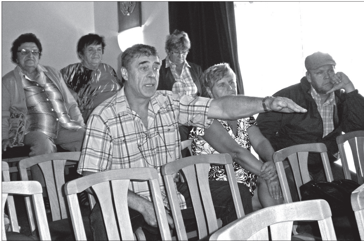
Mieszkańcy Ciyrnego przekonywali radnych, by pozwolili im „odejść”.

Burmistrz Petr Sagitarius musiał przyznać, że przez ostatnie lata w Ciyrnem nie zrealizowano praktycznie żadnych inwestycji. Obiecał natomiast, że już jesienią zostanie naprawiona droga łącząca Ciyrne z Jabłonkowem, której stan jest katastrofalny. – Jestem gotów dyskutować z wami o możliwościach inwestycyjnych, ale nigdy nie podniosę ręki, by głosować za oderwaniem tej części od Jabłonkowa – podkreślił burmistrz.