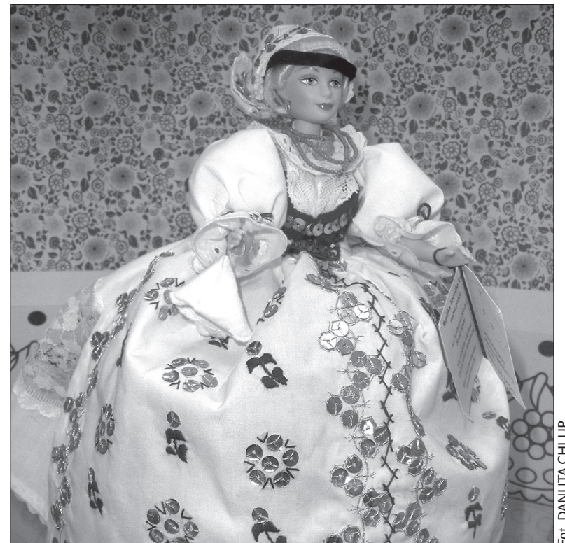
Barbie w stroju z okolic Tabora.

Wystawę można zwiedzać od wtorku do piątku w godz. 9.00–17.00 i w niedzielę w godz. 13.00–17.00. (dc)