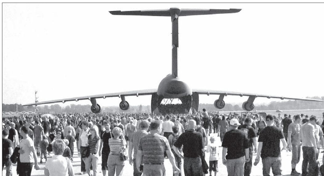
Dni NATO co roku przyciągają tłumy.