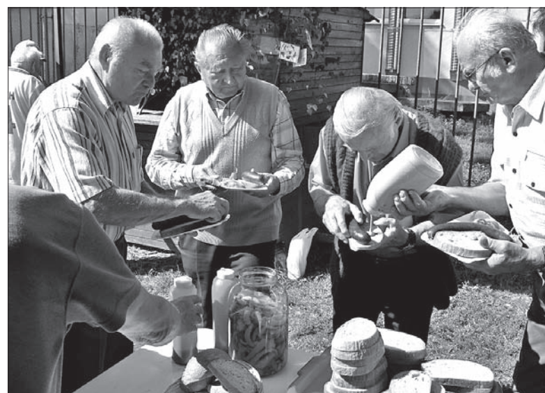
Kielbaski z wędzarni miały wzięcie.

Zabawę, podczas której uciechy było nie mniej niż w latach minionych podczas piłkarskich harców, poprzedziło tradycyjne, wspólne odśpiewanie pieśni „Przyjaźń, o bracia”.