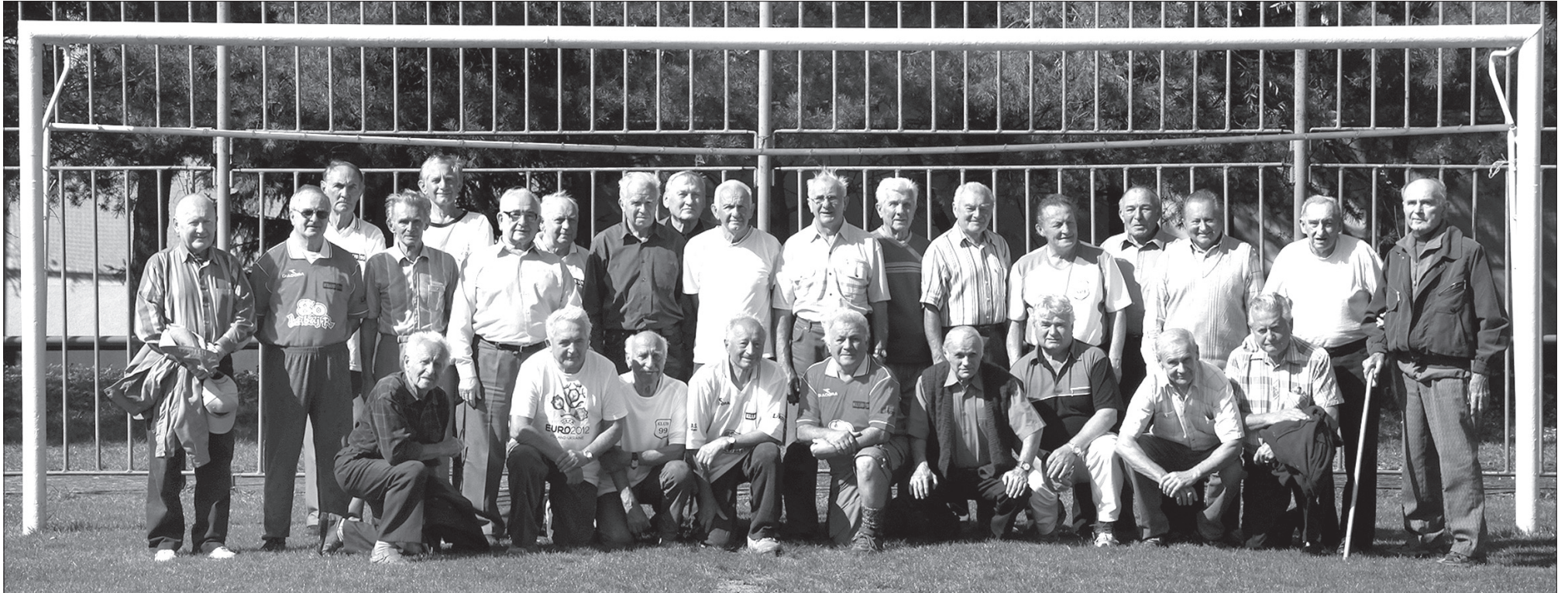
Wspólne zdjęcie Klubu 99 i jego sympatyków na zakończenie poniedziałkowego spotkania na olbrachickim boisku.

Kiedy 13 lat temu kilkunastoosobowa grupa członków byłych polskich klubów piłkarskich, które w okresie przedwojennym i w pierwszych siedmiu latach po wyzwoleniu współtworzyły historię polskiego sportu