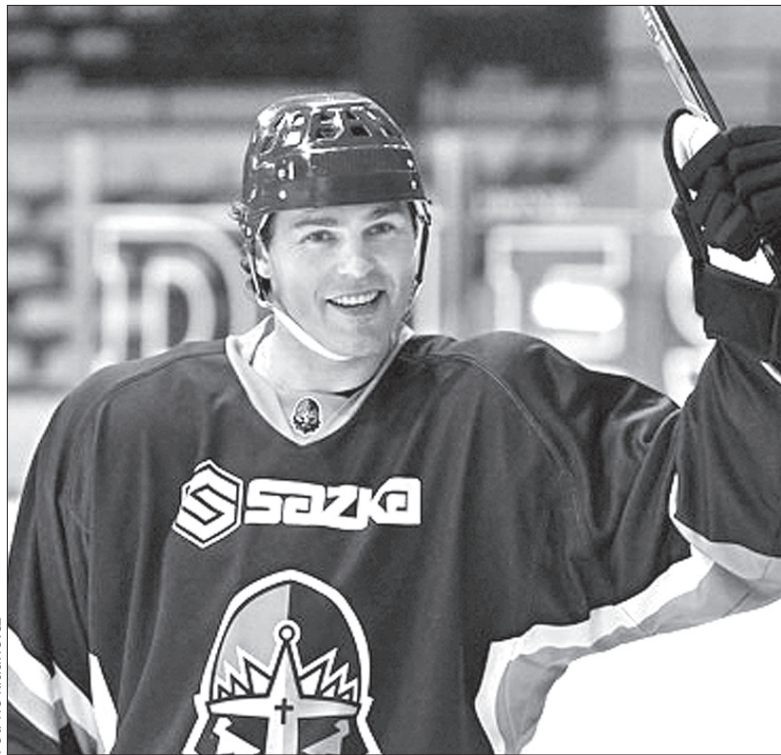
Jaromír Jágr w barwach Kladna.