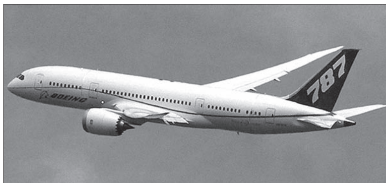
Boeing 787 Dreamliner

Polski przewoźnik zamówił w sumie osiem egzemplarzy nowego samolotu, który wyposażony jest m.in. w większe okna, szerokie i wygodne fotele, system redukcji turbulencji i inne udogodnienia. Stąd bierze się jego nazwa, która w tłumaczeniu oznacza „linowca marzeń”. PLL LOT mogą się w tych dniach pochwalić również innym osiągnięciem – prestiżowy brytyjski magazyn „Business Traveller” po raz piątnasty przyznał im nagrodę w kategorii najlepszej linii lotniczej Europy Środkowo-Wschodniej. (dc)