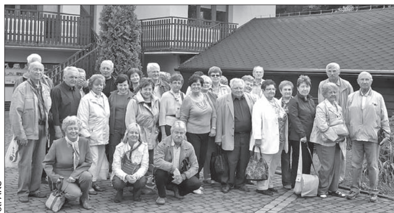
Seniorzy z Karwiny na wycieczce w Beskidach.