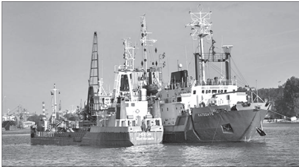
Gdynia zawdzięcza port Józefowi Kiedroniowi.