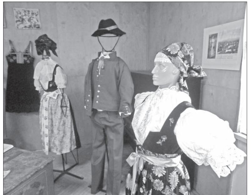
... a potem przyszedł czas na jej zwiedzanie.

Kadłubiec. – Pokazuje zaś ta wystawa najróżniejsze oblicza Cieszyna i Ziemi Cieszyńskiej. Na uwagę zasługują, na przykład, wspaniałe druki z wydawnictwa Feitzingera, które bardzo się zasłużyło w kwestii szerzenia oświaty nad Olzą. Dzięki temu ten region był kiedyś najbardziej rozczynanym w tej części Europy. Przepiękne są stroje cieszyńskie – dodał znany językoznawca i etnograf.