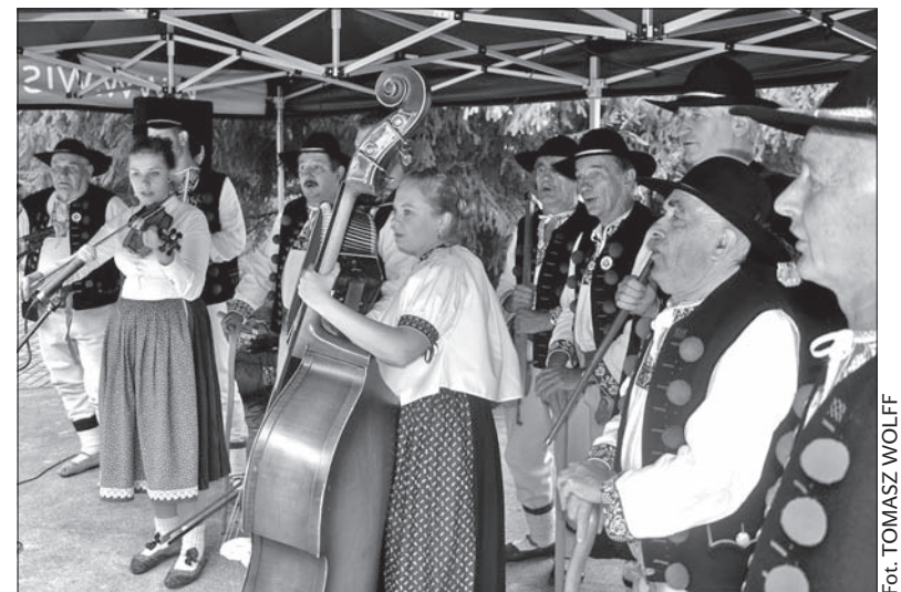
Podczas Zjazdu Wisielków nie zabrakło muzycznych akcentów.

Podczas zjazdu można było skosztować wiślańskiej kuchni oraz wysłuchać regionalnych kapel. (wot)