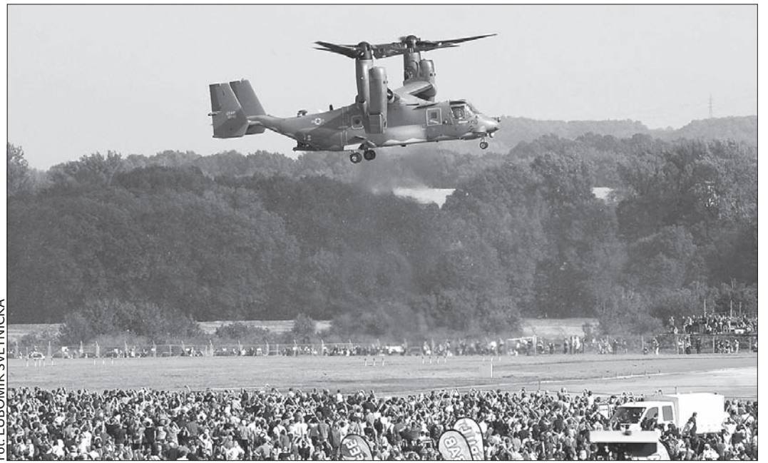
Amerykański konwertoplan był największą atrakcją Dni NATO.

ny został transport kolejowy. Na stacji w Studence, położonej najbliżej lotniska, zatrzymywały się dodatkowe pociągi. (dc)