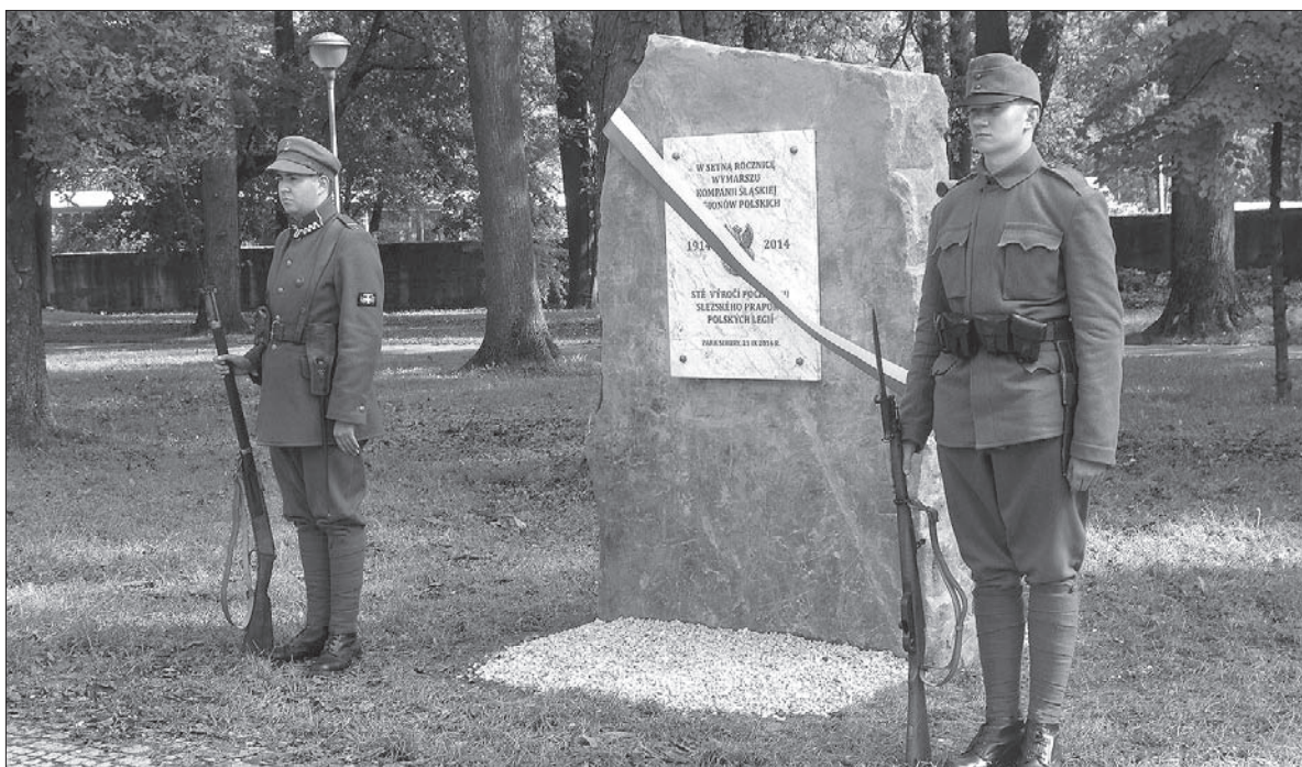
Wymarsz Legionu Śląskiego z Parku Adama Sikory (dziś w Czeskim Cieszynie) upamiętnia odsłonięta w niedzielę tablica.