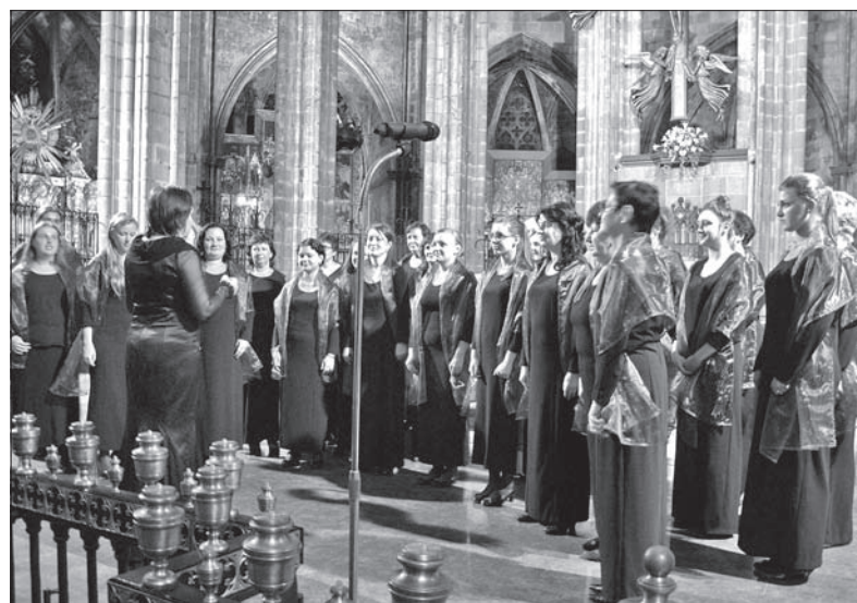
„Melodia” podczas występu w katedrze pw. św. Eulalii w Barcelonie.