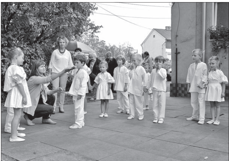
Z programem ludowym „Na pasiónku” wystąpiły dzieci z polskiego przedszkola w Sibicy.

W ogrodzie Domu PZKO do późnego wieczora bawili się nie tylko sibiczanie oraz goście z Jasienicy, przybyli także członkowie okolicznych kół PZKO, w tym z Lesznej Dolnej. (ep)