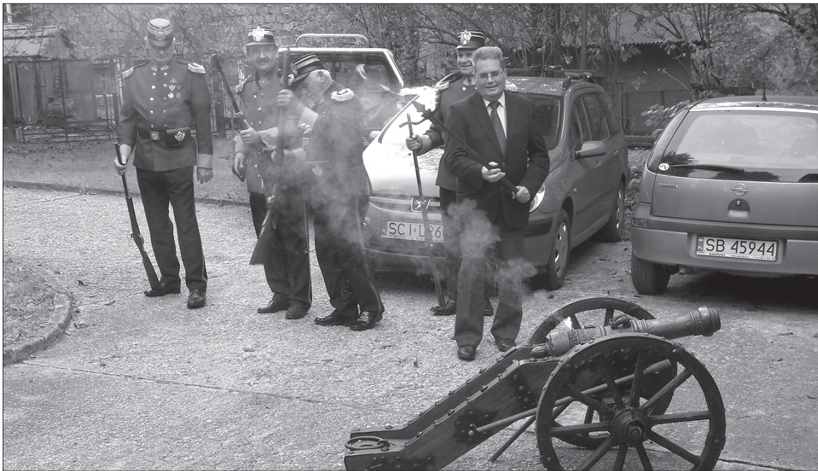
Najpierw było wystrzałowe otwarcie imprezy...