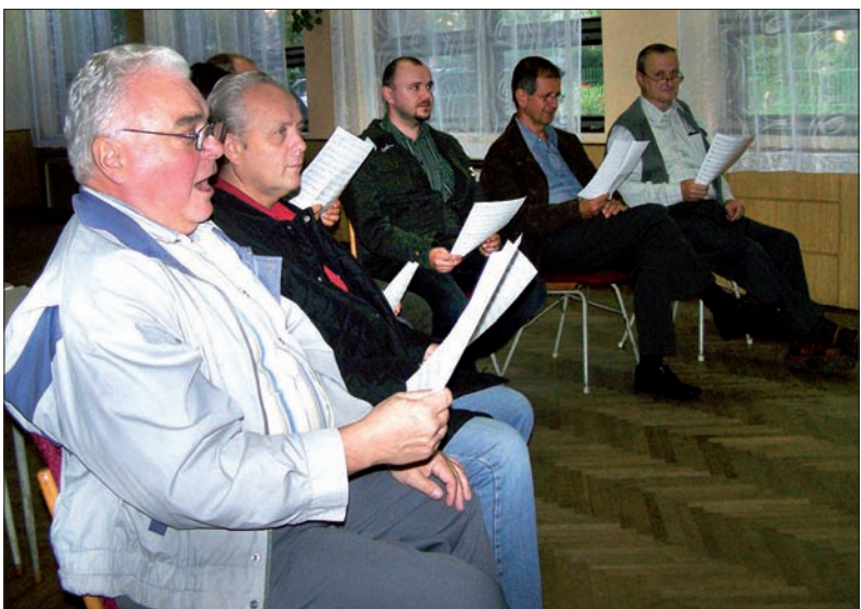
Mały męski zespół wokalny na próbie.

– To odmłodzenie Koła na pewno nam pomoże – kontynuuje prezes. – My, starsi, przywykliśmy do tradycyjnych form pracy PZKO-wskiej, co nie zawsze już odpowiada młodszemu. Ale to nie oznacza, że „starszacy” chcieliby złożyć broń. Nadal organizujemy też swoje imprezy.