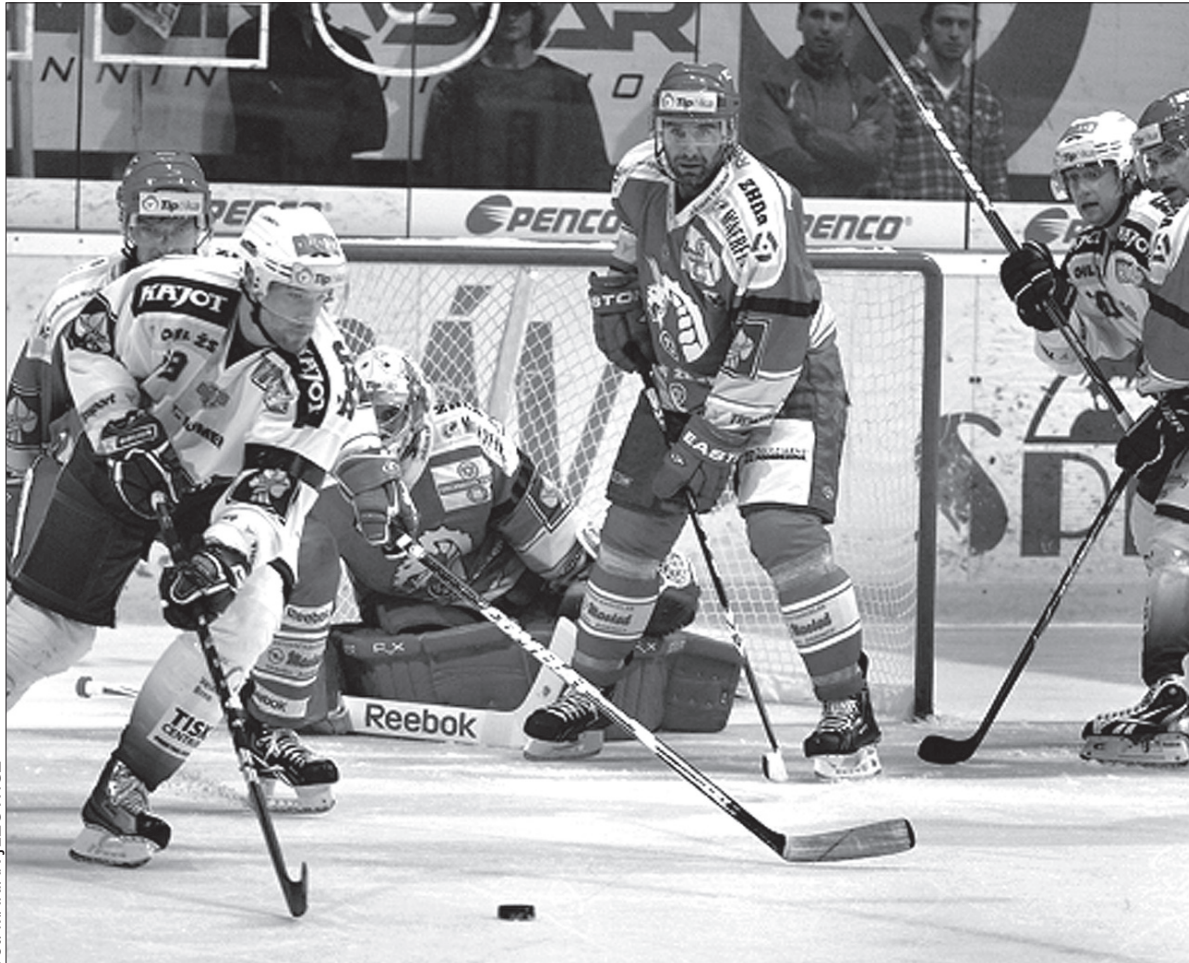
Przed trzyńciecką bramką kotłowało się rzadko, ale za to jak skutecznie.