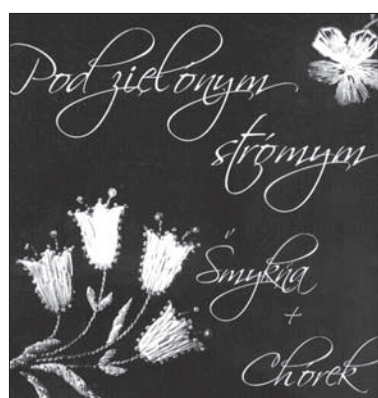
Okładka muzycznego wydawnictwa.

Płyta została nagrana w ostrawskim studio w kwietniu br. w nakładzie 500 egzemplarzy. (sch)