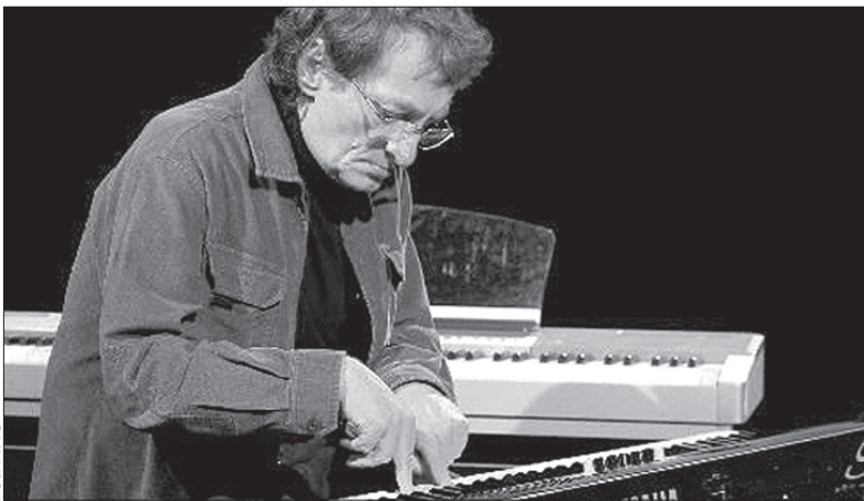
Marián Varga porwał publiczność w Karwinie.

Festiwal Muzyki Organowej „Karwińskie organy” dobiegł końca. W niedzielę frysztacki kościół parafialny pw. Podwyższenia Krzyża Świętego wypełnił się do ostatniego miejsca. Na koncert legendy (czesko-słowackiego rocka, kompozytora i instrumentalisty klawiszowego, Mariána Vargi, przybyli słuchacze wszystkich pokoleń. Artysta zaprezentował bardzo bogaty repertuar, na który złożyły się jego własne utwory, niektóre inspirowane melodiami klasyków muzyki poważnej („Wspomnienie o Vivaldim”, J.S. Bach), a nawet słowackim folklorem