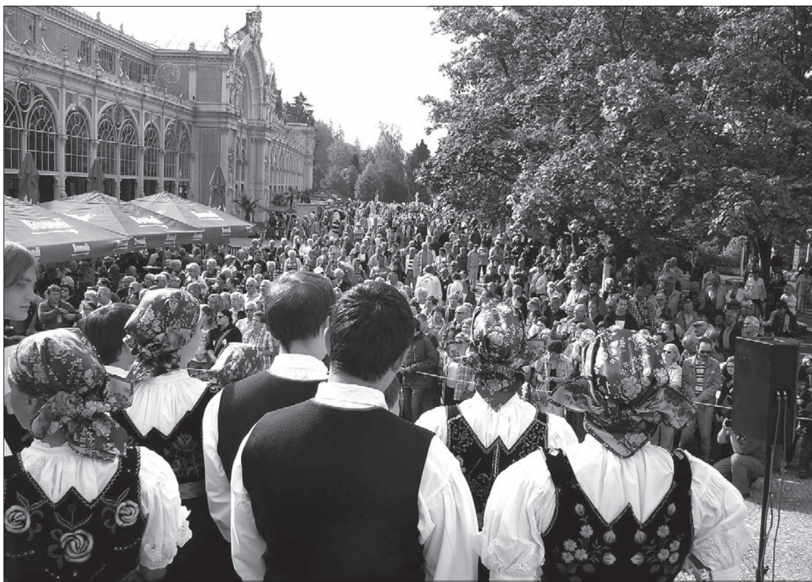
Oficjalne powitanie zespołów w uzdrowsku.

Podczas pobytu w Mariańskich Łaźniach wzbudzaliśmy wielkie zainteresowanie. Widzowie byli zachwyceni dla nich mało znanymi