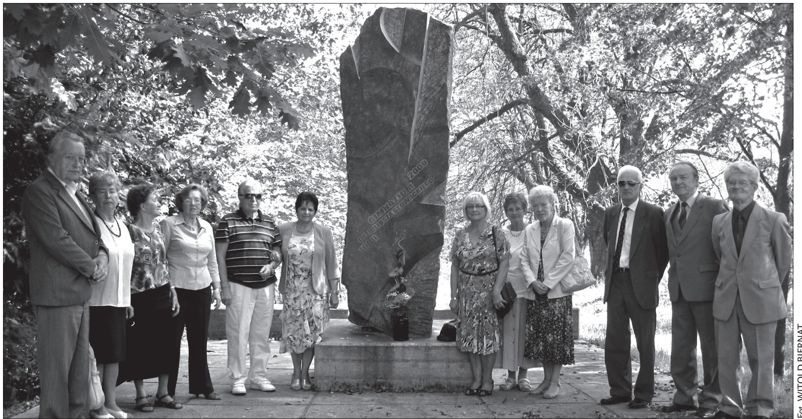
Absolwenci gimnazjum z 1956 r. przed pomnikiem nieistniejącej już placówki.