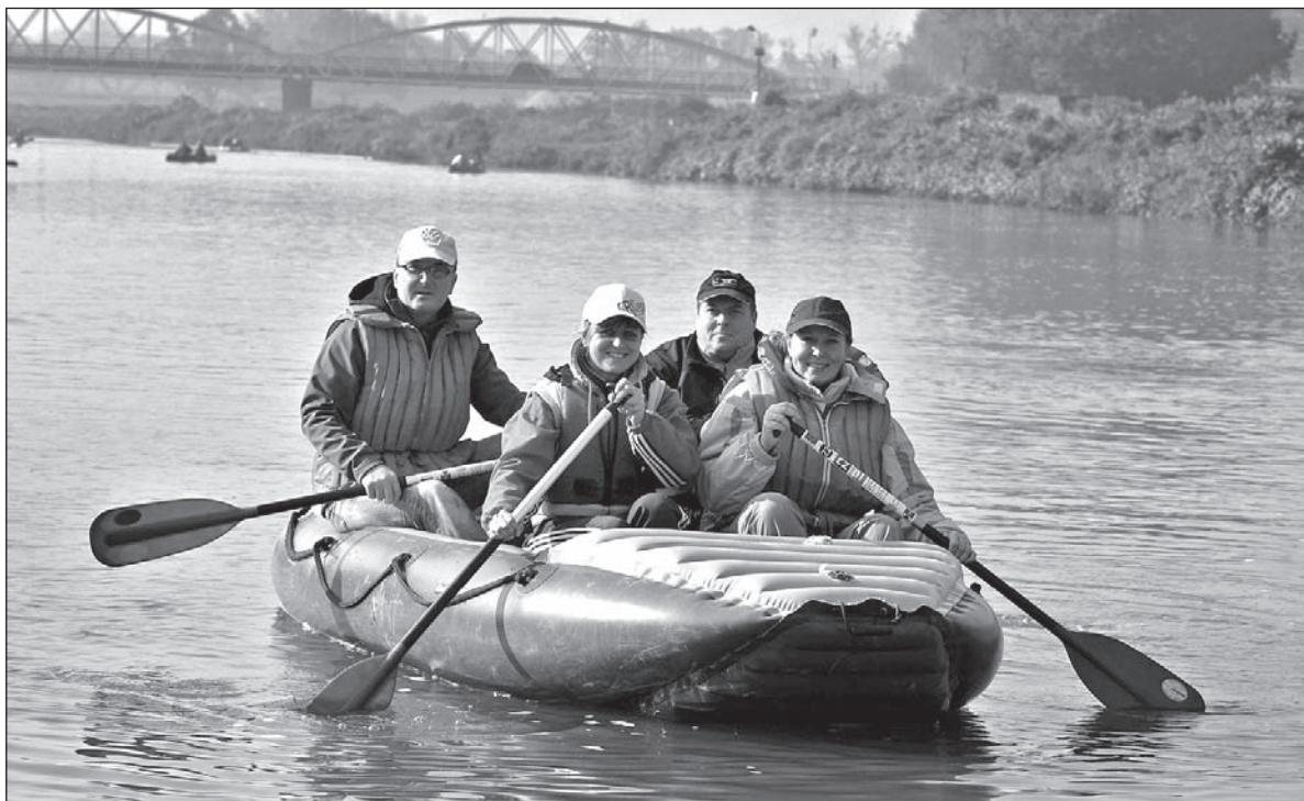
W sobotę wodniacy po raz ostatni wypłyną na Odrę.

Zamykanie meandrów Odry rozpocznie się koło Kładki Antoszowickiej w Boguminie-Pudłowie o godz. 10.00. Nim wodniacy wypłyną na swych łodziach, „ochrzczą” wodą z Odry nowe schody ułatwiające wejście do wody. Maskotką imprezy będzie lalka Odra, posiadająca własny akt urodzenia, która powstała w bogumińskim stowarzyszeniu „Maryska” w ramach akcji „Szyjemy lalki dla UNICEF”. Po przepłynięciu 2,5 kilometrów wodniacy zatrzymają się za starym mostem granicznym, gdzie