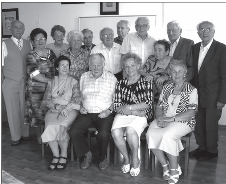
Zdjęcie z tegorocznego spotkania jubileuszowego.