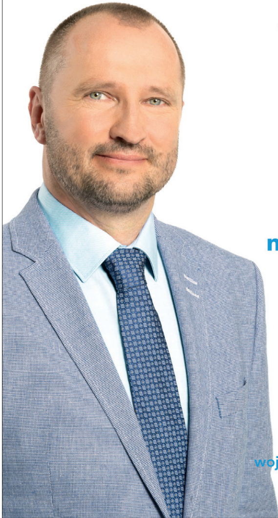
Jakub Unucka kandydat na wojewodę województwa Morawsko-Śląskiego

W wyborach 7 i 8 października mamy szansę wywrzeć wpływ na przyszłość naszego województwa. Chodźmy ją wspólnie wykorzystać!