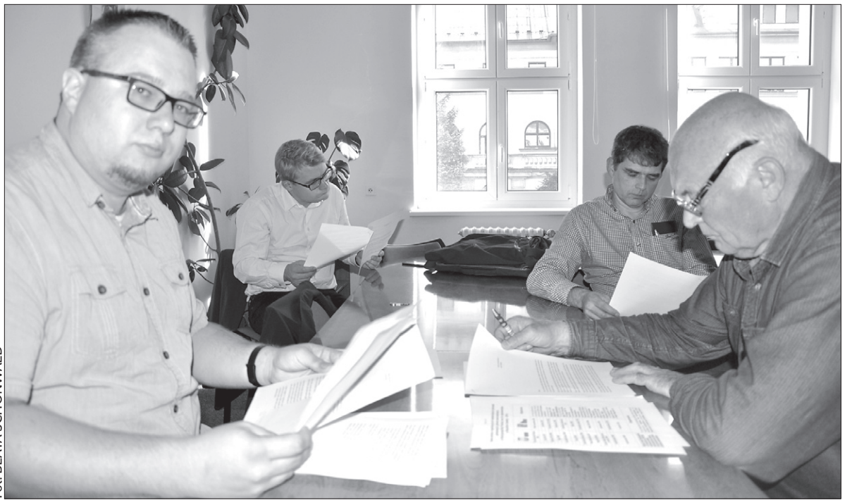
Komisja Praw Mniejszości omawiała treść listu do zaolziańskich gmin.

W programie czwartkowego spotkania było przygotowanie listu, który ma na celu zorientowanie się, w jakim stopniu są realizowane prawa do dwujęzyczności w gminach zaolziańskich. W piśmie, które po zatwierdzeniu przez Radę Kongresu Polaków ma zostać wysłane do 31 gmin na Zaolziu, zostały zawarte pytania o istnienie i skład narodowościowy gminnej Kom-