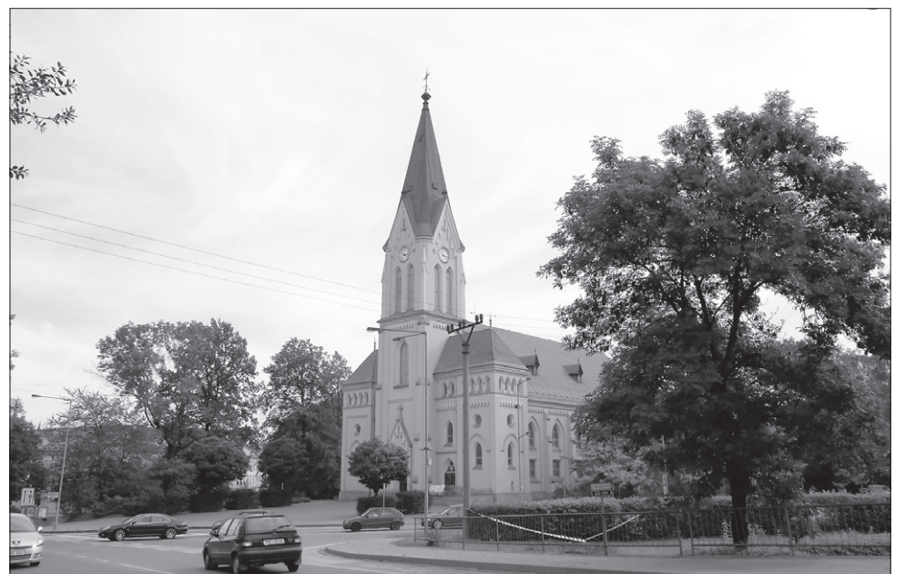
Po lewej kościół ewangelicki w Trzcinicy na fotografii autorstwa Karola Kalety z lat 30. XX. wieku. Po prawej to samo miejsce na współczesnym ujęciu Norberta Dąbkowskiego.