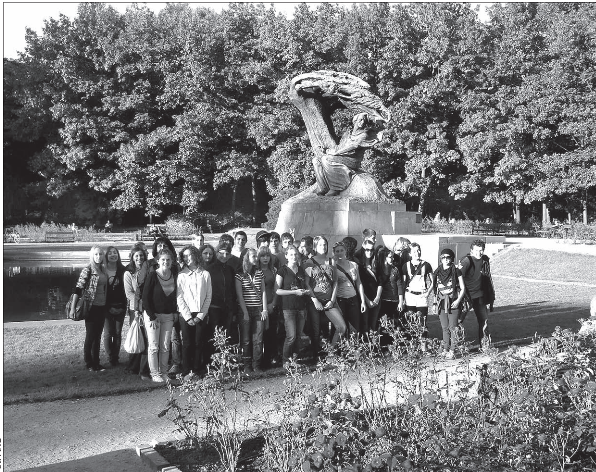
Uczestnicy wycieczki dla najlepszych absolwentów zaolziańskich polskich szkół podstawowych pod pomnikiem Fryderyka Chopina w warszawskich Łazienkach.