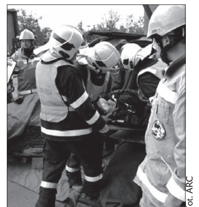
Trzyńieccy strażacy wyciągają „rannego”.