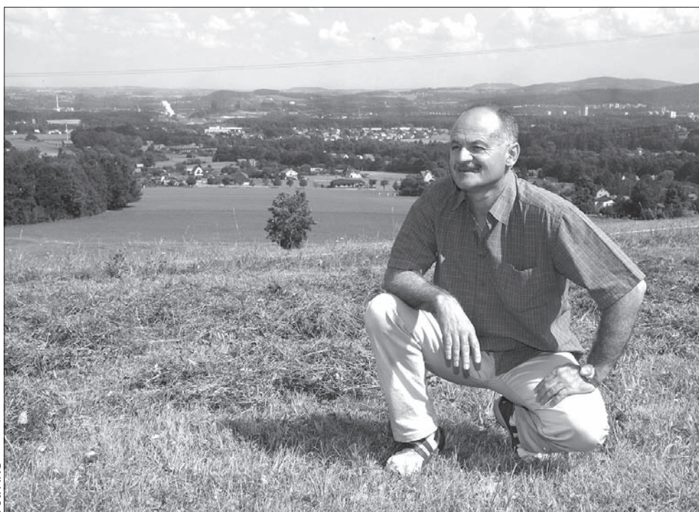
Petr Gawlas kocha swój rodzinny kraj.

Senat na pewno nie jest Izbą zbędną. Brak zaufania wobec Senatu to czasami wynik złej pracy senatorów, którzy za mało interesują się regionem, w którym zostali wybrani. Zdarza się, że za mało angażują się w pracę Senatu,