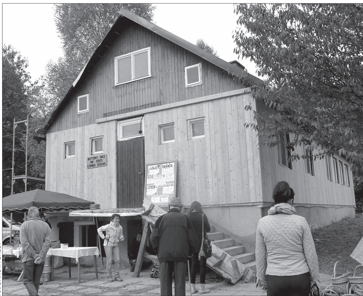
Dom PZKO w Łomnej Dolnej właśnie jest w remoncie.

Prace rozpoczęły się pod koniec sierpnia. Efekty już widać, mogli je zauważyć m.in. uczestnicy Jarmarku Jesiennego, który odbył się w sobotę w Łomnej. Dom PZKO ma odnowione okna, na połowie dachu jest nowe pokrycie, elewacja została ocieplona watą mineralną i w większej części obłożona drewnem. – To modrzew. Celowo wybraliśmy taki gatunek, bo ma bardzo dobre właściwości, nie trzeba go malować. W naturalny sposób szczerwieje i bardzo ładnie to wygląda – tłumaczył prezes.