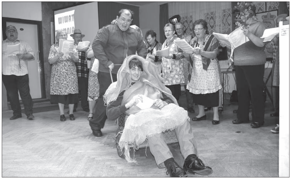
Kampania wyborcza Ziemniaka – kandydata na króla.