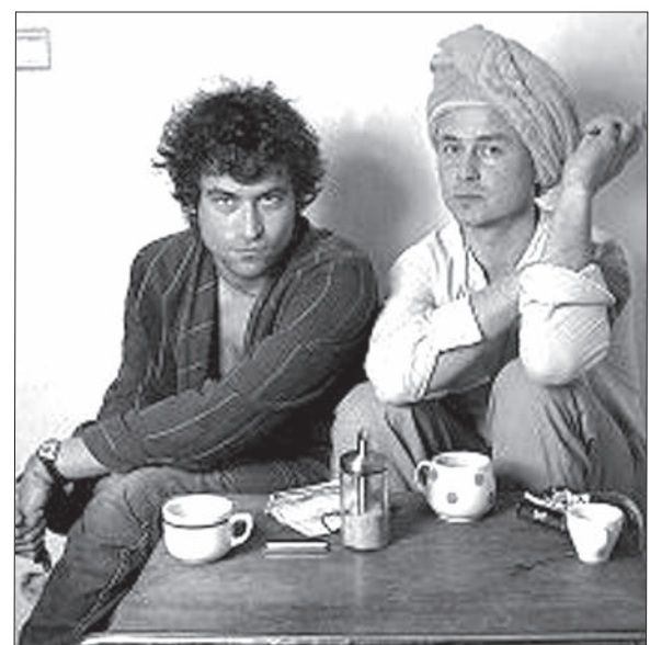
Jedno ze zdjęć z wystawy duetu Zorka Project: „Przeciętni. Czesi i Polacy”.

Wernisaż wystawy poprowadzi 7 października znany publicysta i pisarz Mariusz Szczygieł. (kor)