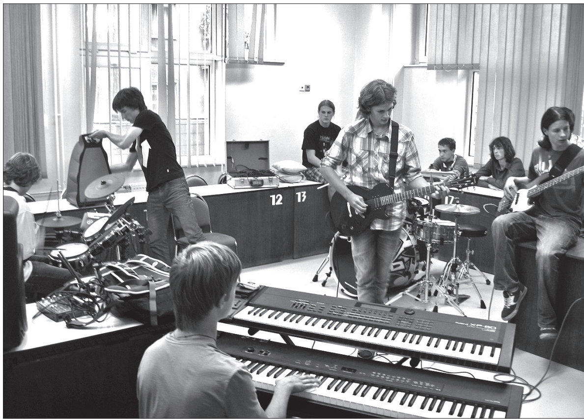
Gimnazjalny Jam Stage.

Po przebyciu maratonu trzeba się posilić. Z pomocą pospieszyli więc pomysłodawcy kolejnego projektu, tym razem kulinarnego. Jego głównym bohaterem był ziemniak, który na przeróżne sposoby opracowywany był przez trzy zespoły gimnazjalistów w wypożyczonych na tę okazję od podstawówki kuchni. – Przygotowujemy tradycyjną po-