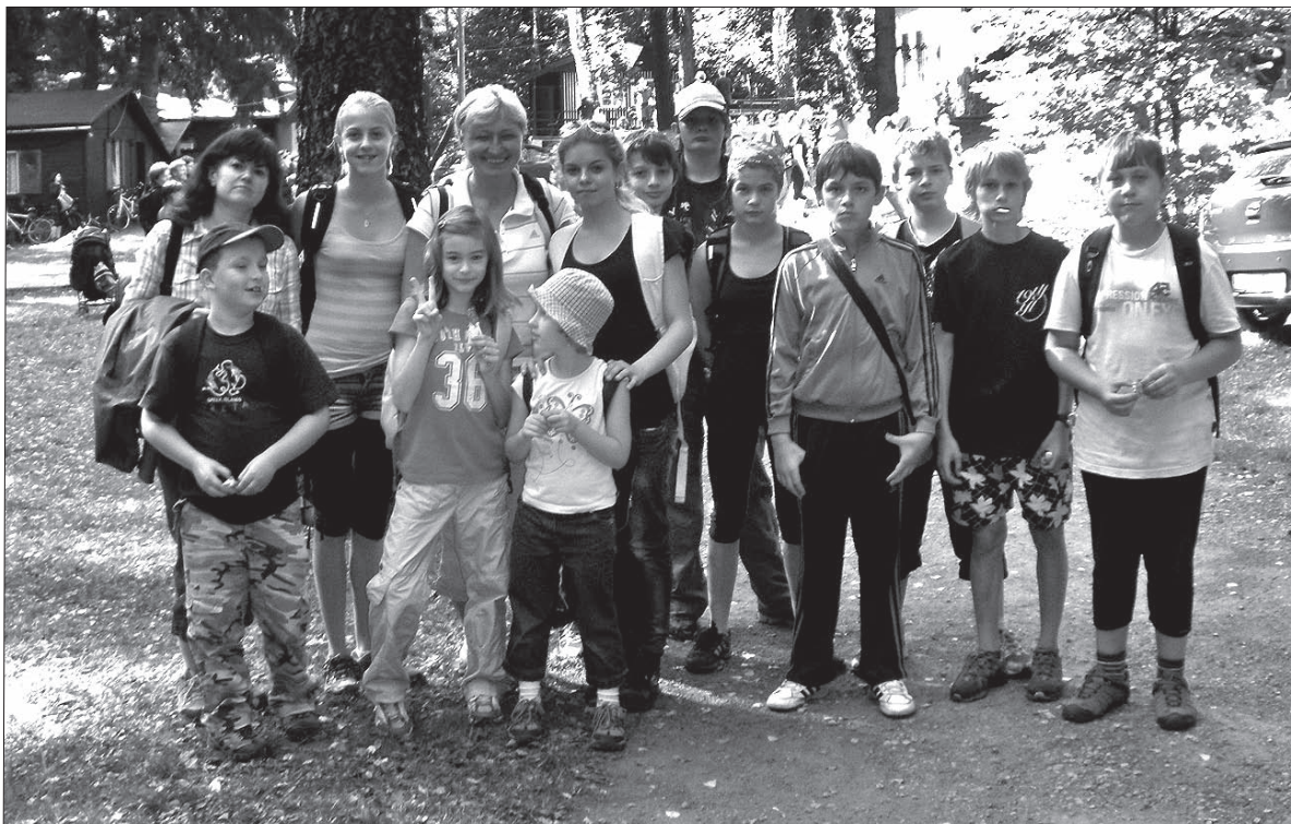
Drużyna trzyniecka wracała z Pasieczek w dobrym humorze. W kategorii szkół pełnych zajęła pierwsze miejsce.