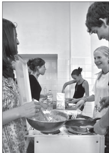
W kuchni królował ziemniak.