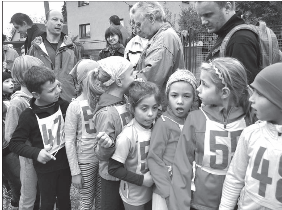
Krzężanina na starcie najmłodszej kategorii.