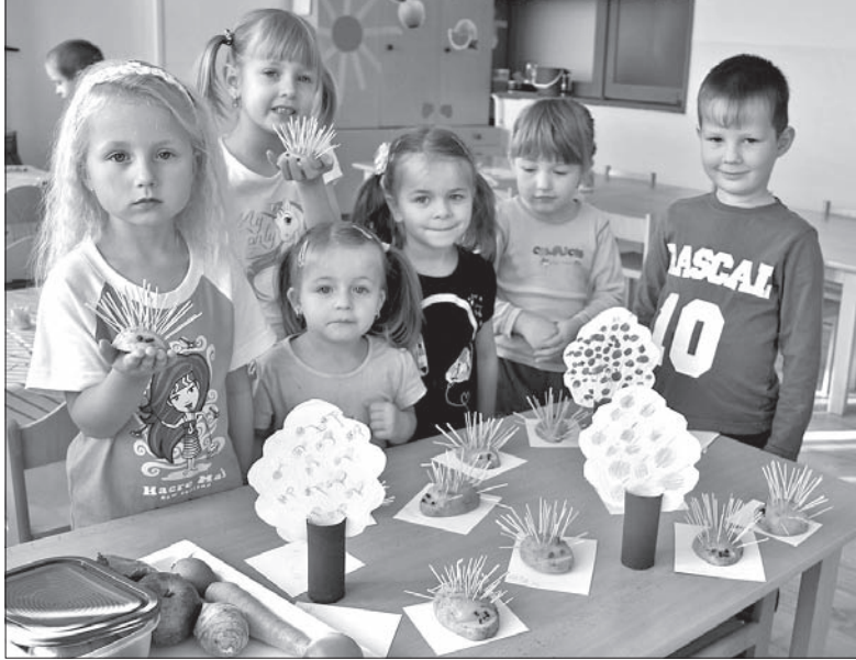
Przedszkolaki z Ropic i ich jesiennie prace.

Właśnie trwa tu „tydzień warzyw”. We wtorek dzieci robiły na przykład języki z ziemniaków. Ich wykonanie jest bardzo proste: wystarczy przekrojony wzdłuż ziemniak z odkrojonym od góry kawałeczkiem na jednym końcu. Do ziemniaka wbijcie wykałaczkę, a do wykrojonej dziurki – oczka i noski z suszonych goździków. I gotowe! Pannie przygotowały dla przedszkolaków także wiele innych zabaw i ciekawych zajęć o tematyce jesiennych.