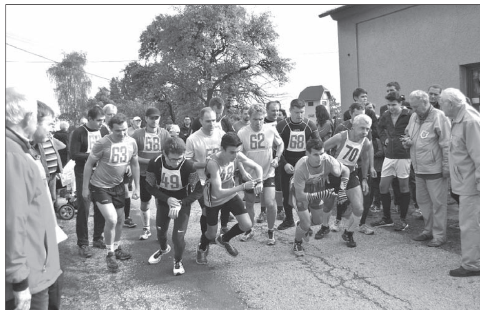
Początek biegu w wykonaniu dorosłych zawodników.