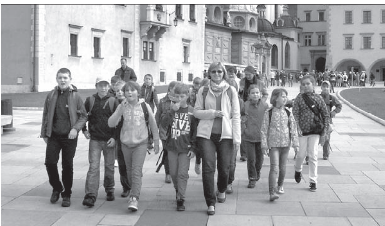
Uczniowie z Czeskiego Cieszyna na wycieczce edukacyjnej.

słali nam relację z wycieczki edukacyjnej do Krakowa, Wieliczki i Zakopanego.