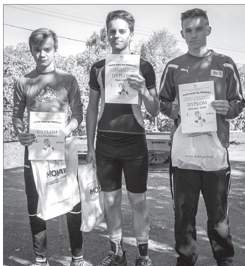
Zwycięcy biegu przełajowego w kategorii 14-15 lat chłopcy.