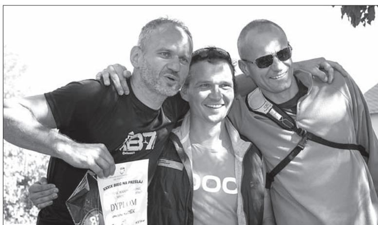
Zwycięcy biegu w kategorii 36-49 lat mężczyźni.