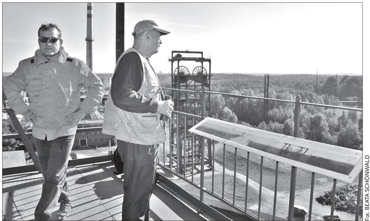
Nowsza wieża wyciągowa z lat 50. ub. wieku również należy do zabytków techniki.