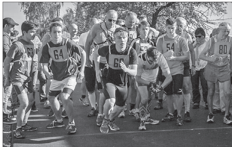
Moment startu kategorii 19-35 lat chłopcy.