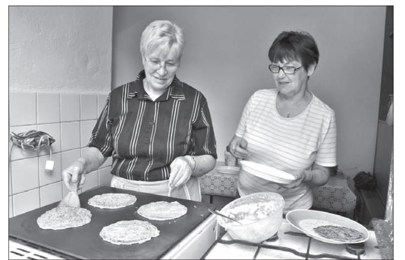
Do piątku można wpaść do Caritasu na placki z blachy i po informacje nt. usług socjalnych.

Wczoraj odbył się Dzień Otwarty również w budynku miejskiego