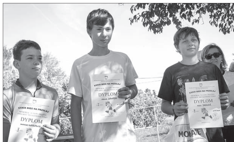
Zwycięcy biegu przełajowego w kategorii 12-13 lat chłopcy.