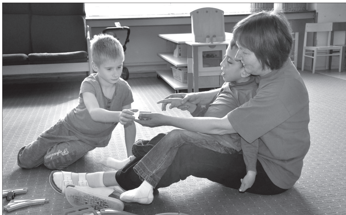
Zajęcia w ośrodku dziennym „Paprsek” dla dzieci niepełnosprawnych.