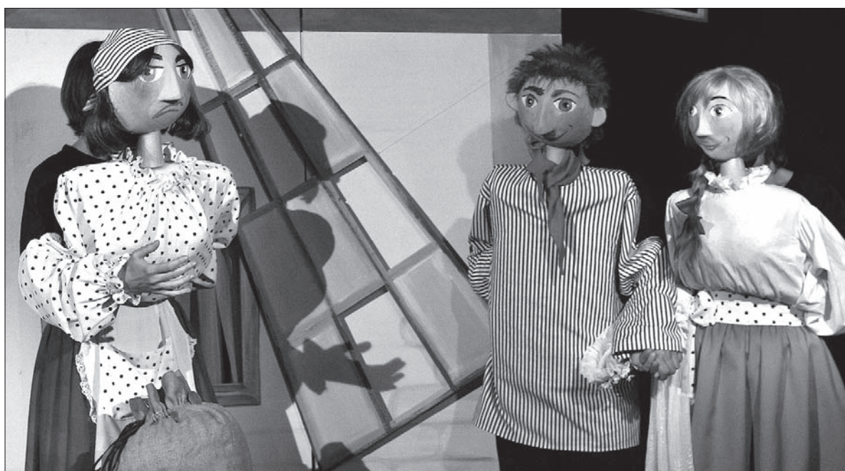
Scena z przedstawienia.