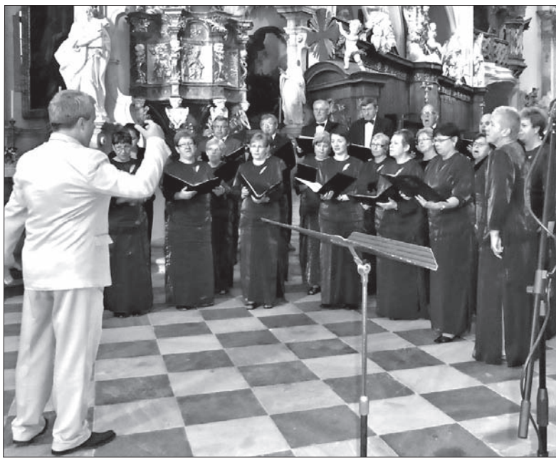
Chór „Dźwięk” zaliczył kolejny udany festiwal.

Zaraz po obiedzie w Bazylice Wniebowzięcia Panny Maryi w Zamku odbywały się próby poszczególnych chórów oraz wspólna próba. Na zakończenie festiwalu zespoły wykonały bowiem utwór „Ave Maria” (J. Busto).